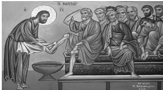
Ἡ Ἐκκλησία δὲν εἶναι φωνασκοῦσα ἐξουσία, ἀλλὰ σιωπῶσα διακονία.

«Πρέπει νὰ καταλάβουμε ὅτι ἡ κανονικὴ παράδοση τῆς Ἐκκλησίας δὲν σταματᾷ καὶ ὅτι στὴν πορεία πρὸς τὰ ἔσχατα ἡ Ἐκκλησία ὀφείλει νὰ ἀνοίγη δρόμους πλατύτερους, μὲ φιλόνηρωπο τρόπο, χωρὶς νὰ θίγεται τὸ δόγμα», ἐπαναλαμβάνοντας ὅτι «Ποιμαντικὴ εἶναι ἡ βίωση καὶ ἡ ἔκφραση τῆς ἀγαπῶσης τὸν Θεὸ καρδίας» 15 .