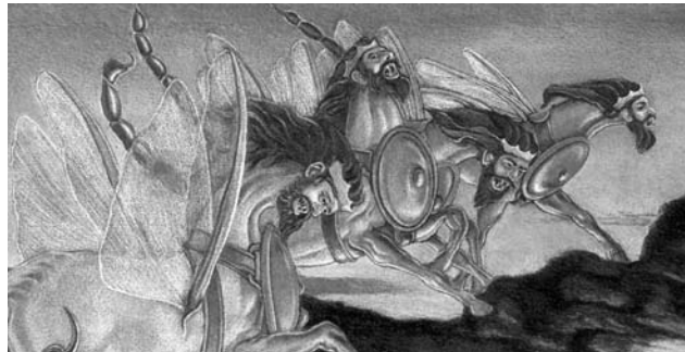
Εἰκόνα 1. ΑΚΡΙΑΕΣ-ΤΕΡΑΤΑ. Αὐτοὶ εἶναι οἱ «ἄγιοι» τῆς «Σκοπιᾶς». «Ἀποκάλυψη τὸ μεγαλειώδες...», σελ. 145

Μέ αὐτὴ τὴν «πνευματική» τροφή οἱ ὀπαδοὶ τῆς «Σκοπιᾶς» τρέφονται τέσσερις φορές περίπου τὴν ἐβδομάδα. Ὅμως γιὰ νά ἐμπεδώσουν καλύτερα αὐτὰ πού ἀκοῦν καί διαβάζουν στὰ ἐντυπα τῆς «Σκοπιᾶς» ὑπάρχουν καί οἱ ἀνάλογες φωτογραφίες, ὥστε ἡ πλύση ἐγκεφάλου νά εἶναι πλήρης, μέ ἓνα ψυχικό κόσμο ἀλλοιωμένο.