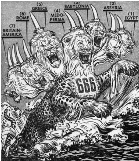
Εικόνα 4. Τά επτά επικίνδυνα κράτη που καταστρέφονται κατά τον Ἀρμαγεδδώνα. Τό πέμπτο ἢ ΕΛΛΑΣ. «Σκοπιά», 1-9-66.

Ἔτσι ὅσοι δέν ἀνήκουν στή "Σκοπιά" εἶναι μέλη τοῦ "θηρίου" καί θά σφαγοῦν. Αὐτό ὅμως δέν ἐμποδίζει τήν ὀργάνωση τῶν «μαρτύρων τοῦ Ἰεχωβά» νά ζητᾶ ἀπό τό "θηρίο" καί νά ἐπιτυγχάνει ἀποφάσεις πού τήν εὐνοοῦν γιά τήν δράση της, δηλαδή τό νά κηρύττει ὅλα αὐτά ἐναντίον τοῦ "θηρίου".