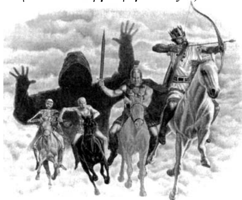
Εἰκόνα 3. Σκελετοὶ ἐφιπποὶ μέ νεκροκεφαλές καί φαντάσματα, τρόμος καί φόβος, ἐφιάλης. «Σκοπιὰ», 1-5-'86, ἐξώφυλλο.