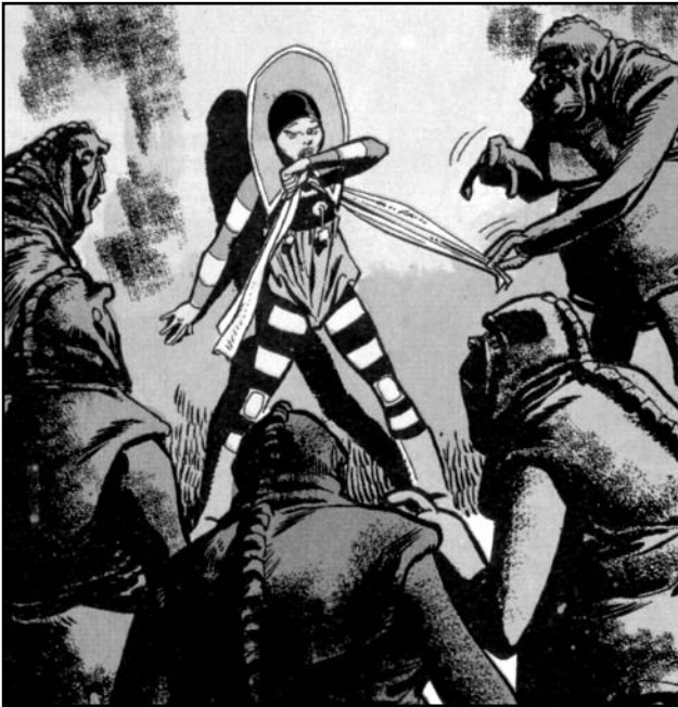
Αυτές οι εικόνες έφθασαν σέ άθωα παιδικά μάτια μέσω τών κόμικς τής «Καθημερινής».