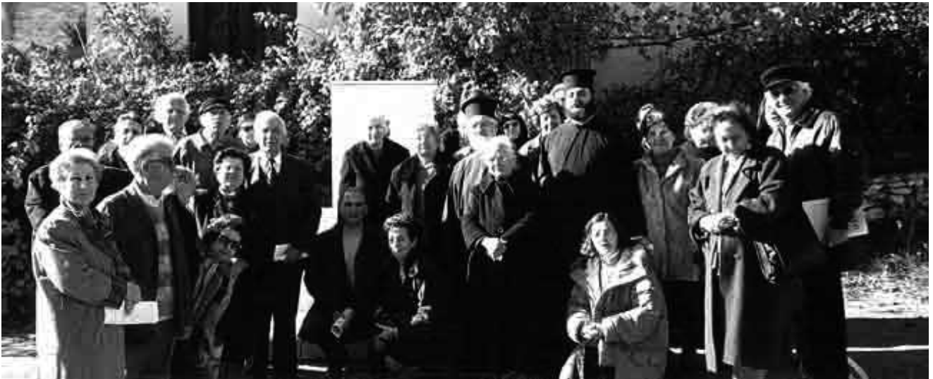
Άπό τήν επίσκεψη τῶν συνεργατῶν τῆς Ἐνώσεως στόν τόπο τῆς καταγωγῆς τοῦ ἀεμιήστου π. Ἀντωνίου Ἀλεβιζοπούλου.

ή, νόημα πού ἀνταποκρίνεται στήν ὑπαρξιακή ταυτότητα τοῦ ἀνθρώπου. Ὄταν κανεῖς μάθει περισσότερο γιά τήν Ὁρθόδοξη πίστη καί γνωρίσει τήν ὀριοθέτηση τῆς πίστεώς του δέν κινδυνεύει ἀπό τίς αἰρετικές σειρήνες πού τόν περιμένουν σέ κάθε «πέρασμα» τῆς ζωῆς του.