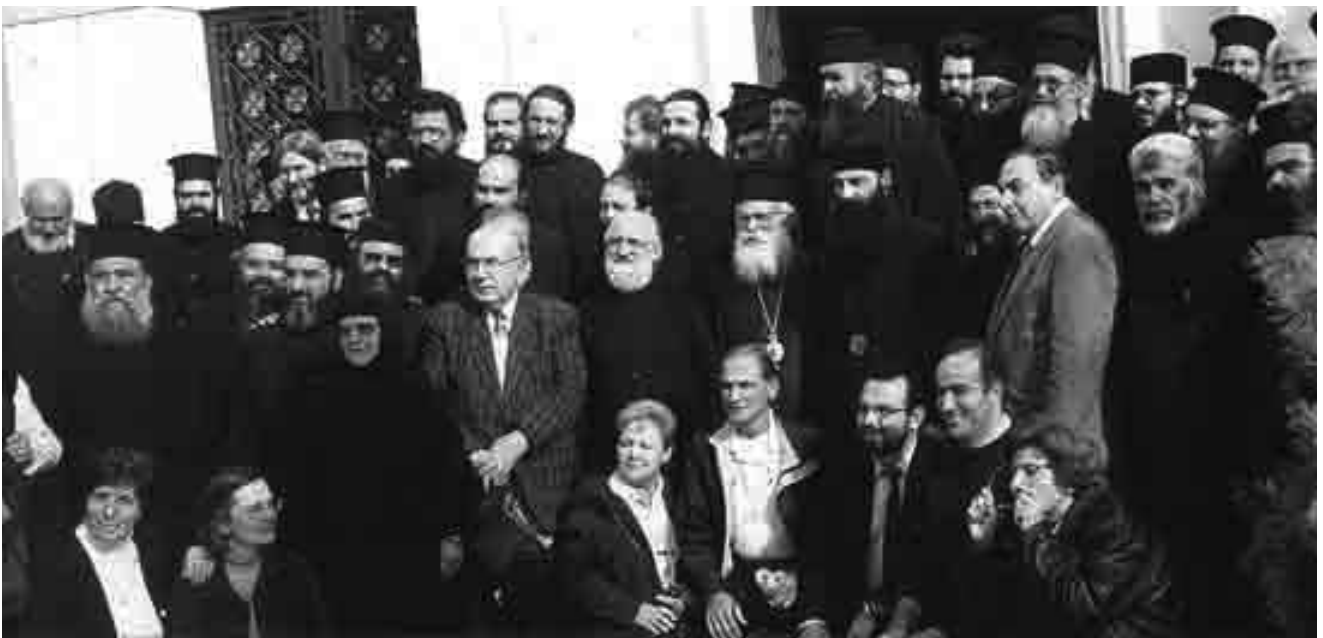
Ἀπὸ τὴν ΙΓ' Πανορθόδοξη Συνδιάσκεψη γιὰ θέματα αἵρέσεων καὶ παραθρησκείας

† Ο ΑΡΧΙΕΠΙΣΚΟΠΟΣ ΑΘΗΝΩΝ ΚΑΙ ΠΑΧΗΣ ΕΛΛΑΔΟΣ ΧΡΙΣΤΟΔΟΥΛΟΣ