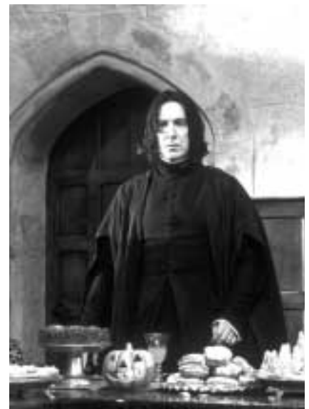
Μέρος ἀπό τό διδακτικό προσωπικό τοῦ σχολείου Χόγκουαρτς γιά μάγους καί μάγισσες.