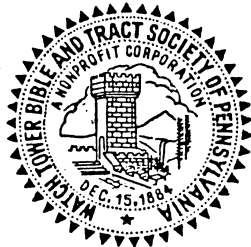
SIEGEL DER GESELLSCHAFT, 1956

Ἡ σφραγίδα τῆς «Σκοπιᾶς» τὸ 1884 καὶ τὸ 1956.