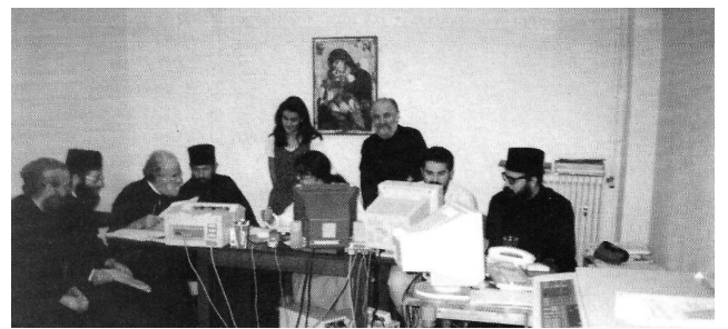
Ζ' Πανορθόδοξη Συνδιάσκεψη (ἡ τελευταία γι' αὐτόν). Ἀσθενής ἀλλά ἀκάματος

Ἀκολουθώντας κι ἐμεῖς τίς δικές του ὑποθήκες, γιά εἴκοσι τώρα χρόνια, δημοσιεύουμε τό κείμενο αὐτό, μέ τήν βεβαιότητα ὅτι θά εἶναι ἕνα πολύτιμο «ἐργαλεῖο» στήν ποιμαντική στρατηγική τῆς Ἐκκλησίας μας ἔναντι τῶν αἰρέσεων.