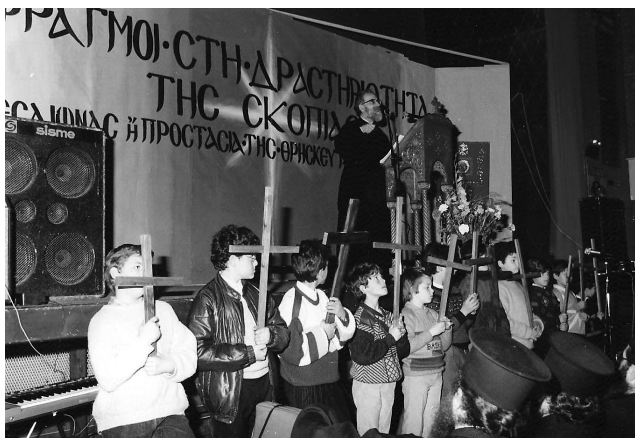
Στά Μέγαρα, αντιχιλιαστική έκδήλωση

Μέσα σ' αυτό τόν κόσμο ή Όρθόδοξη Έκκλησία ἔρχεται νά προσφέρει έλπίδα και νά κηρύξει πώς Κύριος τής ιστορίας είναι ό Χριστός, ό όποιος θά ἔλθει νά ανακαινίσει τόν κόσμο και νά τόν ἐλευθερώσει από τή δουλεία τής φθοράς, νά τόν ὀδηγήσει στην ἐλευθερία τών υἱῶν του Θεού, στην αιώνια