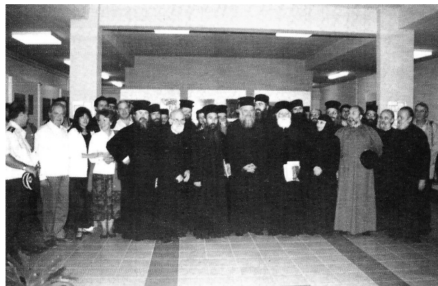
Ἀπό τήν Ζ' Πανορθόδοξη Συνδιάσκεψη στήν Ἀλίαρτο (20-26.9.1995)

Ἐξάλλου ἡ χριστιανική πίστη δέν ἐμποτίζει οὔτε προσδιορίζει πλέον ζωτικούς τομείς τῆς ζωῆς τῶν λαῶν τῆς Εὐρώπης. Τέτοιοι τομείς εἶναι ἡ παιδεία, ἡ νομοθεσία, ἡ πολιτική, τά μέσα μαζικῆς ἐνημερώσεως.