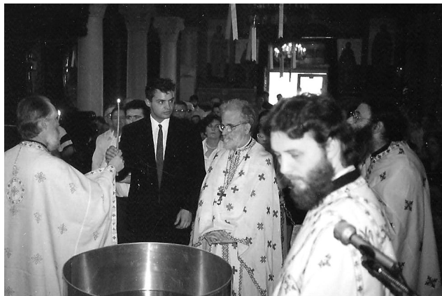
Βάπτιση καί ένταξη στην Έκκλησία, στόν Ι. Ναό Αγ. Σπυρίδωνος Παγκρατίου

Τό φλογερό του παράδειγμα, εύχομαι, νά μιλήσει στις καρδιές όλων μας. Αιώνια του ή μνήμη.