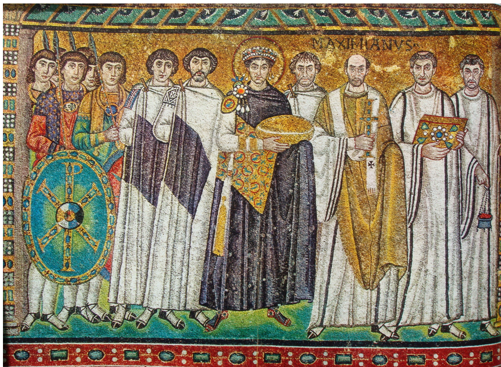
Εικών 1: Άγιος Βιτάλιος, Ραβέννα, στ' αϊ.