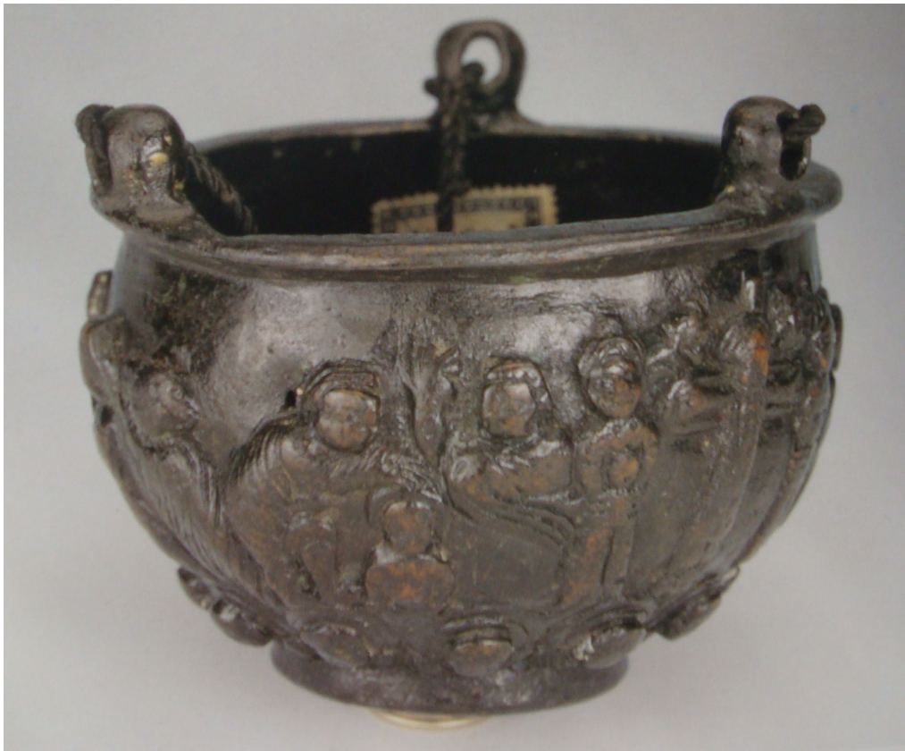
Εικών 4: Θυματήριο του θ'-ι' αϊ.