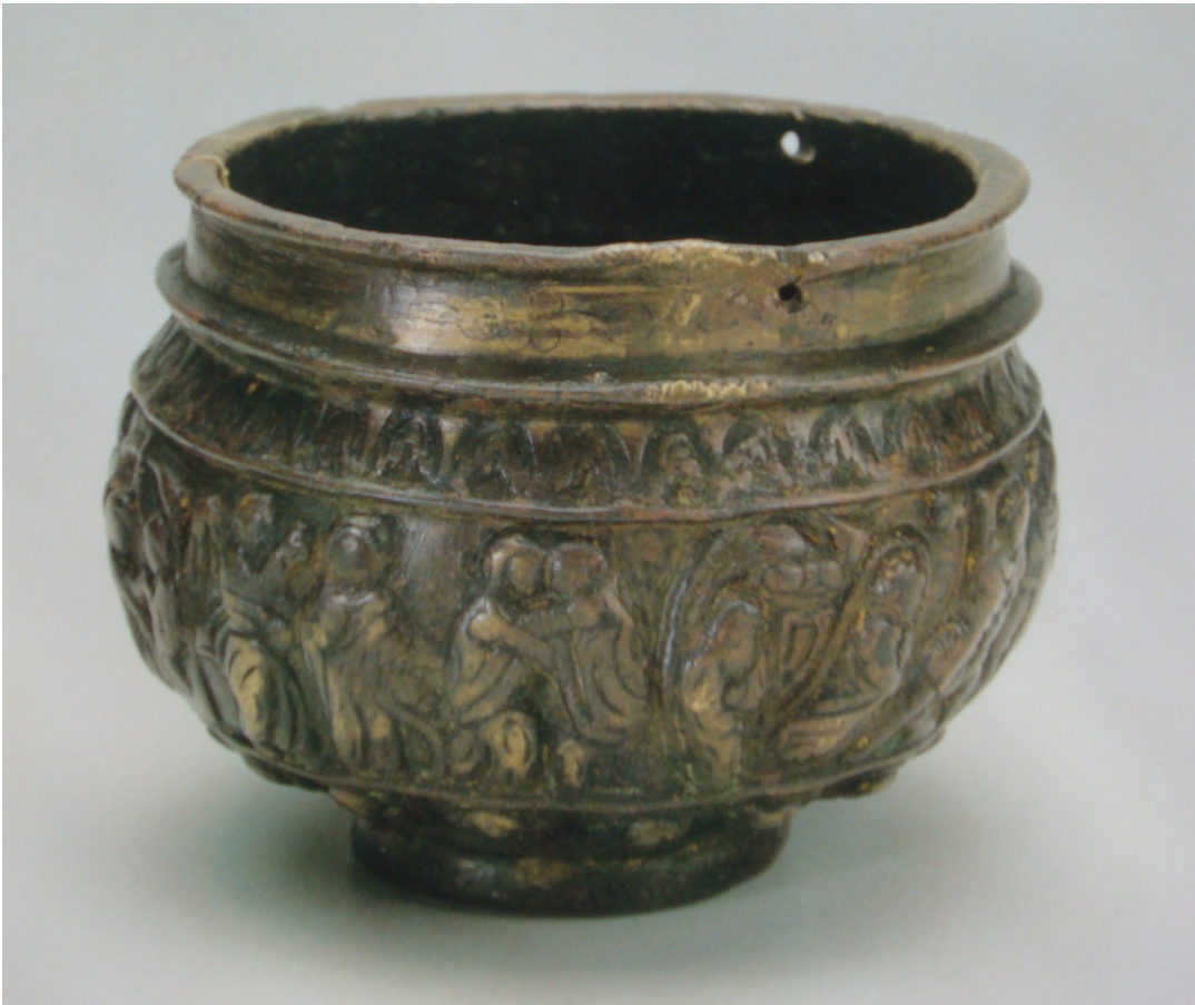
Εικὼν 4: Θυματήριο τοῦ ζ' αἰ.