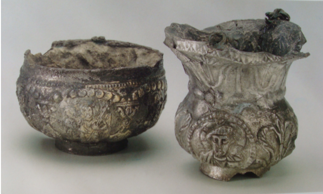
Εικὼν 3: Θυματήρια τοῦ ζ' αἰ.