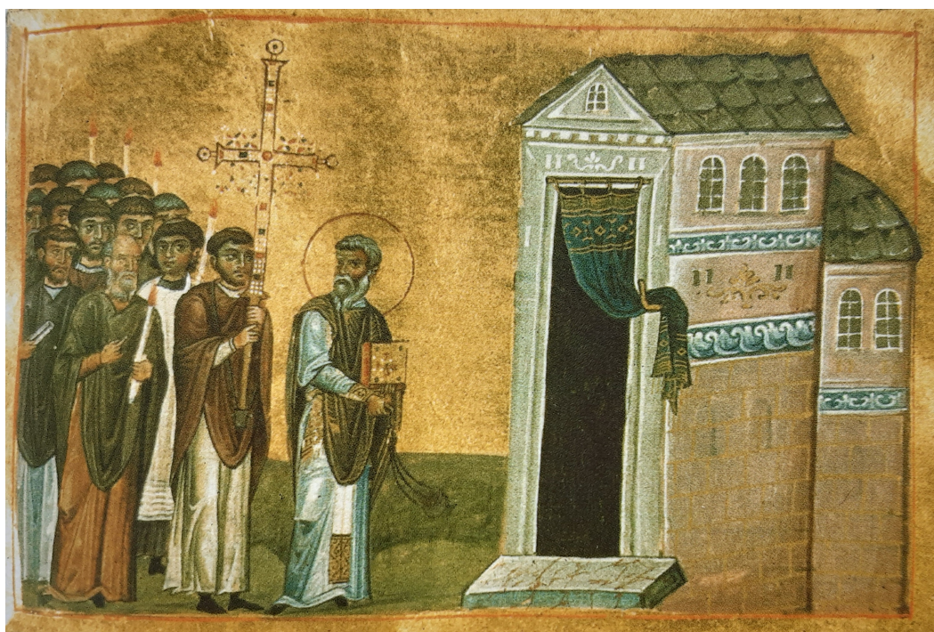
Εικών 2: Μηνολόγιον τοῦ Βασιλείου Β' (περ. 976–1025) - Λιτή ἢ Λιτανεία, ι' αϊ.