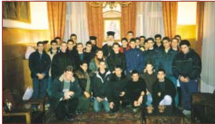
Ἐπίσκεψη τῶν παιδιῶν τῆς «Ἐνο- ριακῆς νεανικῆς ἀντίστασης» τῆς ἐνορίας τοῦ Ἱεροῦ Ναοῦ Εὐαγγελι- στρίας Λευκάδος στήν Ἱερά Ἀρχιε- πισκοπή Ἀθηνῶν