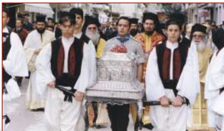
Ἀπό τόν ἑορτασμό τῆς Ἁγίας Θεοδώρας, Βασιλίσσης Ἄρτης (11.3.2002)