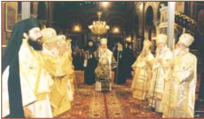
Ἀρχιεπισκοπική καί Συνοδική Θεία Λειτουργία τήν Κυριακή τῆς Ὁρθο- δοξίας στό Μητροπολιτικό Ναό Ἀθηνῶν (24.3.2002)