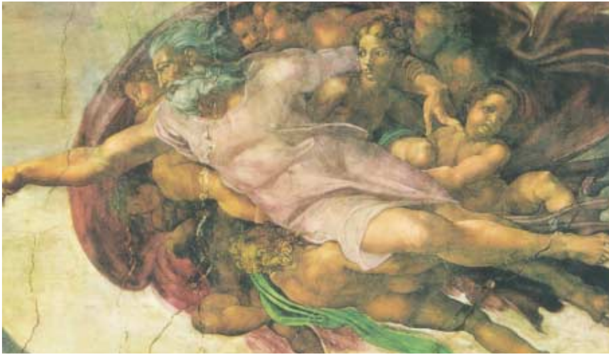
Λεπτομέρεια από το έργο του Μιχαήλ Ἀγγέλου “Ἡ Δημιουργία”

Λουκάς. 3 Ὁ Ἰησοῦς Χριστὸς τὴν ἀπεδέχετο, οἱ «φωτισμένοι» ἔξυπνοι ἐχθροὶ τῆς δὲν τὴν καταδέχονται (!). Ὁ Εὐαγγελιστὴς Μᾶρκος, γιὰ νὰ ὀμιλήσῃ περὶ ἀναστάσεως νεκρῶν, παραπέμπει στὴν Παλαιὰ Διαθήκη. 4 Ἀλλὰ καὶ ὅλοι οἱ Συγγραφεῖς τῆς Καινῆς Διαθήκης, ὅταν ἐκφράζονται μὲ τὸ « γέγραπται γάρ » ἢ « ἵνα ἡ Γραφή πληρωθῇ » ἢ « ἡ Γραφή λέγει » ἢ « ἐρευνᾶτε τὰς Γραφὰς » κ.λπ., περὶ ποίας Γραφῆς ὀμιλοῦν, ἂν ὄχι περὶ τῆς Παλαιᾶς Διαθήκης;