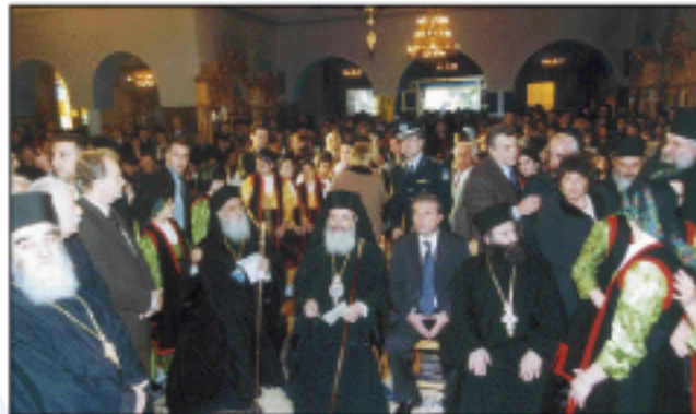
Ι. Ναός Ἁγίου Τρύφωνος Παλλήνη. Τελετή κοπῆς πίτας παρουσία νέων τῆς Ἱερᾶς Μητροπόλεως Μεσογαίας (27.1.2002)