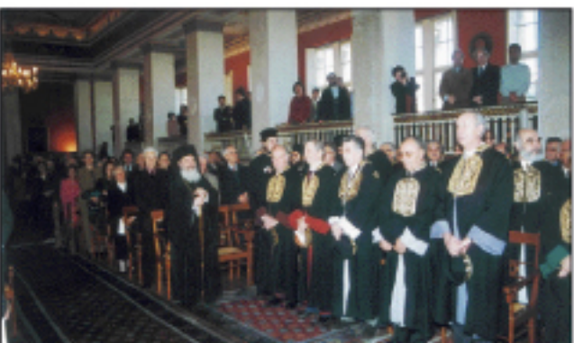
Ἐκδήλωση στὸ Πανεπιστήμιο Ἀθηνῶν ἐπὶ τῇ ἐορτῇ τῶν Τριῶν Ἱεραρχῶν (30.1.2002)