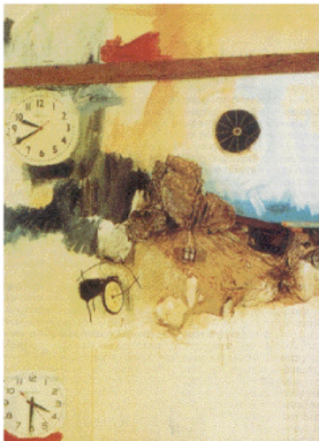
Ρόμπερτ Ράουτσενμπεργκ «Απόθεμα» 1961, Μουσείο Ἀμερικανικῆς Τέχνης, Ουάσιγκτον. Ἀπὸ τὴν ἐκθεσὴ τῆς Ἐθνικῆς Πινακοθήκης στὸ Λονδίνο μὲ τίτλο «Ἀνίχνευση τοῦ χρόνου» τὸν Δεκέμβριο τοῦ 2000 («Ἡ Καθημερινή» 28 Δεκεμβρίου 2000).

Θὰ ἦταν πολὺ ἐνδιαφέροντα μίᾳ ἔρευνα ποὺ θὰ ἀναζητοῦσε καὶ θὰ ἀνέλυε συστηματικὰ τὴν παραγωγὴ τῶν ήμερολογίων τῶν Ί. Μητροπόλεων. Θὰ ἦταν χρήσιμο νὰ τεθοῦν ἐρωτήματα τοῦ τύπου: γιατί ἐπελέγη τὸ τὰδε θέμα; ποιές ἦσαν οἱ πηγές συγκροτήσεώς του; τί ρόλο παίζει ἡ εἰκονογράφηση; τὰ θέματα ἐπιλέγονται βάσει συγκεκρι-