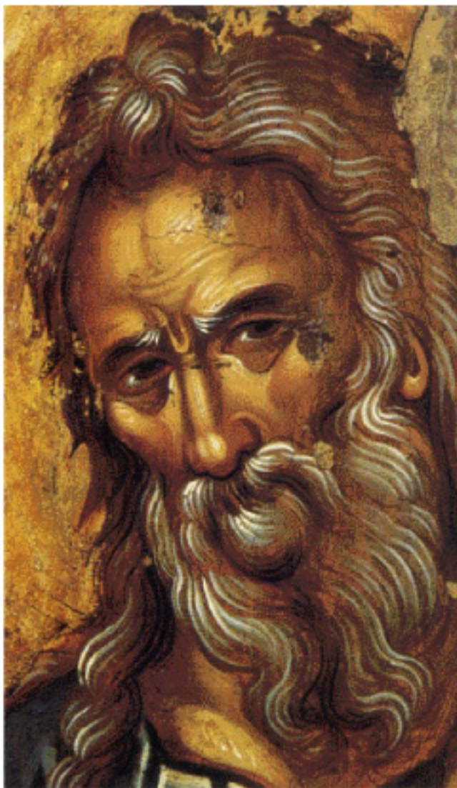
Ὁ Ἅγιος Συμεὼν ὁ Θεοδόχος (Μ. Δαμασκηνοῦ, 16ος αἰ. Ναὸς Ἁγίου Ματθαίου Σιναΐτων).

ἡ καρδιά τους εἶναι ἀφοσιωμένη στὸ Διδάσκαλό τους. Ὅταν, λοιπόν, ὁ ἀναστημένος Κύριος ἐμφανίζεται στὰ μάτια τους, ἐκεῖνοι χαίρονται ποῦ τὸν βλέπουν. « Ἐχάρησαν οὖν οἱ μαθηταὶ ἰδόντες τὸν Κύριον. » (Ἰωάν. 20, 20).