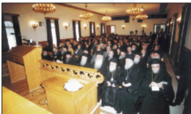
Συνέδριο στὴ μνήμη τοῦ Ἱεροῦ Φωτίου στὴν Ἱερά Μονὴ Πεντέλης (6.2.2002)