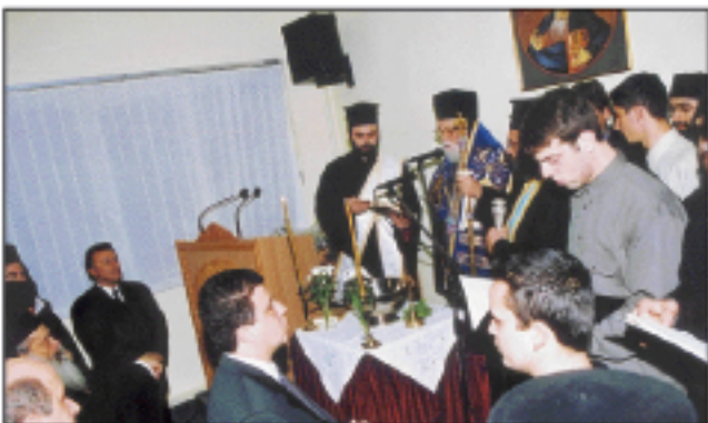
Στιγμιότυπο ἀπὸ τὸν ἀγιασμό τοῦ νέου ἐκπαιδευτηρίου τοῦ Ἐκκλ. Λυκείου Νεαπόλεως