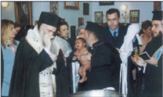
Βάπτιση νηπίων στις γυναικείες φυλακές Κορυδαλλού (18.1.2002)