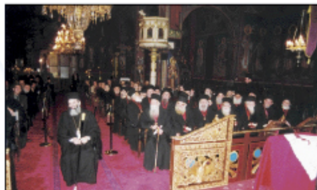
Βράβευση προσωπικοτήτων της ελληνικής κοινωνίας υπό της Ιεράς Συνόδου της Εκκλησίας της Ελλάδος (9.1.2002)