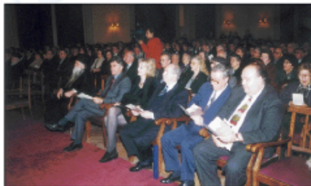
Ἀπὸ τὴν ἀπονομὴ τῶν ἐτησίων βραβείων τῆς Ἑλληνικῆς Ἐταιρείας Χριστιανικῶν Γραμμάτων (28.1.2002)