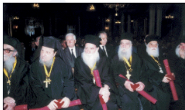
Τιμητική διάκριση της Ι. Συνόδου σε ιερείς, καθηγητές Παν/μίου και πρωτοψάλτες (5.2.2002)