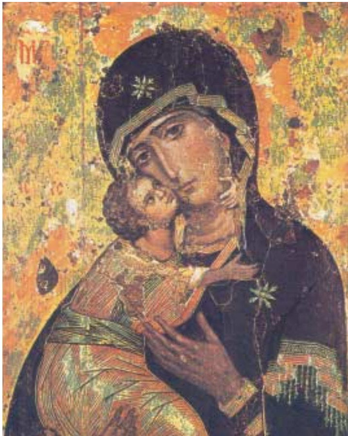
Ἡ Παναγία τοῦ Βλαδιμήρου (1125)

Ὁ Ἅγιος Εἰρηναῖος εἶναι πράγματι ὁ πρῶτος ὁ ὁποῖος ἀνέπτυξε σὲ βάθος τὴν ἀντίθεση Ἐῶν – Μαρία καὶ ἐτόνισε ὅτι ὅπως ἡ ἀνυπακοὴ τῆς μιᾶς ἔφερε στὸν κόσμον τὸ θάνατο, ἔτσι ἡ ὑπακοὴ τῆς ἄλλης χάρισε στὴν ἀνθρωπότητα τὴ ζωὴ. Ὁ ἴδιος ἀνοῖξε ἐπίσης τὸ δρόμον στὸν κεφαλιώδη παραλληλισμὸ Μαρία – Ἐκκλησία μὲ τὴ διατύπωση ὅτι ἡ Μαρία εἶναι ἡ