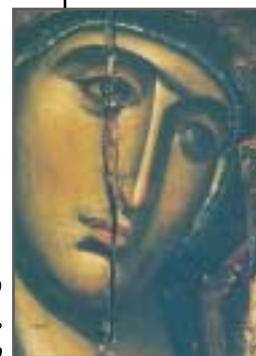
ΕΞΩΦΥΛΛΟ Η Θεοτόκος, Ι. Μ. Βατοπαιδίου