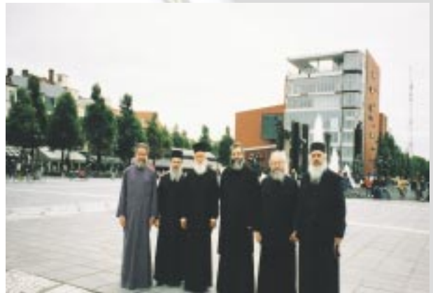
Ἡ ἐξ Ἀρχιερέων ἀποστολή τῆς Ἐκκλησίας τῆς Ἑλλάδος στο Ἐὐρωκοινοβούλιο (Σεπ. 2002).