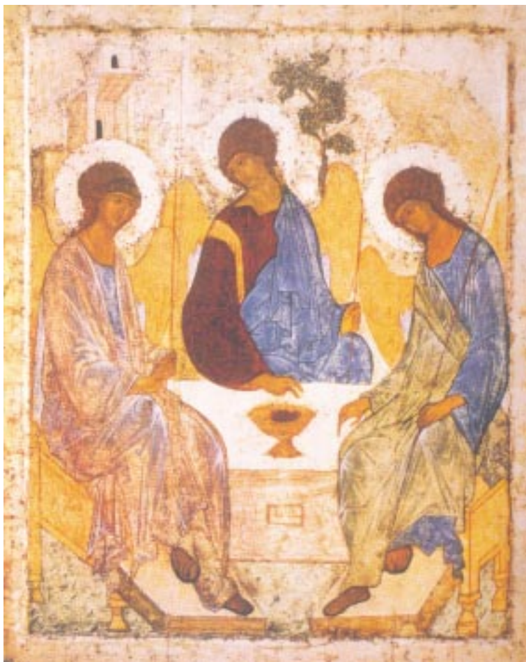
Ἡ φιλοξενία τοῦ Ἀβραάμ (Α. Ρουμπλιώφ, 1411)

στὴν «ξενία», τὴν «φιλοξενία», τὸ «ξενίζεῖν», τὸ «ξενοδοχεῖν», «συνάγειν» καὶ «ὑπολαμβάνειν». Δὲν ἔχομε δηλαδὴ στὸν Χριστιανισμό μιὰ ἀπλή καὶ παθητικὴ ἀνεκτικότητα τῆς ἐτερότητας τοῦ ξένου, ἀλλὰ μιὰ δυναμικὴ κατάφαση τοῦ προσώπου του, ἐκφραζόμενη μὲ κοινωνία ἀγάπης, μιὰ στάση ἰσότητος καὶ ἀπόλυτου σεβασμοῦ τοῦ προσώπου καὶ τῆς ἰδιοπροσωπίας τοῦ ξένου. Γιὰ τὸν χριστιανὸ ὁ σεβασμὸς τοῦ ἀνθρωπίνου προσώπου, ἡ ἀναγνώριση τοῦ ἴδιου τοῦ Χριστοῦ στὸ πρό-