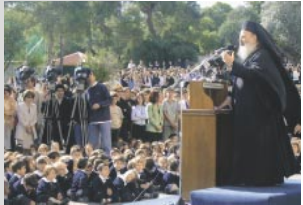
Ὁμιλία του Μακ. Ἀρχιεπισκόπου στους μαθητές του Ἀρσακείου (29/10/2002).