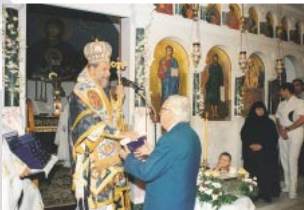
Ἀπό τή θ. Λειτουργία στον Ἱ. Ν. Ἁγ. Πελαγίας Τήνου καί τήν ἀπονομή ἀναμνηστικῶν μεταλλίων στους εὐεργέτες τῆς Ἱερᾶς Μονῆς (Ὀκτ. 2002).