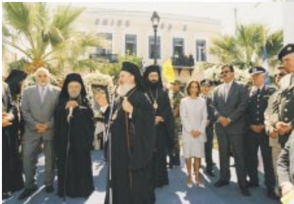
Ἀπό τις ἐπετειακές ἐκδηλώσεις στη Χίο για τή συμπλήρωση 80 χρόνων ἀπό τή Μικρασιατική Καταστροφή (Ὀκτ. 2002).