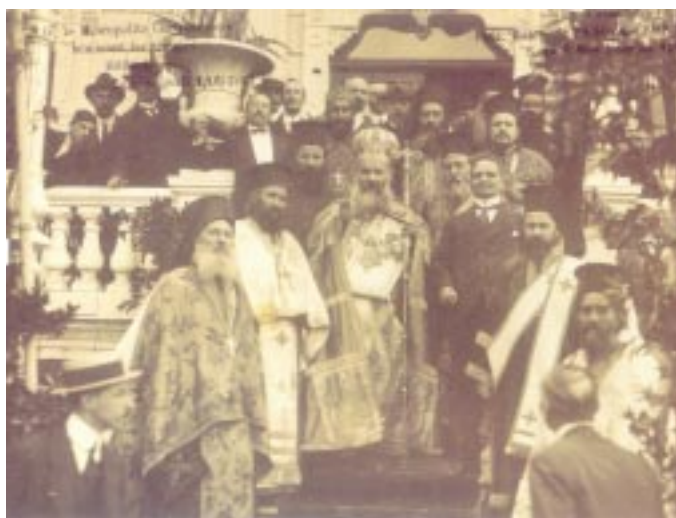
Ὁ ἔθνομάρτυς μητροπολίτης Σμύρνης Χρυσόστομος

ρα καὶ ἔθνομάρτυρα Πατριάρχη Γρηγόριο Ε', ὅταν αὐτὸς ἦταν Μητροπολίτης Σμύρνης· τὸ ὅτι ἡ πρώτη φροντίδα τῶν δημογερόντων σὲ κάθε κοινότητα ἦταν ἡ ἀνέγερσις ἢ ἡ ἐπισκευὴ καὶ ὁ ἐξωραϊσμός τῶν ἱερῶν ναῶν, γύρω ἀπὸ τοὺς ὁποίους συσπειρώνονταν ἡ κοινότης· τὸ ὅτι οἱ κοινότητες ἀνήγειραν πολλὰ ξωκκλήσια, ὅπως λ.χ. στὴν Καππαδοκία ἢ ὅπως τὸ ξωκκλήσι τοῦ προφήτου Ἡλία, πού ὡς « κάτασπρο μπιμπελό » στὴν κορυφὴ ἐνὸς λόφου στὰ Βουρλά περιγράφει ὁ ἀείμνηστος Νικ. Μηλιώρης· τὸ ὅτι πολλὲς οἰκογένειες ἐκτιζαν στὶς αὐλὲς τῶν σπιτιῶν τους οἰκογενειακὰ πα-