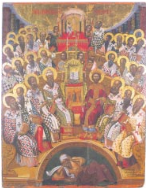
Ή Ζ' έν Νικαία Οικουμενική Σύνοδος (787)

φορά τής άλησμόνητης πατρίδος του έντάσσεται σ' ένα ευρύτερο όργανικό όλο. Τό όλον αυτό, όταν κατοπτρεύεται υπό τόν ευρυγώνιο φακό τής όλότητας τής έλληνορθόδοξου παραδόσεως, έχει και άλλο ένα μοναδικό στον κόσμο προνόμιο και γνώρισμα. Ποιον είναι αυτό; "Όχι εδώ κι εκεί σε μερικές μόνον περιοχές, αλλά κυριολεκτικώς σε κάθε σπιθαμή τής μικρασιατικής