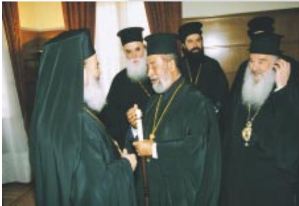
Στιγμιότυπο από την έορτή του Μακ. Ἀρχιεπισκόπου (21/10/2002).