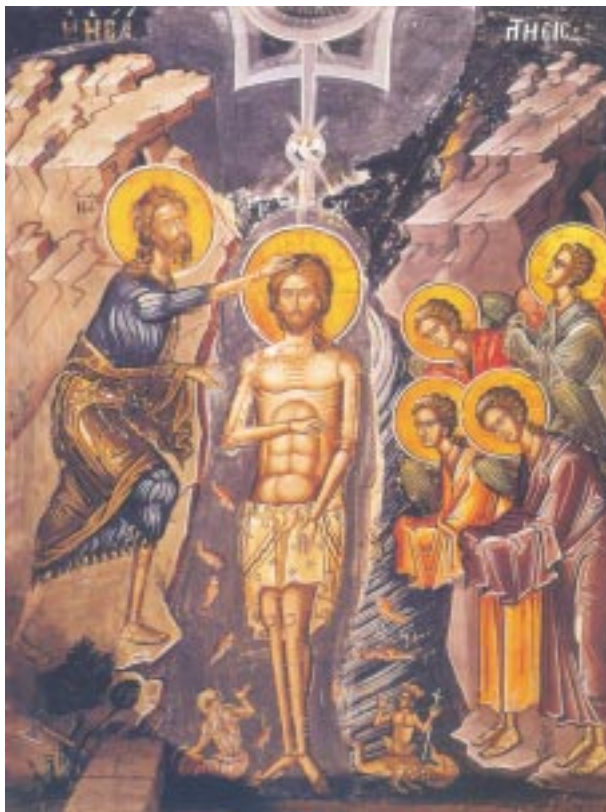
Ή Βάπτισμα του Κυρίου

βάπτισμα των παιδιών είναι αντίθετο προς τήν διδασκαλία τής Καινής Διαθήκης. Δέν ύπάρχει καμία έντολή, ούτε παράδειγμα, ούτε και καμία άπολύτως νύξη, ότι έβαπτίσθη νηπιο ύπό του Κυρίου ή των μαθητών του» 3 . Και