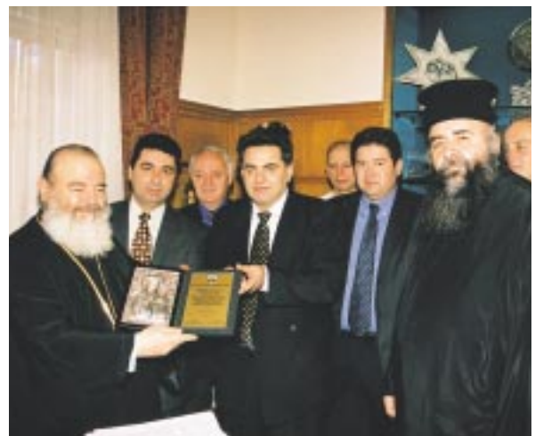
Το προεδρείο των Αξιωματικών της Ελληνικής Αστυνομίας έπισκέφτηκε προσφάτως τον Μακαριώτατο Αρχιεπίσκοπο κ. Χριστόδουλο.

«Ο Αστυνομικός ασκεί ένα πολύτιμο λειτούργημα και καθημερινά έρχεται αντιμέτωπος με μύριους κινδύνους, ριψοκινδυνεύει ακόμη και την σωματική του άκεραιότητα. Ως άνθρωπος και ως Χριστιανός νοιώθει μεγάλη την ανάγκη για πνευματική συμπαράσταση και ήθική ενίσχυση στο έργο του και στην ζωή του. Πολλές φορές αισθάνεται ευεργετικά δίπλα του την παρουσία του ιερέως με τον πνευματικό λό-