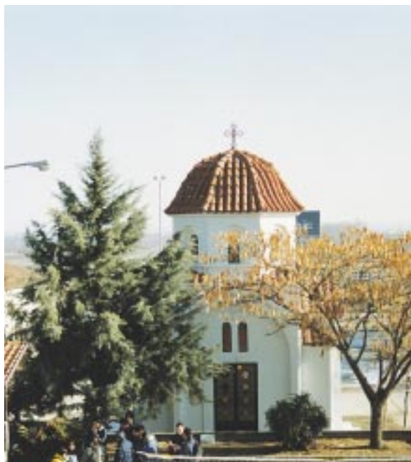
Το Παρεκκλήσιο Άγιων Κυρίλλου και Μεθοδίου στο Σχολικό Συγκρότημα Έργοχωρίου Βεροίας.

Άναμφισβήτητα, μεγιστοποίηση του έργου αυτού επιτυγχάνεται με την ίδρυση έκκλησιαστικών σχολείων, φροντιστηρίων ένισχυτικής διδασκαλίας ή ξένων γλωσσών, καθώς και παιδικών σταθμών, κάτι που πολύ σωστά άποτελεί βασική προτεραιότητα της Έκκλησίας μας. Πρόκειται για ύποδομές που συμβάλλουν στην άσκηση ενός ποιμαντικού νεανικού έργου, με έλαχιστοποίηση των άρνητικών στοιχείων όποιαδήποτε άλλη προσπάθεια.