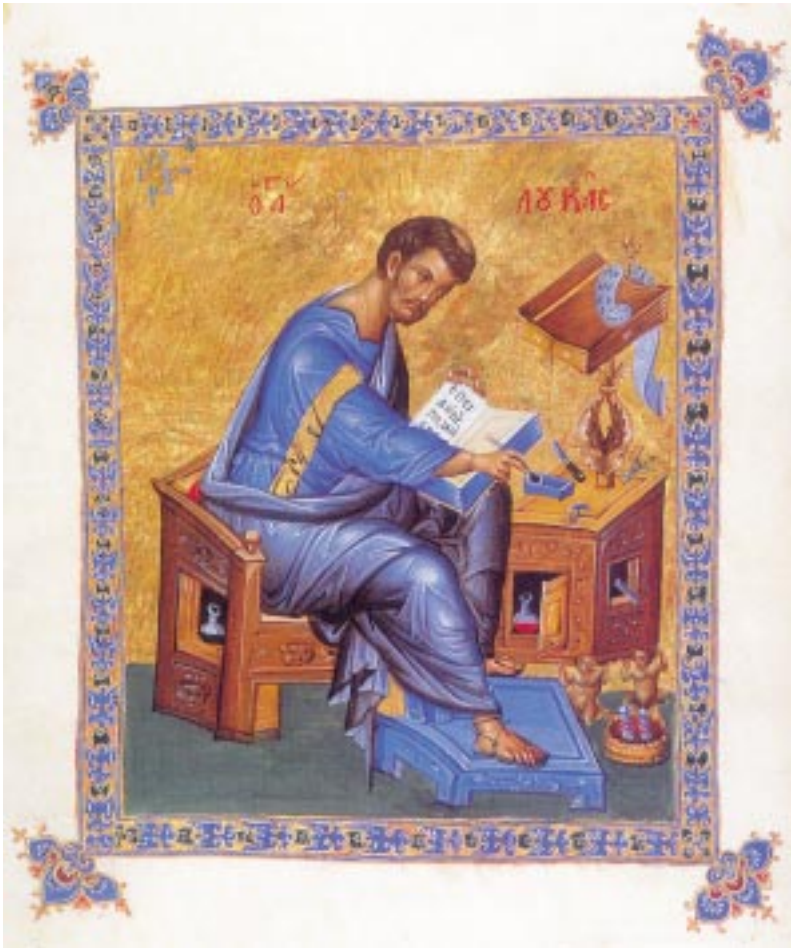
Ὁ Εὐαγγελιστὴς Λουκάς. Μικρογραφία βυζαντινοῦ χειρογράφου

Τὸν ὀρθὸ τρόπο τῆς προσευχῆς μᾶς τὸν ὑποδεικνύει ἡ σημερινή παραβολή, ὅπως αὐτὸς ἐνσαρκώνεται ἀπὸ τὸ πρόσωπο τοῦ Τελώνη.