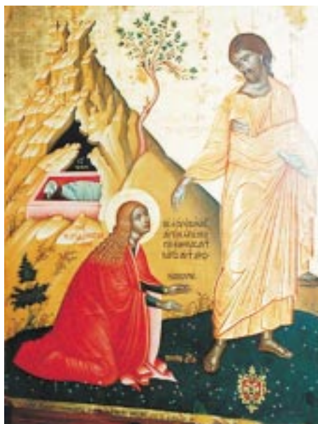
«Μὴ μου ἄπτου» Ὁ Ἰησοῦς ἐνώπιον τῆς Μαρίας Μαγδαληνῆς.

γονυκλισίας σύμφωνα μὲ τὸν 90ὸν Κανὸνα τῆς Στ' Οἰκουμενικῆς– στὴν πρωΐα τῆς Κυριακῆς τῆς Πεντηκοστῆς, ἀσφαλῶς γιὰ λόγους ποιμαντικούς. Ἐπομένως, κατὰ τὴν ἄποψιν αὐτὴν ἡ ἀπαγόρευση τῆς γονυκλισίας κατὰ τὶς Κυριακὲς δὲν ἔχει ἀπόλυτο χαρακτῆρα, ἀλλὰ δύναται νὰ παροραῖται χάριν ἄλλου πνευματικοῦ-ποιμαντικοῦ συμφέροντος. Ἡ θέση τοῦ Τρεμπέλα εἶναι ὄντως ὅτι «ἐφ' ὅσον ἐπετράπη ἡ μετάθεσις τοῦ Ἑσπερινοῦ εἰς τὴν πρωΐαν, ἡ ἀπαγορεύσις τῆς γο-