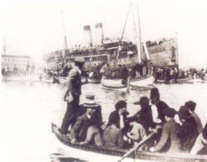
Οἱ Ἕλληνες τῆς Σμύρνης ὑποδέχονται με ἐνθουσιασμό τοὺς στρατιῶτες, πὺν ἀποβιβάζονται ἀπὸ τὸ ἀτμόπλοιο «Πατρίς».

Εἶναι ἐλπιδοφόρο ὅτι μερικὲς ἀπὸ τις σπίθες καὶ λαμπηδόνες τῆς μικρασιατικῆς παραδόσεως ἄρχισαν νὰ φωτίζουν γιὰ λίγο καὶ