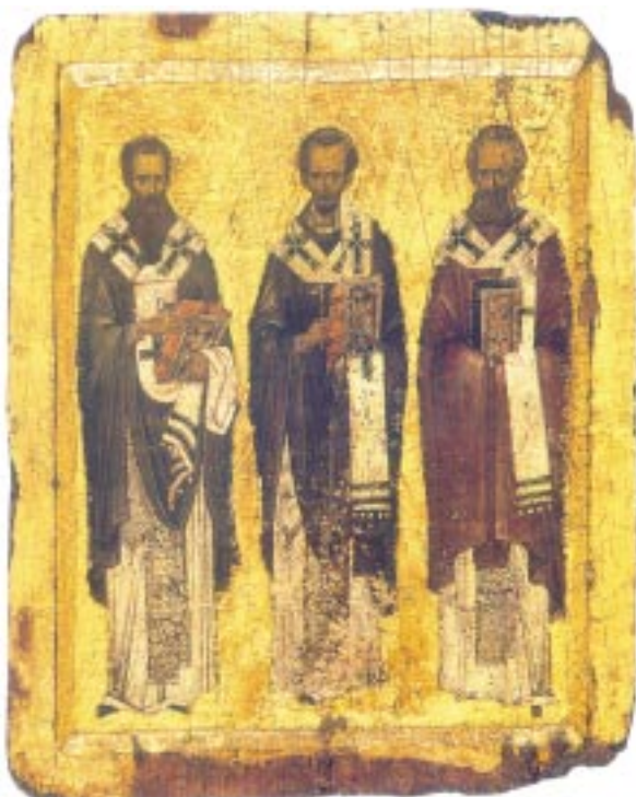
Οἱ Τρεῖς Ἱεράρχες. Δεύτερο ἡμισυ τοῦ 14ου αἰώνα.

αὐτοκράτορες τοῦ Βυζαντίου, τὸν Κωνσταντῖο καὶ τὸν Οὐάλεντα, οἱ ὁποῖοι, καὶ εἶναι πάρα πολὺ βασικὸ αὐτό, ἔπασχαν ὡς πρὸς τὸ Ὁρθόδοξο δόγμα, διότι ἦσαν Ἀρειανόφρονες. Ἐγιναν ἐπίσης καταστροφές μνημείων καὶ ἀπὸ τὸν Ἀλάριχον, Βασιλέα τῶν Γόθων, τότε ὁμως οἱ Ὁρθόδοξοι Χριστιανοὶ μετέτρεψαν, χωρὶς νὰ καταδαφίσουν, τὰ ἀρχαῖα μνημεῖα σὲ ἱεροὺς ναοὺς, γιὰ νὰ τὰ προφυλάξουν. Ὅταν δὲ ἀπὸ τὴν δρᾶσιν τῶν φυσικῶν φαινομένων (σεισμοὶ) κατέπιπταν βωμοὶ καὶ ἱερά τῶν προγόνων μας, οἱ Ὁρθόδοξοι Χριστιανοὶ δὲν εἶχαν κανένα πρόβλημα νὰ ἐνσωματώσουν στοὺς δικούς τους ναοὺς ὑλικά τῶν ἀρχαίων ναῶν (κιονόκρανα). Τελευταῖα ἐκδόθηκε ἓνα σπουδαιότατο βιβλίο-ντοκουμέντο γιὰ τὴν δράση τῶν Ἰησοῦϊτῶν στὴν Ἑλλάδα. Ἐκεῖ ἀναφέρεται μὲ συγκεκριμένα στοιχεῖα ἢ μανία καταστροφῆς τῶν μνημείων τοῦ ἀρχαιοελληνικοῦ πολιτισμοῦ ἀπὸ τοὺς ἀπεσταλμένους τοῦ Πάπα. Ὅπως καταλαβαίνει ὁμως ὁ καθένας, δὲν εἶναι δίκαιο νὰ χρεωθῆ ἡ Ὁρθόδοξη Ἐκκλησία τὰ ἀμαρτήματα τοῦ παπισμοῦ οὔτε νὰ ἀπολογηται γιὰ τὰ σφάλματά του. Θὰ ἦταν λάθος