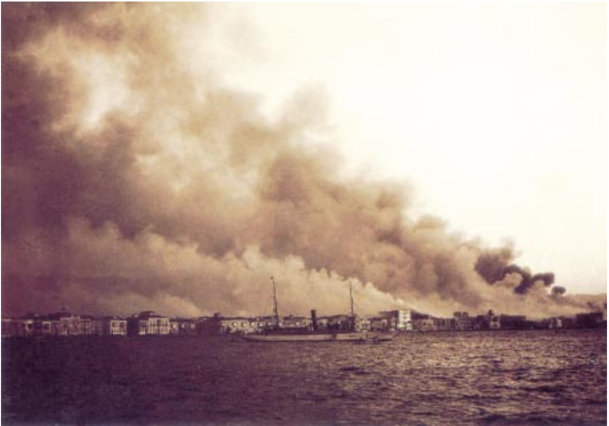
Ἡ πυρκαγιὰ τοῦ '22, μαζί μὲ τὴν Ἰωνικὴ πρωτεύουσα, ἀποτέφρωσε καὶ τὰ ὄνειρα τοῦ Ἑλληνισμοῦ στὴ μικρασιατικὴ γῆ.

«Ἐπιτελοῦμεν τὸ ἱερὸν μνημόσυνον καὶ ὄλων μὲν ἐκείνων, ὅσοι ἀποβιβασθέντες ὡς ἐλευθερωταὶ εἰς τὰς γελοέσσας τῆς Ἰωνίας ἀκτὰς ἀπέθανον τὸν ζηλωτὸν ὑπὲρ πίστεως