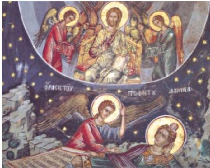
«Ὁρασις τοῦ προφήτου Δανιήλ», 1568

• Ὁ Θεὸς Πατέρας μετὰ τὴν παλαιοδιαθηκικὴ ἔννοια, δηλ. τῆς φροντίδας τοῦ Θεοῦ γιὰ τὴν ἱστορικὴ ἀποστολὴ τοῦ ἐκλε-