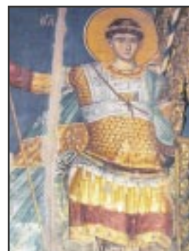
ΕΞΩΦΥΛΛΟ: Ο Άγιος Δημήτριος. Νωπογραφία του Μανουήλ Πανσέληνου, Άγιου Όρος.