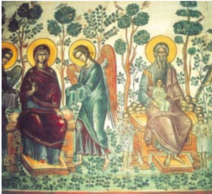
Ἡ Εὐφροσύνη τοῦ παραδείσου, 1568

Ἡ βιοτικὴ εὐημερία καὶ ἡ ἀτομικὴ ται, ἀλλὰ δὲν ἀρκοῦν γιὰ νὰ κάνουν τὸν ἄνθρωπο εὐτυχισμένο. «Ὁὺκ ἐπ' ἄρτω μόνω ζήσεται ἄνθρωπος» δηλώνει ἡ πανάρχαια σοφία τῆς βιβλικῆς παράδοσης χωρὶς καμμιά δόση ἠθικολογίας, ἀλλὰ ἀπὸ τὴν σκοπιὰ τοῦ ρεαλισμοῦ μόνο. Ἀξίζει νὰ προσέξουμε ὅμως ὅτι ἡ κτη-