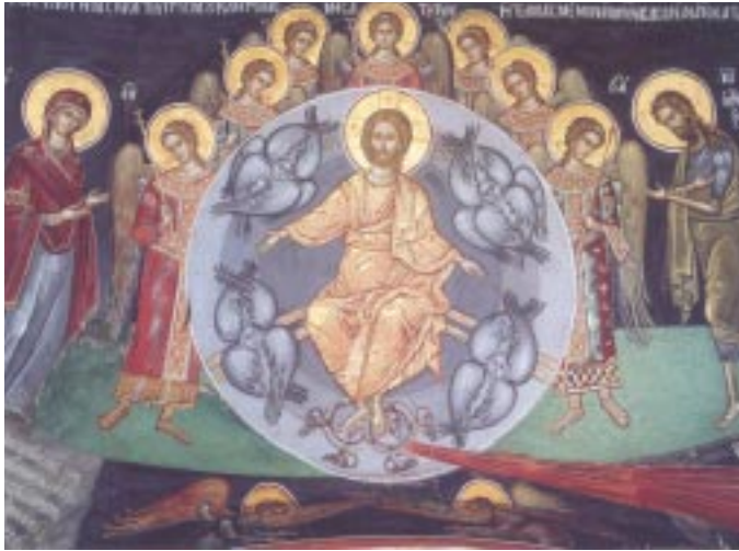
Ἡ Δευτέρα Παρουσία και ὁ Πύρινος Ποταμός, 1568

της Βαπτίσεως και του Γάμου, όταν θα λάβουν μέρος περισσότεροι του ενός Ιερείς να εξέρχονται όλοι μαζί για την τέλεσή του και όχι όποτε κρίνει ο καθένας ή να «μπαινοβγαίνουν». Να λείπουν οι κάθε είδους θεατρνισμοί. Τα Ίερά Μυστήρια δεν είναι «θέατρο». Να υποδεικνύεται στους φωτογράφους (από τους οποίους πρέπει να ζητείται κάρτα του Σωματίου τους) να είναι προσεκτικοί και να σέβονται και το χώρο και το Μυστήριο. Προσεκτικοί πρέπει να είναι οι Ίερείς και όταν, π.χ., οι μελλόνυμφοι έρχονται στο Γραφείο του Ίεροῦ Ναοῦ για την έκδοση Ἄδειας, οι οποίοι πρέπει να γίνονται δεκτοί με εὐγένεια, να τους παρέχεται κάθισμα, να μὴ γίνονται διακρίσεις, οὔτε, π.χ., να τους υποδεικνύεται «ποιός να κάνει τη