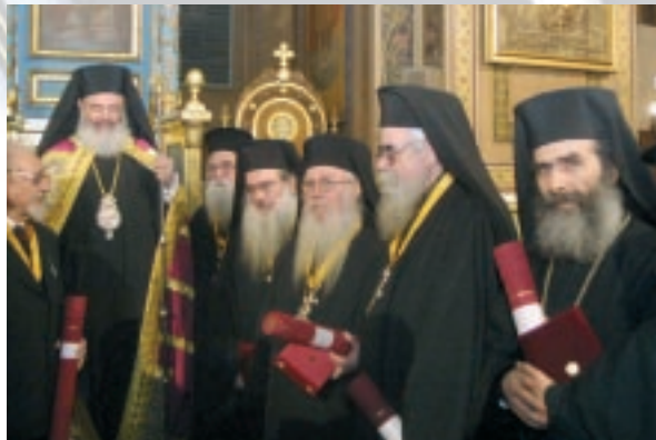
Κατὰ τὸν Ἑσπερινὸ τοῦ Ἁγίου Φωτίου (5/2/2004) ὁ Μακαριώτατος ἀπένειμε τιμητικὲς διακρίσεις σὲ κληρικοὺς καὶ λαϊκοὺς πὺν ἐτιμῆθησαν ἀπὸ τὴν Ἱερά Σύνοδο.