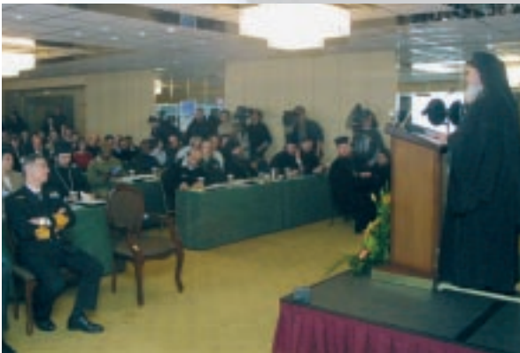
Ὁ Μακαριώτατος Ἀρχιεπίσκοπος Ἀθηνῶν καὶ πάσης Ἑλλάδος κ. Χριστόδουλος ὁμιλεῖ στὸ Διεθνὲς Συνέδριο Στρατιωτικῶν Ἱερέων (Φεβρ. 2004).