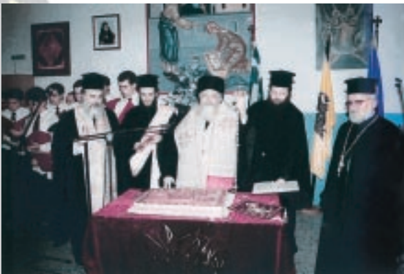
Ἀπὸ τὴν ἑορταστικὴ ἐκδήλωση τῆς Ἱερᾶς Μητροπόλεως Ἀττικῆς γιὰ τὶς πολύτεκνες οἰκογένειες (Φεβρ. 2004).