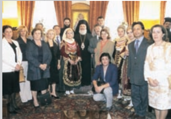
Έπίσκεψη ομάδος άνδρων και γυναικων έκ Σαλαμίνος στόν Μακ. Άρχιεπίσκοπον (21.10.03).