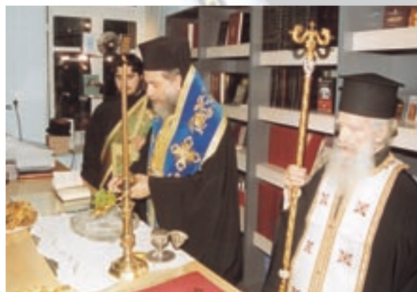
Έγκαίνια του έκκλησιαστικοϋ Βιβλιοπωλείου τής Ί.Μ. Σύρου στήν Έρμούπολη (Έρμούπολη, 1.12.03).