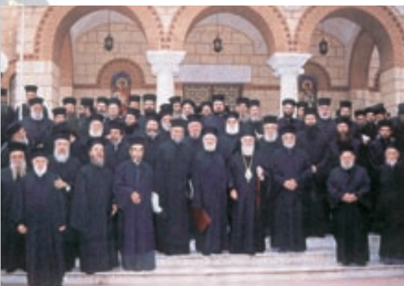
Ό Σεβασμιώτατος Μητροπολίτης Άττικής κ. Παντελεήμων έν μέσω των ιερέων τής Ί. Μητροπόλεως μετά τό πέρας τής Ίερατικής Συνάξεως.