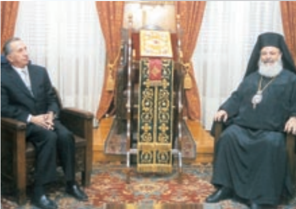
Άπο τήν έπίσκεψη στήν Ί. Άρχ. Άθηνών τοϋ Προέδρου τής Κυπριακής Δημοκρατίας κ. Τάσσου Παπαδοπούλου (27.11.2003).