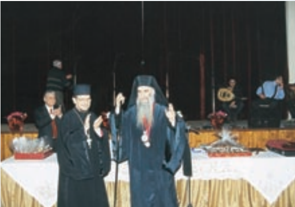
Στιγμιότυπα άπο τήν έκδήλωση τής Ένωσης Σμυρναίων Νικαίας πρὸς τιμήν τοϋ Σεβ. Μητροπολίτου κ. Άλεξίου (14 Ίαν. 2004).