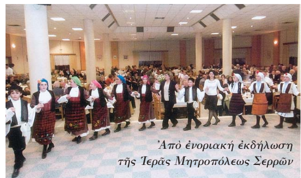
Από ένοριακή εκδήλωση της Ίερας Μητροπόλεως Σερρών

α) για τακτικά μηνιαία βοηθήματα 73.406 €. β) για έκτακτα μηνιαία βοηθήματα 44.018 €. γ) για αγορά φαρμάκων ασθενών 39.023 €. δ) για βοηθήματα του Πάσχα 2003 19.370 €. ε) για έτοιμασία καθημερινού συσσιτίου 300 μερίδων ζεστού φαγητού 38.601 €. στ) για έξοφληση λογαριασμών της Δ.Ε.Η. και του Ο.Τ.Ε. 18.423 €. ζ) για θέρμανση και ένδυση 2.749 €.