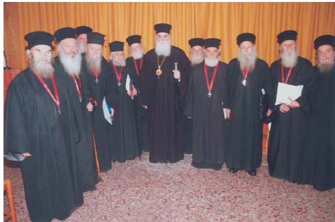
Ὁ Σεβ. κ. Σεραφεῖμ μὲ τοὺς τιμηθέντες

Παρουσία όλων των Κληρικῶν τῆς Ἱ. Μ. Σταγῶν καὶ Μετεώρων κατὰ τὴν μηνιαία Ἱερατικὴ Σύναξη τιμήθηκαν 14 συνταξιούχοι ἱερεῖς τῆς Μητροπόλεως, πού ὑπῆρτησαν πάνω ἀπὸ 40 χρόνια τὸ Ἱ. Θυσιαστήριο καὶ μερικοὶ ἀπὸ τοὺς ὁποῖους συνεχίζουν ἀκόμη νὰ τὸ ὑπηρετοῦν. Ἐργάστηκαν, καθένας μὲ τὸν τρόπο του, ὡς καλοὶ πνευματικοὶ ποιμένες γιὰ τὴν ψυχικὴ καλλιέργεια καὶ τροφοδοσία τοῦ ποιμνίου τους, στάθηκαν ἄγρυπνοι φρουροὶ τῶν χριστιανῶν τους καὶ ἔγιναν ἐμπνευστὲς καὶ ὑποκινητὲς τους γιὰ τὴν κοινωνία τους μὲ τὸ Θεὸ καὶ γιὰ τὴ βίωση τῆς πίστεως. Ἡ πρωτοβουλία τοῦ Σεβ. Μητροπολίτου νὰ πραγματοποιηθεῖ ἡ ἐκδήλωση αὐτὴ ἐνώπιον ὅλων τῶν Ἱερέων ἀπέβλεπε στὸ νὰ ἐξαρθεῖ ἡ προσφορά τῶν συνταξιούχων Ἱερέων ἀλλὰ καὶ νὰ βοηθήσει τοὺς ἐν ἐνεργείᾳ καὶ μάλιστα τοὺς νεωτέρους κληρικοὺς νὰ μιμηθοῦν τὸ παράδειγμα τῶν παλαιότερων, οἱ ὁποῖοι ὑπῆρτησαν τὴν Ἐκκλησία μὲ πολλὲς δυσκολίες γιὰ τὴν ἐποχὴ τους.