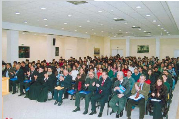
Στιγμιότυπο ἀπὸ τὸ Συνέδριο Νεολαίας τῆς Ι. Μ. Φθιώτιδος με θέμα «Ἐκκλησία καὶ Παραθρησκείες» (17. 12. 05).