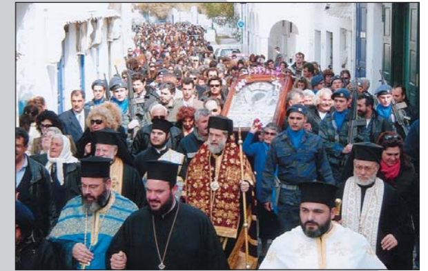
Στιγμιότυπο ἀπὸ τὴν Λιτανεία τῆς Εἰκόνας τῆς Παναγίας Τουρλιανῆς τὸ Σάββατο τῶν Ἁγίων Θεοδώρων ἀπὸ τὴν Ἱ. Μονὴ Ἄνω Μερᾶς στὴ Χώρα Μυκόνου (24.02.07).