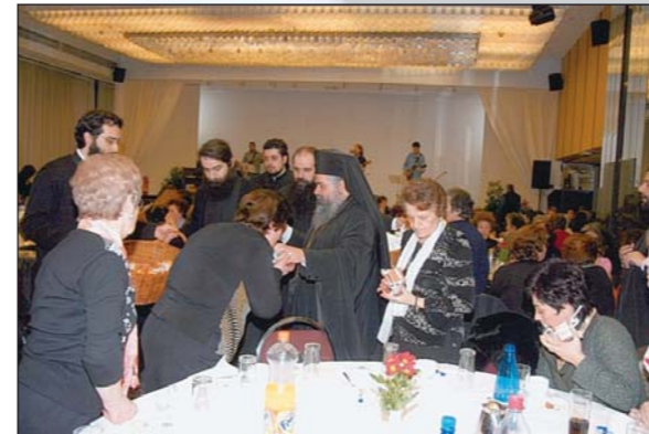
Ἐκδήλωση γιὰ τοὺς συνεργάτες τῶν Ε.Φ.Τ. τῆς ἐπαρχίας τῆς διοργάνωσε ἡ Ἱ. Μ. Νεαπόλεως καὶ Σταυρουπόλεως (12.02.07).

Σὲ μᾶς ἀπομένει νὰ πορευόμαστε διὰ τῶν ἐντολῶν πρὸς τὸν Χριστὸ μὲ τὴν θερμὴ ἰκεσία «Κύριε, ἐλέησον». Αὐτὸς θὰ μᾶς προσφέρει καὶ τὸ ὔδωρ τὸ ζῶν καὶ θὰ γίνεται γιὰ μᾶς ἡ ὁδὸς γιὰ νὰ Τὸν φθάσουμε καὶ νὰ ξεδιψάσουμε.