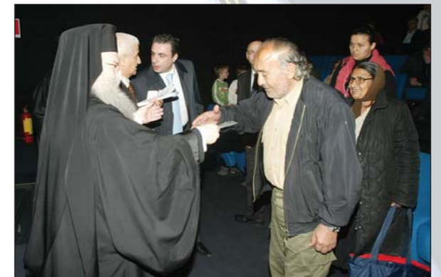
Ὁ Σεβ. Θεσσαλονίκης προσφέρει δωροεπιταγὲς σὲ πολυτέκνους (03.04.07).