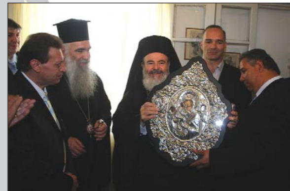
Ἐπίσκεψη τοῦ Μακαριωτάτου στὸν Πανελλήνιο Μορφωτικὸ Σύλλογο Ἑλλήνων Ἀθιγγάνων (13.03.07).