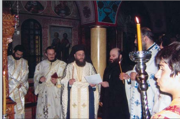
Άγρυπνία κατά την ώρα της Λιτής μπροστά στο προσκυνητάρι των Άθηναίων Άγίων στον Ί. Ναό Άγίας Φιλοθέης (12.10.07).