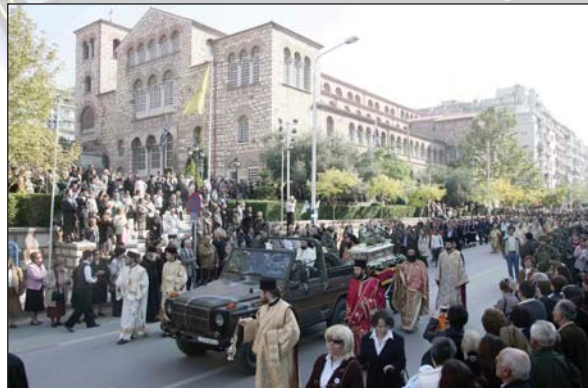
Ήλιτανεία του Σκηνώματος του Άγιου Δημητρίου στη Θεσσαλονίκη (26.10.07).