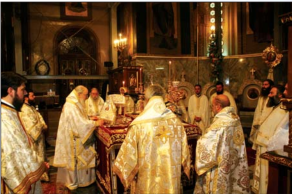
Στιγμιότυπο από το Πολυαρχιερατικό Συλλείτουργο στον Ί. Καθεδρικό Ναό Άθηνών για την άποκατάσταση της υγείας του Μακαριωτάτου (21. 10. 07)