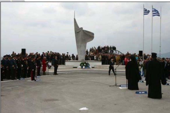
Άπό τις έορταστικές έκδηλώσεις για την 28η Ώκτωβρίου στο Βόλο (28.10.07).