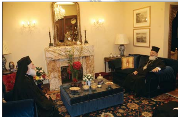
Τόν Μακαριώτατο έπισκέφθηκε στην κατοικία του ή Α. Θ. Μ. ό Πατριάρχης Άλεξανδρείας κ. Θεόδωρος (30.10.07).