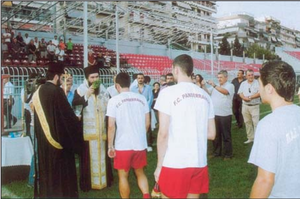
Ό Σεβ. Σερρών κ. Θεολόγος κατά τον άγιασμό στην ποδοσφαιρική ομάδα του Πανσερραϊκού (3.9.07).