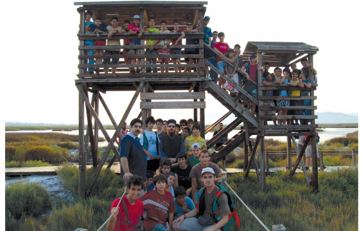
Ἀπὸ τὴν περιήγηση τῶν κατασκευωτῶν τῆς Ἰ.Μ. Ἄρτης στὸν Ὑγρότοπο τῆς Ροδιᾶς.

Ἡ ἀλήθεια, κατὰ τὴν διδασκαλία τῆς Ἐκκλησίας, δὲν ἀρκεῖ νὰ κατανοηθεῖ γιὰ νὰ σώσει, ἀλλὰ πρέπει ὅπωςδῆποτε νὰ βιωθεῖ γιὰ νὰ σώσει, τονίζει ὁ π. Ἀγαθάγγελος. Ἡ ἀδελφότητα τῆς Ἰ. Μονῆς Προφ. Ἡλία ἔχει ἀρχίσει