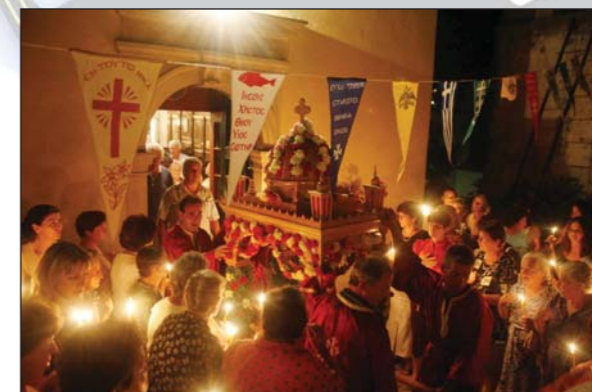
Ἀπὸ τὴν περιφορὰ τοῦ Ἐπιταφίου τῆς Παναγίας στήν Κέρκυρα (15.08.07).