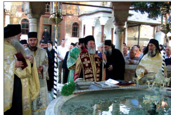
Ὁ Σεβ. Χαλκίδος τελεῖ Ἄγασμό στὴ φιάλη τῆς Ἱ.Μ. Μεγίστης Λαύρας κατὰ τὴν πανήγυρι τῆς Μονῆς (18.07.07).