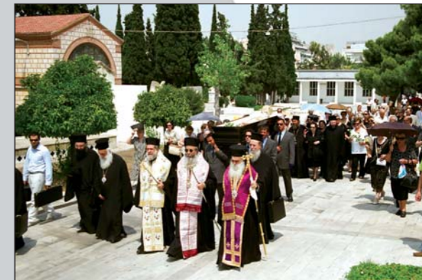
Στιγμιότυπο ἀπὸ τὴν κηδεῖα τοῦ μακαριστοῦ Μητροπολίτου πρ. Θήρας κυροῦ Παντελεήμονος (25.07.07)