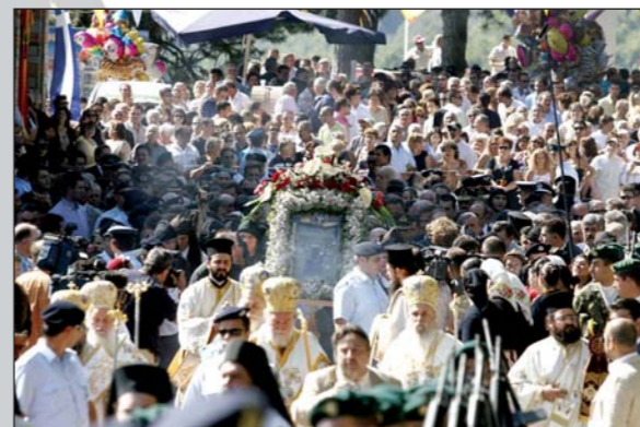
Ἀπὸ τὴν περιφορὰ τῆς θαυματουργῆς εἰκόνας τῆς Παναγίας Συμελαῖ στὸ Προσκύνημα τοῦ Βερμίου (15.08.07).