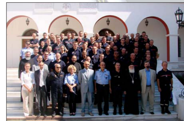
Ἡ Μ.Κ.Ο. «Ἀλληλεγγύη» τίμησε στὴ Ἱ.Μ. Πεντέλης πυροσβέστες καὶ ἐθελοντές πού ἀγωνίστηκαν γιὰ τὴν κατάσβεση τῶν πυρκαϊῶν (5.09.07).