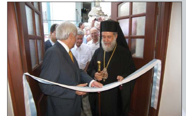
Ἀπὸ τὰ ἐγκαίνια τοῦ Πνευματικοῦ Κέντρου Ἱ. Μ. Ναοῦ Μεταμορφώσεως Ἐρμουπόλεως, ἀπὸ τὸν Ὑπ. Ἐσωτερικῶν κ. Πρ. Παυλόπουλο (16.08.08).