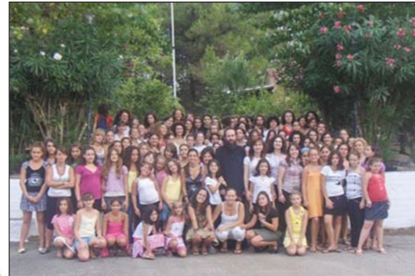
Ἀπὸ τὴν τελετὴ λήξεως κατασκηνωτικῆς περιόδου κοριτσιῶν στὴν Ἱ. Μ. Κερκύρας (01.08.08).