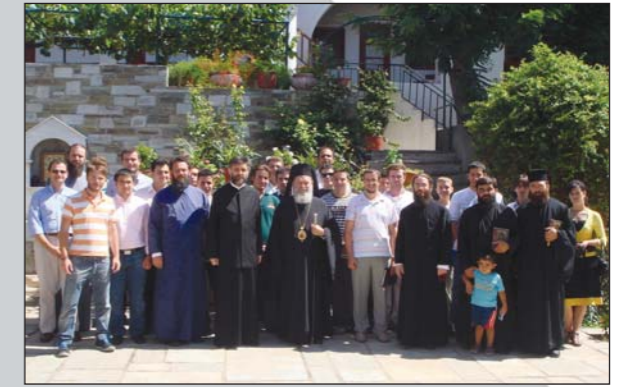
Οἱ Ἀναγνώστες καὶ οἱ Ὑποψήφιοι Κληρικοὶ τῆς Ἱ. Μ. Χαλκίδος μετὰ τὸν Σεβ. κ. Χρυσόστομο στὴν Ἱ. Μ. Γαλατᾶκη μετὰ ἀφορμὴ τὴν ἐορτὴ τῶν 630 Θεοφόρων Πατέρων τῆς Δ' Οἰκ. Συνόδου (12-13 Ἰουλίου 2008).