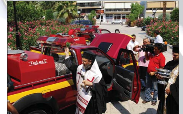
Τρία πυροσβεστικὰ αὐτοκίνητα δώρισε σὲ ἰσάριθμους πυρόπληκτους δήμους ἡ Ἱ. Μ. Κορίνθου (20.0.08).