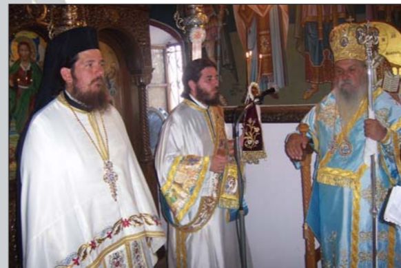
Ὁ Σεβ. Λαρίσης κ. Ἰγνάτιος πρόεστη τῶν πανηγυρικῶν λατρευτικῶν ἐκδηλώσεων γιὰ τὴν ἐορτὴ τῆς Ἁγίας Μαρίας στὴν φερώνυμη Ἱ. Μονὴ στὸ Ἄργος (17.08.08).