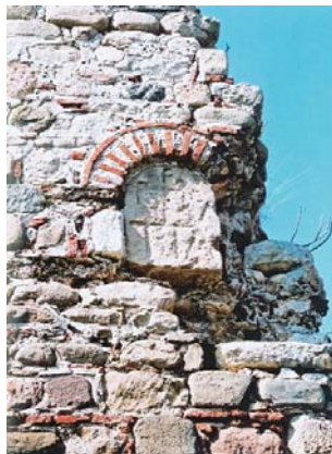
Η έπιγραφή στήν άνατολική πόλη της Άναστασιουπόλεως (Περιθεωρίου)