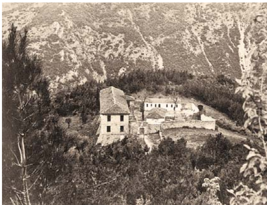
Ἡ Ἱερά Μονή τῆς Παναγίας Καλαμοῦς (Φωτ. 1965)