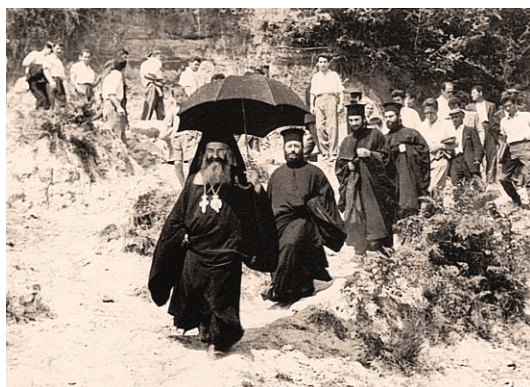
Ὁ Μητροπολίτης Ἀντώνιος μέ καθηγητές καί μαθητές τῆς Ἐκκλησιαστικῆς Σχολῆς στό δρόμο ἀπό τή Μονή πρὸς τήν Ξάνθη

Μιλᾶμε λοιπόν γιά μιᾶ ἀγιότητα πού μᾶς ἔχει σφραγίσει ὅταν βαφτιστήκαμε, ὅταν δηλαδή προσχωρήσαμε στήν κοινότητα πού ἐγκαθιδρύθηκε τήν ἡμέρα τῆς Πεντηκοστῆς διά τήν παρουσίας τοῦ Πνεύματος, ἀλλά ἐπίσης μιλᾶμε γιά μιᾶ ἀγιότητα ἀπό τήν ὁποία συνεχῶς ἀπομακρυνόμαστε λόγω τῆς ἁμαρτωλότητάς μας. Γι' αὐτό ἀντιλαμβανόμεστε τή ζωή μας ὡς ἕναν διαρκῆ ἀγῶνα, ἤ, γιά νά χρησιμοποιήσω τήν καταστατική τοῦ ἐκκλησιαστικοῦ μας βίου λέξη, ὡς διαρκῆ μετάνοια. Ἡ μετάνοια, πού τόσο χαρακτηριστικά περιγράφεται στήν παραβολή τοῦ Ἀσώτου, ἤ στήν περίπτωση τοῦ Πέτρου (πού μετά τήν τριπλῆ ἄρνηση «ἐξελθὼν ἔξω ἔκλαυσεν πικρῶς»), εἶναι ἡ πιό «τρυφερή», ἡ πιό φιλόνηρη συνθήκη πού ὡς δωρεά τοῦ Θεοῦ χαρακτηρίζει τόν βίο μας. Μέσω αὐτῆς ἡ ἀγιότητα εἶναι διαρκῶς παροῦσα, ἀκόμη κι ὅταν τραγικά βιώνουμε τήν ἀπουσία της.