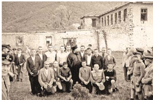
Ἐκδρομή τῶν μαθητῶν τῆς Ἐκκλησιαστικῆς Σχολῆς στή Μονή τῆ δεκαετία τοῦ '50

Σ' ἕνα κατηχούμενο, ὅπως καί σ' ἕνα χριστιανό θά χρειαζόταν νά τοῦ δώσουμε νά κατανοήσει ὅτι ὄντας μέσα στήν Ἐκκλησία βρίσκεται μέσα στό μυστήριο τῆς «εὐσέβειας» καί ὄχι τῆς θρησκείας, ὅπως τό περιγράφει ὁ ἀπ. Παῦλος στόν Τιμόθεο: «..σοῦ γράφω γιά νά μάθεις πῶς πρέπει νά συμπεριφέρεται κανεῖς στόν οἶκο τοῦ Θεοῦ, πού εἶναι ἡ ἐκκλησία τοῦ ἀληθινοῦ Θεοῦ, ὁ στῦλος καί τό θεμέλιο τῆς ἀλήθειας. Ὅπως ὀμολογοῦμε, εἶναι μεγάλο τό μυστήριο τῆς πίστεως πού μᾶς ἀποκαλύφθηκε: Ὁ Θεός φανερώθηκε ὡς ἄνθρωπος, τό Πνεῦμα ἀπέδειξε ποιός ἦταν φανερώθηκε στους ἀγγέλους, κηρύχθηκε στά ἔθνη, τόν πίστεψε ὁ κόσμος, ἀναλήφθηκε μέ δόξα» 3 . Τό μυστήριο τῆς «εὐσέβειας», δηλ. τῆς πίστεως εἶναι διαφορετικό ἀπό τήν θρησκεία, γιά τήν ὅποια ὁ ἅγ. Γρηγόριος ὁ Θεολόγος ἀναφέρει: «Θρησκείαν οἶδα καί τῶν δαιμόνων σέβας. Ἡ δ' εὐσέβεια, προσκύνησις Τριάδος» 4 , δηλαδή τή θρησκεία τή σέβονται καί οἱ δαίμονες, ἐνῶ ἡ εὐσέβεια εἶναι ἡ προσκύνηση τῆς ἁγ. Τριάδος.