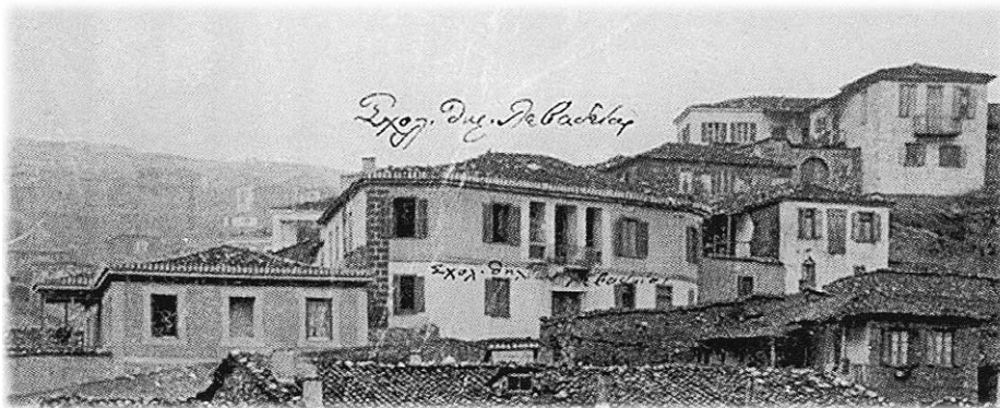
«Τό ἐν Λεβαδεῖα πλήρες (ἐξατάξιον) Δημοτικόν Σχολεῖον τῶν Θηλεῶν»