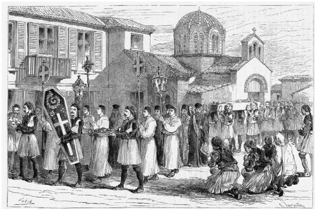
Πομπή κηδεῖας ἔξω ἀπὸ τὸν Μητροπολιτικὸ Ναὸ τῆς Παναγίας Ἐλεούσας (Henri Bell, Tour du Monde)