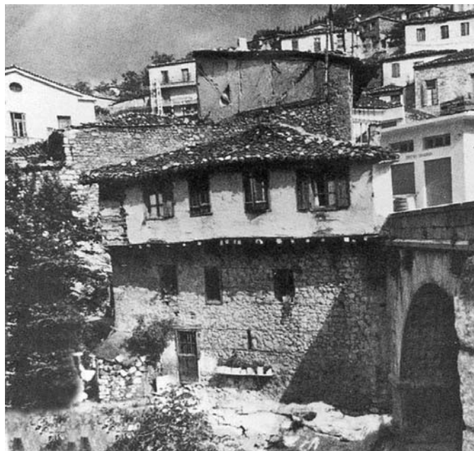
Παραδοσιακό κτίσμα στίς ὄχθες τῆς Ἐρκόνας (10ετία '50)

σύγχρονους θεολόγους, οἱ ὅποιοι ἔχουν στὴ διάθεσή τους ἕναν πολὺ μεγαλύτερο ἀριθμὸ ἀπόψεων γιὰ τὴν προέλευση τοῦ σύμπαντος. Ὁ θεολόγος σήμερα καλεῖται νὰ ἀξιοποιήσῃ τὴν κληρονομιά τῶν ἱερῶν συγγραφέων τῆς Π. Διαθήκης καὶ νὰ ἐπιχειρήσῃ ἕναν νέο θεολογικὸ λόγο, μὲ βάση τὰ καινούργια δεδομένα, πάνω στό πανάρχαιο, ἀλλὰ πάντοτε ἐπίκαιρο, θέμα τῆς δημιουργίας.