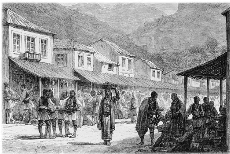
Πηγαίνοντας πρὸς τήν Κρούα (Henri Bell, Tour du Monde )

ΣΗΜΕΙΩΣΕΙΣ: 1. Βλ. ἐκτενῶς, Al. Fürst - Th. Fuhrer - F. Siegert - P. Walter, Der apokryphe Briefwechsel zwischen Seneca und Paulus , ( Scripta Antiquitatis Posterioris ad Ethicam Religionemque pertinentia 11 ), ἔκδ. Mohr Siebeck, Tubingen 2006. 2. Βλ. Tacitus, Annals , Books XV/44 (Loeb Classical Library), London 1999 9 , σ. 282. H. Fuchs, Tacitus über die Christen , στό Vigiliae Christianae 4(1950), 65-93. 3. Βλ. Gaius Suetonius Tranquillus, De vita Caesarum, Neron , 38 (Εἰσαγωγή -Μετάφραση: Περικλῆς Ροδάκης), ἔκδ. Παρασκήνιο, Ἀθήνα 1993, σ.70.