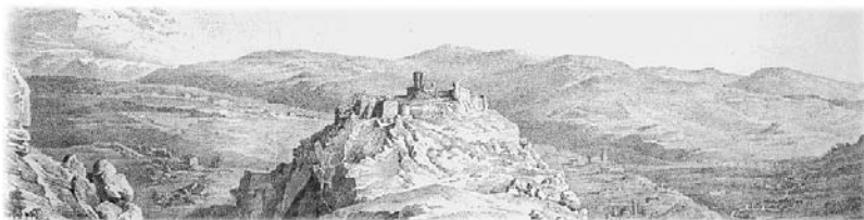
Ἐκείνη τῆς ἀποφύ τῶν Κάστρου ἀπό τή Γαρδαβίτσα