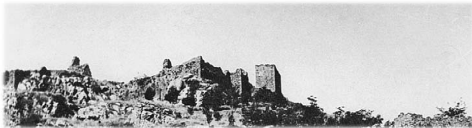
Ἐποψη τοῦ Κάστρου δίπλα ἀπό τίς πηγές