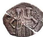
Ὁ β' αὐτοκράτωρ Νικαίας Ἰωάννης Βατάτζης (1222-1254) μαζί μέ τόν Δεσπότη τῆς Ἡπείρου Μιχαήλ Β'