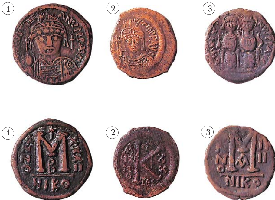
1. Χάλκινο είκοσανόμιο του Ίουστινιανού. 2. Χάλκινο τεσσαρακοντανόμιο του Ίουστινιανού. 3. Χάλκινο τεσσαρακοντανόμιο του Ίουστίνου Β' (565-578)

ΕΝΔΕΙΚΤΙΚΗ ΒΙΒΛΙΟΓΡΑΦΙΑ: Davison R., «The “Dosografa” Church in the Treaty of Küçük Kaynarca», Bulletin of the School of Oriental and African Studies, University of London , Vol. 42, No. 1. (1979), pp. 46-52. Stavrianos L. St., The Balkans since 1453 , Νέα Υόρκη 1958. Stoianovich Tr., «Ό κατακτητής όρθόδοξος Βαλκάνιος έμπορος», στό Σπ. Άσδραχάς (έπιμ.), Η οικονομική δομή τών βαλκανικών χωρών στά χρόνια τής όθωμανικής κυριαρχίας ιέ-ιθ' αί. , Μέλισσα, Άθήνα 1979, σ. 287-345. Άγγελομάτη-Τσουγκαράκη Έλ., 1821. Η γέννηση ενός Έθνους-Κράτους , τόμ. Α', Η Προεπαναστατική Έλλάδα , Σκάι, Άθήνα 2010. Βερέμης Θ., Κολιόπουλος Γ., 1821. Η γέννηση ενός Έθνους-Κράτους , τόμ. Β', Η συγκρότηση έξουσίας στήν έπαναστατημένη Έλλάδα , Σκάι, Άθήνα 2010. Διαμαντούρος Ν., Οί άπαρχές τής συγκρότησης σύγχρονου κράτους στήν Έλλάδα (1821-1827) , Μ.Ι.Ε.Τ., Άθήνα 2002. Κρεμμυδάς Β., Εισαγωγή στήν ιστορία τής νεοελληνικής κοινωνίας (1700-1821) , Έξάντας, Άθήνα 1988. Μακρής Ε. Β., «Ό οικονομικός ένεργός πληθυσμός τής Έλλάδος καί ή άπασχόλησις αύτου (1821-1971)», Έθνικό Κέντρο Κοινωνικών Έρευνών, Στατιστικά Μελέται (1821-1971) , Άθήνα 1972, σ. 126-135. Παπαρηγόπουλος Κ., Ιστορία του Έλληνικού Έθνους , τόμ. Ε', Έλευθερουδάκης, Άθήνα 1925. Τσοποτός Δ., Γη καί γεωργοί τής Θεσσαλίας κατά τήν Τουρκοκρατίαν , Άθήνα 1983.