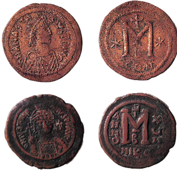
Ἐπάνω: Χάλκινο νόμισμα (τεσσαρακοντανόμιο τοῦ 498-518) μέ τήν προτομή τοῦ αὐτοκράτορα Ἀναστασίου (491-518). Κάτω: Χάλκινο νόμισμα (τεσσαρακοντανόμιο τοῦ 539-540) μέ τήν προτομή του αὐτοκράτορα Ἰουστινιανοῦ (527-565)

ΣΗΜΕΙΩΣΗ: Γιά τή σύνταξη τοῦ παρόντος βασιστήκαμε στά κάτωθι: α) G. Schmid - G.O. Schmid (Hrsg), Kirchen- Sekten- Religionen , 7η ἔκδ., 2003. β) R. Hempelmann u.a, Quellentexte zur neuen Religiosität , EZW-TEXTE 215/ 2011.