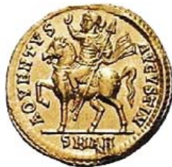
Χρυσός σόλιδος τοῦ Μ. Κωνσταντίνου, ὁ ὁποῖος στήν ἄλλη ὄψη παριστάνεται ἔφιππος νά χαιρετᾷ τελετουργικά