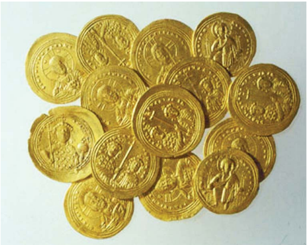
Βυζαντινά χρυσᾶ νομίσματα τοῦ τύπου σόλιδος, τὰ ὁποῖα ἤσαν σὲ χρῆσιν ἀπὸ τὴν ἐποχὴ τοῦ Μ. Κωνσταντίνου ὡς τὸν 11ο-12 αἰ.

τὸν θάνατο τῶν πρώτων, ἀφ' ἑτέρου δὲ εἶχαν ἐπωμισθῇ τὴν ἴδια μὲ τὸν Τιμόθεο ἢ τὸν Τίτο εὐθύνη γιὰ τὴ συνέχιση τῆς ἀποστολικῆς λειτουργίας τῆς ἐπισκοπῆς. Αὐτοί, ἀφοῦ δὲν ἀνῆκαν ὡσδὴποτε στὴν τάξιν τῶν ἐπισκόπων ἢ τῶν διακόνων τοῦ τοπικοῦ ἱερατείου, σὲ ποιά τάξιν ἀνῆκαν καὶ μὲ ποιὸν τίτλο ἀποδιδόταν ἢ ἐξέχουσα θέση τοὺς στὴν Ἐκκλησία;