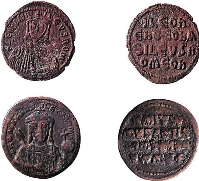
Ἐπάνω: Χάλκινος φύλλισ τοῦ αὐτοκράτορα Λέοντα Στ' (886-912) Κάτω: Χάλκινος φύλλισ τοῦ αὐτοκράτορα Ρωμανοῦ Α' (913-950)

γραφική καί ἐκκλησιαστική γλῶσσα τόν ὀνομάζει «κένωση», μιᾶ κένωση πού ὀδηγεῖ στήν πλήρωση τοῦ ἀνθρώπου ἀπό τό κατεξοχήν αγαθό, δηλαδή ἀπό τόν Θεό. Ὁ πλουτισμός γιά τόν ὀποῖο πλάσθηκε ὁ ᄅνθρωπος δέν εἶναι ἕνα κλείσιμο, ᄅλλά ἕνα ᄅνοιγμα. Εἶναι ἡ ὀμοίωση μέ τόν τριαδικό Θεό, κάθε πρό- σωπο τοῦ ὀποῖου δέν ζεῖ γιά τόν ἑαυτό του, ᄅλλά γιά τά ᄅλλα. Ὁ πραγματικά πλούσιος ᄅνθρωπος δέν εἶναι αὐτός πού κατακρατεῖ καί κατέχει, ᄅλλά ἐκεῖνος πού κατ' εἰκόνα τοῦ ζῶντος Θεοῦ δίνει, ἡ, ἀκριβέστερα, δίνεται. Αὐτός λοιπόν πού ἐκουσίως διακατέχεται ἀπό τό πνεῦμα τῆς πτωχείας, αὐτός δικαιῶται νά λογαριάζεται πολίτης τῆς Βασιλείας τῶν οὐρανῶν.