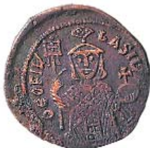
Φόλλισ τοῦ αὐτοκράτορος Θεοφίλου πού κυκλοφορήθηκε ἐπί εἰκονομαχίας

«Οὐκ ἐν τῷ πολλῷ τῷ εὖ», ἔλεγαν οἱ ἀρχαῖοι καί ὁ συγγραφεύς τό ἐφαρμόζει στό σαραντασέλιδο πόνημά του, γράφοντας μέ ἀφτιασίδωτο λόγο καί καθαρή σκέψη γιά θέματα πολυσυζημένα καί ἰδιαίτερος σοβαρά καί διατυπώνοντας τή θέση του στηριζόμενος στήν Κ. Διαθήκη καί σέ ἔργα παλαιότερων καί νεωτέρων πατέρων τῆς Ἐκκλησίας. Στό α' μέρος τοῦ βιβλίου ἀσχολεῖται μέ τό Ἐνταλτήριο Γράμμα πρὸς τόν πνευματικό, τοῦ Ἁγίου Νικοδήμου τοῦ Ἀγιορείτου, θίγοντας καιρία σημεία τῆς εὐθύνης τῆς ἀνάληψης καί τῆς ἀσκήσης τῆς Πνευματικῆς Πατρότητος. Στό β' παρουσιάζει τή μορφή καί τό ἔργο τοῦ πνευματικοῦ του πατέρα, πρωτ. Εὐστρατίου Φελέκη, δημοσιεύοντας τόν λόγο του στήν ἑορταστική ἐκδήλωση πού πραγματοποιήθηκε τό 2012 γιά τό ἱωβηλαῖο τοῦ Γέροντά του. Στό γ' προσπαθεῖ νά περιγράψει, ὅσο πιό παραστατικά μπορεῖ, καί νά μεταδώσει, ὅσο εἶναι δυνατόν, ὑπερφυές γεγονός, ἓνα θαῦμα πού βίωσε κατά τή διάρκεια θ. Λειτουργίας. Μέ τό πόνημά του παρουσιάζει σοβαρό τρόπο σκέψεως καί γραφῆς νέου κληρικοῦ, ὁ ὁποῖος διαπνέεται ἀπό τήν εὐθύνη ἀλλά καί τό δῶρημα τῆς ιδιότητάς του.