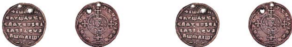
Μιλιαρέσιον τοῦ αὐτοκράτορα Ἰωάννη Α' (969-976)

Μέ τόν τρόπο αὐτό ἔδωσαν διαχρονικό παράδειγμα διαχειρίσεως τῶν κοινωνικῶν προβλημάτων πού δέν εἶναι ἄλλος ἀπό τὴν ἔμπρακτη φιλαδελφία. Τό ὅποιο κοινωνικό πρόβλημα δέν λύνεται παρά μέ πνευματικά μέσα· πρῶτα οἱ ἄνθρωποι μοιράζονται τὴν ἴδια Πίστη, Ἐλπίδα, προοπτικὴ καὶ μέλλον, κι ὕστερα τά προβλήματα καὶ τίς λύσεις. Ἡ κοινοκτημοσύνη τῶν ἀγαθῶν προϋποθέτει κοινότητα ψυχῶν, τό ὁποῖο εἶναι χάρισμα καὶ καρπός τοῦ Ἁγίου Πνεύματος. Ἡ συνέπεια τοῦ βίου τῶν Χριστιανῶν ἦταν καὶ εἶναι ἡ βασικὴ αἰτία τῆς διαδόσεως καὶ τῆς ἀντοχῆς τοῦ Χριστιανισμοῦ.