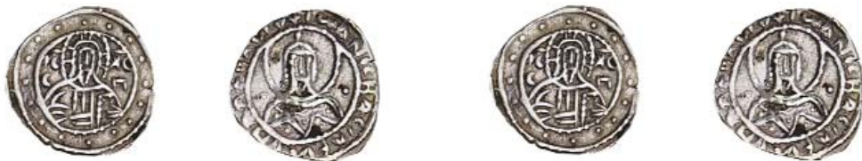
Μισό σταυραῖο πού κυκλοφόρησε ἐπί Ἰωάννη Ζ' Παλαιολόγου

4. Ὁ ἴδιος ὁ Κύριος βέβαια ἔχει ἀποκαλύψει τί γίνεται σ' αὐτές τίς περιπτώσεις τῆς τυπικῆς θρησκευτικῆς πίστεως καί ἡ ἀποκάλυψή Του αὐτή ἤχει πολύ φοβερά καί ζοφερά: πρόκειται γιά τούς «πιστούς» πού γίνονται μέν κλαδιά στό δένδρο Ἐκείνου, κλήματα στό ἀμπέλι Του, ἀλλά μή παραμένοντας ἐνωμένοι μαζί Του διά τῶν ἁγίων Του ἐντολῶν καί τῆς συμμετοχῆς τους συνεπῶς στήν ἐν μετανοίᾳ Θεῖα Εὐχαριστία, ξηραίνονται καί ἀποκόπτονται καί εἰς πῦρ βάλλονται (πρβλ. Ιωάν. 15, 1ἔξ.). Ἀντιθέτως στήν περίπτωση πού ἕνας πιστός ἀποκτήσει προσωπική σχέση μέ τόν Χριστό, ζώντας ὡς μέλος τοῦ σώματος τοῦ Χριστοῦ, τήν ἀγία Του Ἐκκλησία, τότε θά διαπιστώνει διαρκῶς ὅτι ἡ ἐκπληξη ἀπό τήν ἀδιάκοπα παρεχόμενη χάρη τοῦ Θεοῦ σ' αὐτόν θά εἶναι μιά μόνιμη κατάσταση. Θά ὀδεύει πάντοτε «ἐκ πίστεως