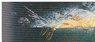
Κάστρο II νυχτερινό (λεπτομέρεια)

Μέ τά αἰσθήματα αὐτά, τῆς χαρμολύπης καί τοῦ χαροποιοῦ πένθους, ἄς προσεγγίσουμε τά γεγονότα τῶν ἡμερῶν αὐτῶν. Μέ σιωπή καί κατάνυξη ἄς βιώσουμε τό ἄφατο μυστήριο τοῦ Θεοῦ Πάθους· νά ἀποθέσουμε στά πόδια τοῦ Ἐσταυρωμένου τίς ὅποιες φοβίες καί φόβους πού μᾶς κατακλύζουν κατά τή δύσκολη ἐποχή μας· νά Τόν ἀτενίσουμε μέ ἐμπιστοσύνη καί νά Τόν ἱκετεύσουμε μέ ὅλη τήν θέρμη τῆς καρδιάς μας· Κύριε, Σῶσε μας, ὅπως γνωρίζεις, καί δεῖξε μας τόν τρόπο νά τό κατανοήσουμε. Συγχώρεσέ μας πού ξεχνοῦμε ὅτι ἡ κάθε μέρα εἶναι δική σου μέρα καί πνιγόμαστε στίς ἔγνοιες καί τίς ἀμφιβολίες!