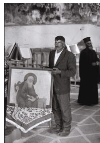
Εϋλογώντας τίς εικόνες, Κάρπαθος, Όλυμπος, 1964