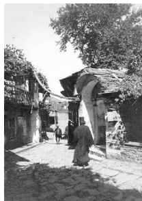
Στὸ Ἅγιον Ὅρος, 1928-1930