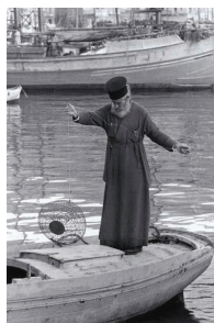
Κάλυμνος, 1964