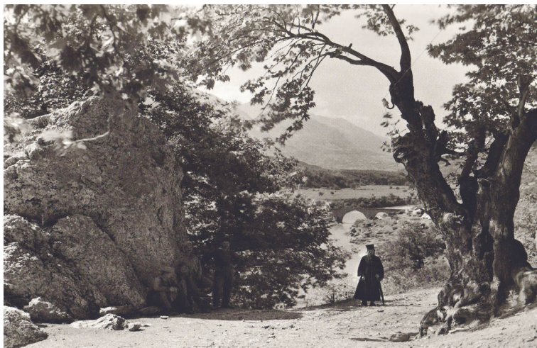
Κόνιτσα, Μεσογέφυρο, 1913

Θεοῦ πρὸς τοὺς δικαίους. Ἀπό τήν ἀποψη αὐτήν, ἂν καί πρόκειται γιά μία κατά κάποιον τρόπο καινοφανῆ διδασκαλία, οἱ ἰδέες τοῦ συγγραφέα ἐξακολουθοῦν νά ἐδράζονται σταθερά στό ἔδαφος τῆς βιβλικῆς σκέψης, ἡ ὁποία ἐξελισσεται καί προσαρμόζεται στό ἐλληνιστικό πολιτισμικό περιβάλλον. Μία προσαρμογή πού οἱ Πατέρες τῆς Ἐκκλησίας θά ἀναπτύξουν στοὺς αἰῶνες πού θά ἀκολουθήσουν ἀκόμη περισσότερο, καθιστώντας τή χριστιανική πίστη προσιτή καί ἀνοιχτή σέ ὅλους τοὺς ἀνθρώπους καί παράγοντα πολιτισμοῦ πού θά καταυγάσει τόν κόσμο ὁλόκληρο.