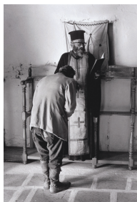
Τήν ώρα τής Έξομολόγησης, Κάρπαθος, Όλυμπος, 1964