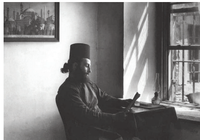
Στό Ἅγιον Ὅρος, 1928-1930

Σχόλιο: Τό Μεγάλο Σάββατο ἀποτελεῖ μία ἐξαίρεση. Ὅλα τά ἄλλα Σάββατα καταλύεται τό λάδι.