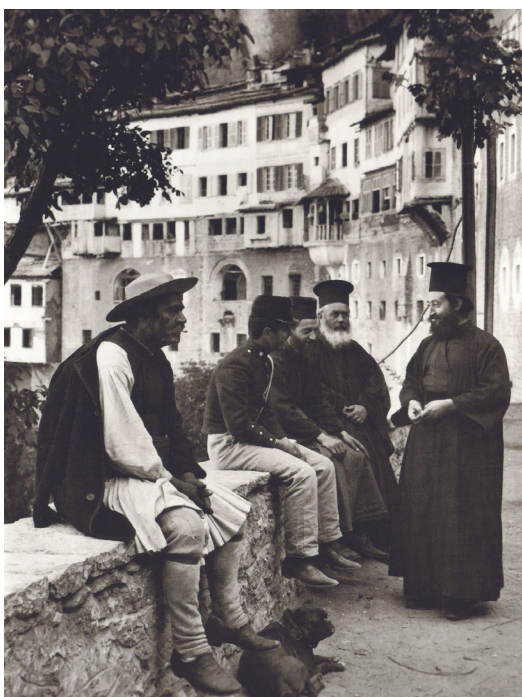
Μέγα Σπήλαιο, 1903

Σ. Δεσπότης, Ὁ κώδικας τῶν Εὐαγγελίων: Εἰσαγωγή στά Συνοπτικά Εὐαγγέλια καί πρακτική μέθοδος ἐρμηνείας τους , Ἀθήνα: Ἄθως 2007. Αἰκ. Τσαλαμπούνη - Χ. Ἀτματζίδης (ἐπιμ. ἑλλ. ἐκδ.), Ἀναζητώντας τό νόημα: Μιά εἰσαγωγή στήν ἐρμηνεία τῆς Καινῆς Διαθήκης , Θεσσαλονίκη: Πουρναράς 2011. D. A. Hagner, The New Testament: A Historical and Theological Introduction , Grand Rapids, MI: Baker Academic 2012.