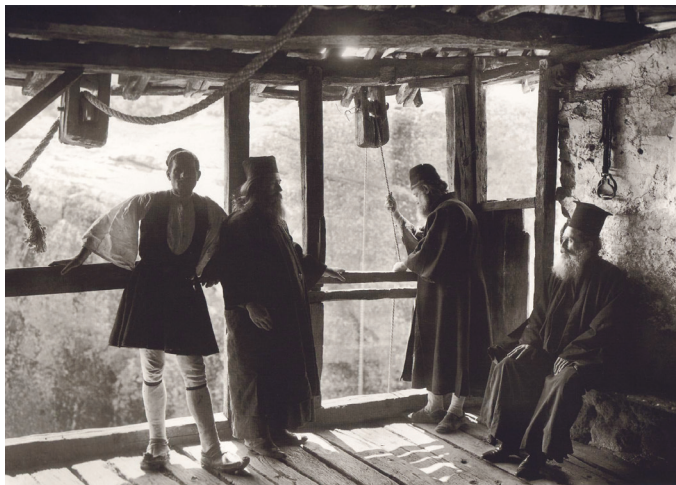
Μετέωρα, τό μαγγάνι, 1908

π. Ἐφραίμ Τριανταφυλλόπουλος, Ὁ θάνατος, χορός καλαματιανός. Νότες χαρμολύπης στόν Νίκο Γ. Πεντζίκη , Ἀθήνα: ἐκδ. Πορφύρα 2019