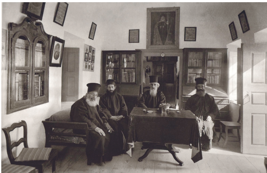
Σαντορίνη, 1911