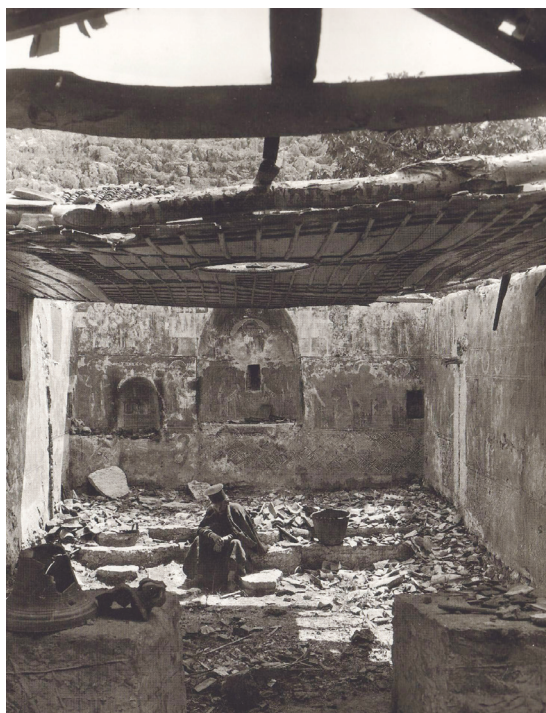
Στὴν κατεστραμμένη ἀπὸ τὸν πόλεμο ἐκκλησιά, Καστρί Πρεβέζης, 1913

ΣΗΜΕΙΩΣΕΙΣ. 1. Π. Μπρατσιώτης, Ἡ Ἀποκάλυψις τοῦ Ἰωάννου , κείμενον-εισαγωγὴ-σχόλια-εἰκόνες, Ἀθήνα 1992, σ. ζ'. 2. Ὁ.π., σ. θ'. 3. Ὁ.π., σ. 9. 4. πρωτ. Ἰω. Σκιαδαρέσης, Ἡ Ἀποκάλυψη τοῦ Ἰωάννη , Ἑρμηνευτικά καὶ Θεολογικά Μελετήματα Α', Θεσσαλονίκη: Πουρναράς 2005, σ. 57-59. 5. Π. Μπρατσιώτης, ὁ.π., σ. 83.