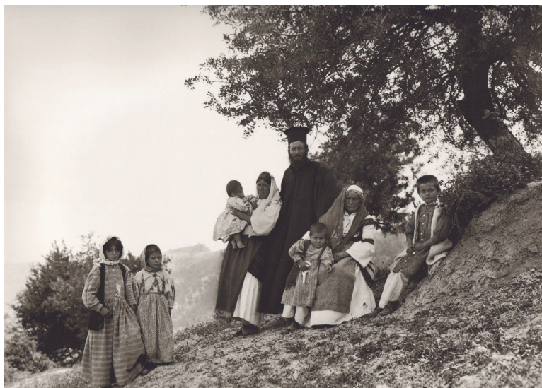
Ἱερέας μέ τήν οἰκογένειά του στό Ζεμενό Κορινθίας, 1903

ὁ ἀπόστολος Πέτρος στή νέα ἐν Χριστῷ πραγματικότητα, ὅπως τῆ διατυπώνει στήν ἐπιστολή του: «Ἵμεῖς δὲ γένος ἐκλεκτόν, βασιλεῖον ἱεράτευμα, ἔθνος ἅγιον, λαὸς εἰς περιποίησιν, ὅπως τὰς ἀρετάς ἐξαγγείλητε τοῦ ἐκ σκοτοῦς ὑμᾶς καλέσαντος εἰς τὸ θαυμαστόν αὐτοῦ φῶς» (Ἀ΄ Πέτρ. 2,9).