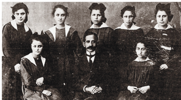
Ἀπόφοιτες τοῦ Παρθεναγωγείου Τραπεζούντας τό 1921

Στήν ἴδια κίνηση καί μὲ ἀνάλογη δραστηριότητα, ἀνήκει καί ἄλλο θυγατρικό παρακλάδι μὲ τήν ὀνομασία: "International Peace Youth Group".