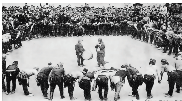
Φωτογραφική ἀποτύπωση τοῦ χοροῦ Σέρα, στήν περιοχή τῆς Τραπεζούντας, ἀρχές 20 οῦ αἰ. (Συλλογή Α.Σ. Μαῖλλη).