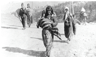
Στόν δρόμο τῆς προσφυγιάς

ΣΗΜΕΙΩΣΕΙΣ. 1. Ἰωάννης Μ. Φουντούλης, «Νεκρώσιμα Τελετουργικά», στό Τελετουργικά Θέματα, «Εὐσχημόνως καὶ κατὰ τάξιν» [Σειρά «Λογική Λατρεία», 12], Ἀθήνα: Ἀποστολική Δια- κονία 2002, σ. 154. 2. Ἀνδρέας Θεοδώρου, «Ἄμωμοι ἐν ὁδῷ Ἀλληλουῖα». Σχόλιο ἐρμηνευτικὸ στὴ Νεκρώσιμη Ἀκολουθία. Ἀθήνα: Ἀποστολική Διακονία 1990, σ. 38. 3. Ἀνδρέας Θεοδώρου, ὁ.π., σ. 38-39. 4. PG 155, 688A. Γιά τὴ χρήση τοῦ ἐλαίου στὴν ἐκκλησιαστικὴ ταφή βλ. πρωτ. Δ.Β. Τζέρ- πος, Ἡ ἀκολουθία τοῦ Νεκρωσίμου Εὐχελαίου..., Ἀθήνα 2000, σ. 125-141.