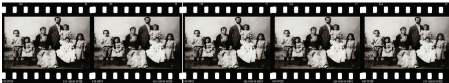
Οικογένεια της Κερασούντας, περ. 1910

του Σέκου, κοντά στα σύνορα με την Αυστρία (Σεπτέμβριος 1821). Η πολιορκία της μονής διήρκεσε περισσότερο από δύο εβδομάδες, στη διάρκεια των οποίων σκοτώθηκαν αρκετοί επαναστάτες. Στο τέλος ό Φαρμάκης με τούς λιγοστούς πολεμιστές του παραδόθηκε, για να βρει τραγικό θάνατο. Αντίθετα ό Γεωργάκης Όλύμπιος κλείστηκε με ένδεκα συμπολεμιστές στο κωδωνοστάσιο της μονής, όπου και ανατινάχθηκε, όταν είδε τούς έχθρους να εισέρχονται στον προαύλιο χώρο. Τό δεύτερο σώμα -μέ 250 περίπου ενόπλους και επικεφαλής τον αδελφό του Θ. Κολοκοτρώνη, Ίωάννη- ακολούθησε διαφορετική πορεία από αυτή των Όλύμπιου και Φαρμάκη. Κατευθύνθηκε νότια και διασχίζοντας τή βαλκανική χερσόνησο επιδίωξε να φτάσει στον Μοριά. Τό παράτολμο έγχείρημα του Ίωάννη Κολοκοτρώνη στέφθηκε, τελικά, με επιτυχία. Τόν Αύγουστο του 1821 έφτασε με εκατό περίπου ενόπλους στην Πελοπόννησο και έλαβε μέρος στην πολιορκία της Τριπολιτσάς, επικεφαλής της οποίας υπήρξε ό αδελφός του.