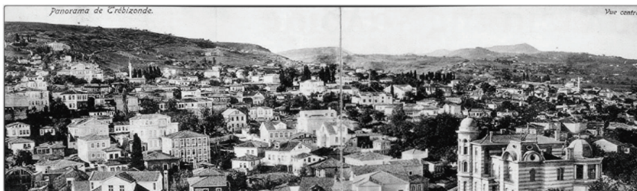
Άποψη τής Τραπεζούντας στις αρχές του 20 ου αϊ.

Όλη ή ζωή μας είναι δωρεά του Θεού, χάρισμα. Από τή δημιουργία μας μέχρι τή αναδημιουργία μας ό Θεός μάς έχει πλουτίσει μέ πολλά αγαθά. Μέσα από αυτήν τήν προοπτική πρέπει νά δούμε τή βιολογική και πνευματική μας ζωή.