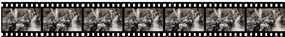
Εκδρομή στό θέρετρο Σουόκ Σουό, 5 χλμ. Ν.Δ. της Τραπεζούντας, 1913

ΣΗΜΕΙΩΣΕΙΣ. 1. Βλ. R. MacMullen, Christianizing the Roman Empire (AD 100-400) , New Haven 1984. 2. Για τόν λόγο αυτό οι αρχαίοι Έλληνες αποκαλούσαν τά νησιά αυτά «Κασσιτερίδες νήσους». 3. Στή συνέχεια ονομάζον «Πρεττανία», ή Διόδωρος Σικελιώτης και ή Στράβων «Βρετανία». Ό Στέφανος Βυζάντιος αναφέρει ότι ή Μαρκιανός Ηρακλειώτης, στό έργο του Περίπλους τής έξω θαλάσσης , ονομάζει τό νησί «Πρεττανική» και τούς κατοίκους «Άλβιώνιους», βλ. W. Smith, Dictionary of Greek and Roman Geography , London 1854, σ. 559-560. 4. Βλ. P. Hunter-Blair, Roman Britain and early England , 55 B.C.-A.D. 871, Edinburgh 1963' P. Salway, Roman Britain , Oxford 1991' S. Ireland, Roman Britain. A sourcebook , London-N. York 32008' P. Galliou, Britannia: histoire et civilisation de la Grande-Bretagne romaine: Ier-Ve siècles apr. J.C. , Paris 2004' M. Todd (έκδ.), A companion to Roman Britain , Oxford 2004' A. R. Birley, The Roman Government of Britain , Oxford 2005. 5. Σύμφωνα με παράδοση, ή όποία διασώζεται στό απόδιδόμενο στον άγιο Δωρόθεο επίσκοπο Τύρου (255-362) έργο Περί των έβδομηκοντα μαθητών , PG 92, 1060C-1076, έδω στ. 1064A. 6. Βλ. Ch. Thomas, Christianity in Roman Britain to AD 500 , London 1981' M. Henig, Religion in Roman Britain , New York 1984' R. Sharpe, "Martyrs and Local Saints in Late Antique Britain", στό Local Saints and Local Churches in the Early Medieval West , Oxford 2002, σ. 75-154' D. Knight, King Lucius of Britain , Stroud 2008.