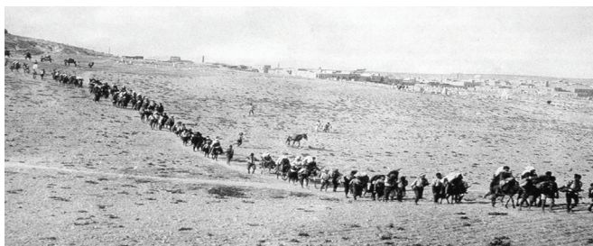
Στόν δρόμο τῆς προσφυγιάς

Ἦτι διαπιστώνει ὁ ἀπόστολος Παῦλος στούς Ἰουδαίους δυστυχῶς διαπιστώνεται διαχρονικά σέ πολλούς συνανθρώπους μας, ἀκόμη καί χριστιανούς. Τό βασικό πρόβλημά μας δηλαδή ἔναντι τοῦ Θεοῦ εἶναι ὁ ἐγωισμός μας, ὁ ὁποῖος μᾶς ὀδηγεῖ στή δαιμονική αὐτοθεοποίησή μας. Τό «ἔτσι μ' ἀρέσει», «αὐτό εἶναι τό γούστο μου», εἶναι ὄχι λίγες φορές αὐτά πού λέμε κι ἐμεῖς οἱ χριστιανοί. Ἡ λύτρωση καί ὁ Παράδεισός μας ὅμως, ἀπό τώρα, εἶναι τό γεννηθῆτω τό θέλημά σου, Κύριε . Κάποτε πρέπει νά ἀποδεχτοῦμε ὅτι ἡ δικαιοσύνη τοῦ Θεοῦ εἶναι καλύτερη καί ὑπέρτερη ἀπό τή δική μας.