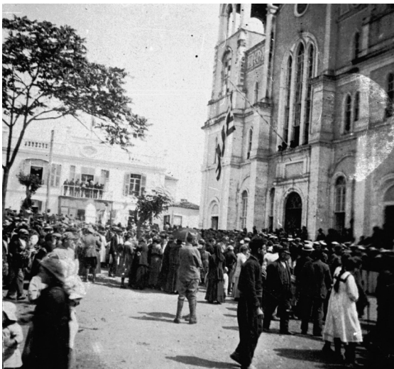
Ἀλεξανδρούπολη, Ι.Ν. Ἁγ. Νικολάου, στιγμιότυπο ἀπό τή δοξολογία γιά τήν ἀπελευθέρωση τῆς πόλης, 15 Μαΐου 1920