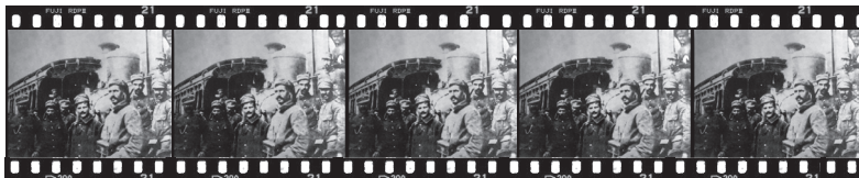
Ἕλληνες στρατιῶτες στόν σιδηροδρομικό σταθμό Κομοτηνῆς, 1920

Ἄν οἱ ἀπόστολοι ἱεράρχησαν σωστά τά πράγματα καί μᾶς διδάξαν παρομοίως νά κινούμαστε κι ἐμεῖς, ἦταν γιατί ἦσαν ἐνωμένοι μέ τόν Χριστό. Ἡ διάκριση πού εἶχαν ἦταν καρπός τῆς φωτισμένης ἀπό τό Πνεῦμα τοῦ Χριστοῦ καρδιάς τους. Κι ἔτσι μᾶς καθοδηγοῦν: σέ κάθε πρόβλη- μα στή ζωή μας τό πρῶτιστο εἶναι ἡ σχέση μας μέ τόν Χριστό καί ἡ ὑπακοή μας στόν λόγο Του. Ἴσως τελικά νά μὴν ὑπάρχουν ἄλλα οὐσιαστικά προβλήματα πέρα ἀπό τόν ἴδιο τόν ἑαυτό μας καί τή ζωντανή ἢ μὴ πίστη μας.