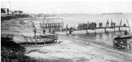
Ἀποβίβαση τοῦ Ἑλληνικοῦ Στρατοῦ στήν παραλία τοῦ Δεδέαγατς, (σημ. Ἀλεξανδρούπολη), 14 Μαΐου 1920

Βεβαίως, αὐτό δέν σημαίνει ἀπαραίτητα ὅτι ὁ κόσμος εἶναι Θεός, ἄν καί στούς προσωκρατικούς δέν εἶναι ξεκαθαρισμένο: πράγματι, ὁ κόσμος ἀναφαίνεται μερικές φορές ὡς Θεός καί δέν ὑπάρχει ἡ διάκριση μεταξύ Θεοῦ καί κόσμου, τήν ὁποία ἀργότερα θά συναντήσουμε πολύ καθαρά στή βιβλική παράδοση. Παρ' ὅλα αὐτά, μπορούμε νά δοῦμε ἐδῶ τήν πρόνοια καί τίς ἄκτιστες ἐνέργειες μέ τό χριστιανικό λεξιλόγιο πού θά ἀνιχνεύσουμε ἀργότερα, ἀκριβῶς στήν προσπάθεια νά φανερωθεῖ πῶς πίσω ἀπό τά φαινόμενα, πίσω ἀπό τήν ἀτασθαλία ἢ τήν ἐπιφανειακή ἄρμονία τῶν φαινομένων, κρύβεται τό βάθος μιᾶς πολύ μεγαλύτερης λογικότητας πού σαφῶς παραπέμπει σέ κάτι ἐπέκεινα αὐτοῦ τοῦ κόσμου.