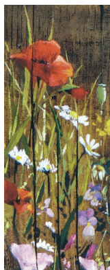
Ἀδιάβαστο δάσος (λεπτομέρεια)

ΣΗΜΕΙΩΣΗ. Τό παρόν κείμενο σχετίζεται ἐν μέρει μέ τό ἔργο χριστιανῶν θεολόγων, φιλοσόφων, και άπολογητῶν, ὅπως οἱ Robert Barron, William Lane Craig, Gary Habermas, Alvin Plantinga, Richard Swinburne, και N. T. Wright.