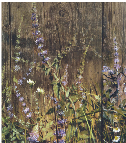
Ἀδιάβαστο δάσος (λεπτομέρεια)

ΣΗΜΕΙΩΣΕΙΣ. 1. Προβλ. J. Geiselmann, "Abendmahlsstreit", LThK 2 1(1957) 35: "Bei den jüngeren protest. Sekten ist das Abendmahl vielfach nur Danksagungs und Bekenntniszeremonie". 2. Große Katechismus (1529), Pars V. Schmalkaldischen Artikel (1537), II, 2. III, 6. Vom Abendmahl Christi , Bekenntnis (1528), WA 26, 261-509. Kurzes Bekenntnis vom heiligen Sakrament , (1544), WA 54, 141-167. Form. Conc. Epitome , VII. 3. De vera et falsa religione Commentarius (1525), Cap. 18. Fidei Ratio (1530), Art. 8. Expositio fidei Christianae (1531), Cap. 4.