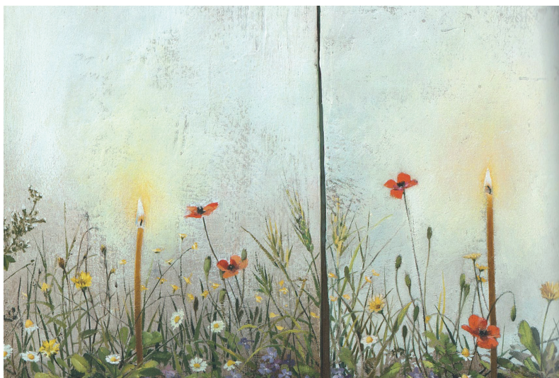
Αἶμα, σκοτάδι καὶ φῶς ἀδελφωμένα (λεπτομέρεια)

ΣΗΜΕΙΩΣΕΙΣ. 1. Ἰωάννης Μ. Φουντούλης, Λειτουργική Α' Εἰσαγωγή στή θεία λατρεία , Θεσσαλονίκη 2000, σ. 150-151. Τοῦ ἰδίου, Ἀπαντήσεις εἰς Λειτουργικάς Ἀπορίας , Β', σ. 290-291. 2. Ἰωάννης Μ. Φουντούλης, «Ἄρτοκλασία», ΘΗΕ , τ. 3, σ. 287-288. 3. Βλ. Γεώργιος Ρήγας, Ζητήματα Τυπικοῦ , Θεσσαλονίκη 1999, σ. 23-24. 4. Στο ἴδιο, σ. 23. 5. Βλ. Τυπικόν τοῦ Ὁσίου καὶ Θεοφόρου ἡμῶν πατρὸς Σάββα τοῦ Ἁγιασμένου , Βενετία 1771, σ. 5. 6. Στο ἴδιο. 7. «Διάταξις τῆς Ἱεροδιακονίας», Εὐχολόγιον τό Μέγα , Ἀθήνα 1970, σ. 6-7. 8. Γεώργιος Ρήγας, ὁ.π. , σ. 23. 9. Ἀρχμ. Δοσίθεος, «Υποσημειώσεις εἰς τὸ Β' Κεφάλαιον», στό Τυπικόν τοῦ Ὁσίου καὶ Θεοφόρου Πατρὸς ἡμῶν Σάββα τοῦ Ἁγιασμένου , Ἀθήνα: ἔκδ. Ἱερᾶς Σταυροπηγιακῆς Μονῆς Παναγίας Τατάρων 2006, σ. 77. Εἰς τό ἐξῆς παρατίθεται ὡς ΤΟΘΠΗΣ . 10. Βλ. Συμειῶν Θεσσαλονίκης, Περὶ τῆς λεγομένης ἀρτοκλασίας , PG 155, 240AB. Πρβλ. Ἰωάννης Μ. Φουντούλης, Ἀπαντήσεις εἰς Λειτουργικάς Ἀπορίας , Α', σ. 39.