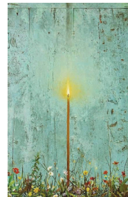
Ἀνθισμένη κυψέλη (λεπτομέρεια)