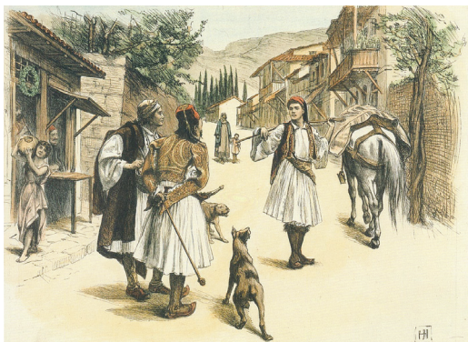
Σκηνές σέ ἐλληνικό χωριό, ἐπιχρωματισμένες ξυλογραφίες, ἔργα τοῦ G.P. Jacomb-Hood (1897)

Εἶναι παράλογο νά πιστεύει κανεῖς σέ κάτι μὴ ἀποδείξιμο; Ἄν ναι, τότε ἦταν παράλογος καί ὁ Γκόλντμπαχ. Τότε εἶναι παράλογα καί τά μαθηματικά, στόν βαθμό πού θεμελιώνονται σέ ἀξιώματα, δηλαδή σέ μὴ ἀποδείξιμες προϋποθέσεις. Ἄν ὅμως δέν εἶναι ἔτσι, τότε ἴσως θά πρέπει νά ξανασκεφτοῦμε τήν ἔννοια, τό περιεχόμενο, καί τά ὅρια τῆς λογικῆς. Θά πρέπει, μεταξύ ἄλλων, νά ἀναλογιστοῦμε ὅτι ὑπάρχει διαφορά ἀνάμεσα στό ἐάν κάτι ἰσχύει καί στό ἐάν διαθέτουμε τά ἀπαραίτητα δεδομένα καί τίς συνακόλουθες δυνατότητες νά τό ἀποδείξουμε.