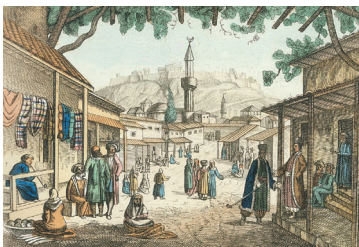
Ἡ ἀγορὰ τῶν Ἀθηνῶν, ἐπιχρωματισμένη ξύλογραφία, ἀντίγραφο ἔργου τοῦ Dodwell (πιθ. 1831-1845)

100,00€. Ἐάν ἔχει ἀνήλικα τέκνα ἢ τέκνα πού φοιτοῦν καί εἶναι κάτω τῶν 24 ἐτῶν, λαμβάνει καί τό σχετικό ἐπίδομα τῶν 50,00 ἢ 100,00€, ἀνάλογα γιὰ πόσα τέκνα λαμβάνει τό ὡς ἄνω ἐπίδομα. Σύνταξη Δημοσίου 233,54€, ΤΕΑΔΥ 60,19€, Ὑγειονομικὴ Περίθαλψη 79,64€ καί Ὑγειονομικὴ περίθαλψη 4,63€. Γενικό Σύνολο ἀκαθαρίστων ἀποδοχῶν 2.230,00€. Οἱ μηνιαίες κρατήσεις ἔχουν ὡς ἐξῆς: Ἀποστολικὴ Διακονία (περιοδ. Ἐκκλησία) 9,26€, Εἰσφορά Ἀλληλεγγύης 2% 37,04€, Σύνταξη Δημοσίου 116,86€, ΤΕΑΔΥ 60,19€, ΤΠΔΥ-ΤΠΟΕΚΕ 70,08€, ΤΠΔΥ-ΤΠΟΕΚΕ εἰδικὴ εἰσφορά 1% 18,52€, Ὑγειονομικὴ Περίθαλψη 39,82€, Ὑγειονομικὴ Περίθαλψη 7,41€, Εἰδικὴ Εἰσφορά Ἀλληλεγγύης 10,84€, ΦΜΥ 154,33€, Σύνταξη Δημοσίου 233,54€, ΤΕΑΔΥ 60,19€, Ὑγειονομικὴ Περίθαλψη ΟΠΑΔ 79,64€, Ὑγειονομικὴ Περίθαλψη ΟΠΑΔ 4,63€. Γενικό Σύνολο Κρατήσεων 902,35€. Καθαρές ἀποδοχές 1.327,65€ (2.230,00-902,35 = 1.327,65€).