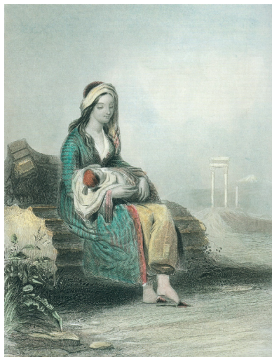
Ἡ Ἑλληνίδα μάνα, χαλκογραφία ἔργου τοῦ L. Hicks (19 ος αἰ.)