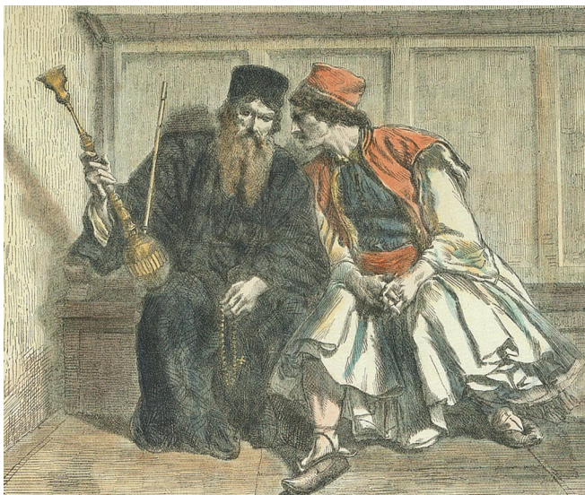
Ἡ ἐξομολόγησις, ἐπιχρωματισμένη ξυλογραφία ἔργου τοῦ Alexander Bida (1860)

ΣΗΜΕΙΩΣΕΙΣ. 1. Π. Βασιλειάδης, Lex Orandi , Ἀθήνα: Ἰνδικτος 2005, σ. 129. 2. Βλ. Προθεωρία, §§ 4 καί 5, σ. 6-7. Στίς ἐνορίες ὅμως δέν ψάλλεται ποτέ τό «Μακάριος ἀνὴρ...». Οὔτε καί ὁ Πολυέλεος στόν Ὅρθρο (ἔστω μερικοί στίχοι), καίτοι πρόκειται περί Βιβλικοῦ στοιχείου. Γιατί ἄραγε; 3. Βλ. Πρωτ. Γ. Τσέτσης, «Στοχασμοί γύρω ἀπό τό θέμα τῆς “Λειτουργικῆς Ἀναγεννήσεως”», στήν ἱστ. τῆς Ἀπ. Διακονίας, www.apostoliki-diakonia.gr . 4. Ἰωάν. Ζηζιούλας, Μητρ. Περγάμου, Ἡ Κτίσις ὡς Εὐχαριστία , Ἀθήνα 1992, σ. 22. 5. π. Ἀλέξανδρος Σμέμαν, Ἡ Ἐκκλησία Προσευχομένη - Εἰσαγωγή στή Λειτουργική Θεολογία , Ἀθήνα 1991, σ. 118. 6. Βλ. Ἰωάννης Φουντούλης, Ἀπαντήσεις εἰς Λειτουργικάς Ἀπορίας , Ε', σ. 290-294. 7. Ἀρχιμ. Δοσίθεος, «Υποσημειώσεις...», ΤΟΘΠΗΣ , ὁ.π., 78-79.