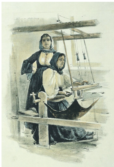
Ἀθηναῖες στὸν ἀργαλειό, σχέδιο τοῦ S. Melton Fischer (1890)