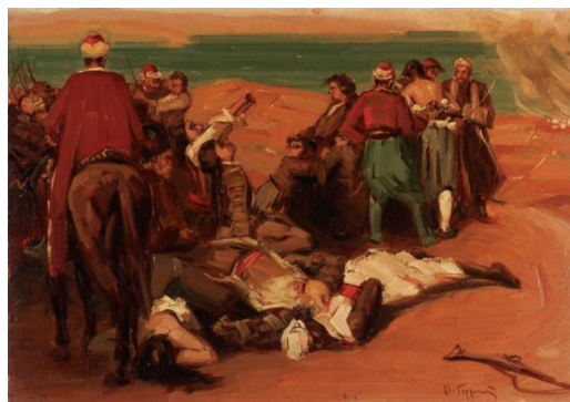
Βάσος Γερμενῆς, Ἡ σφαγή τῆς Χίου (ιδιωτική συλλογή)