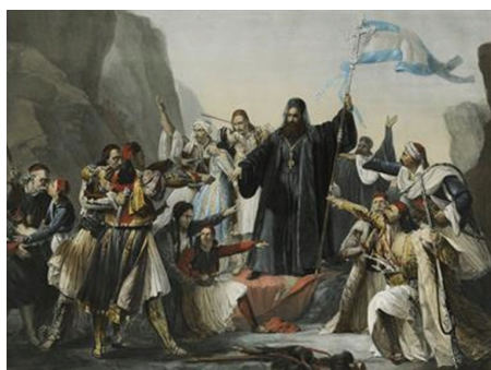
Λυδονίκο Λιππαρίνι, Ὁ Παλαιῶν Πατρῶν Γερμανός ὑψώνει τή σημαία τῆς Ἐπανάστασης (πιθ. 1838) Ἀθήνα, Ἐθνικό Ἱστορικό Μουσεῖο

* Τό ἀπόσπασμα προέρχεται ἀπό τά Ἀπομνημονεύματα τοῦ Κολοκοτρώνη, ὅπως τά ὑπαγόρευσε στόν Γεώργιο Τερτσέτη, βλ. Θεόδωρος Κολοκοτρώνης, Διήγησις συμβάντων τῆς ἐλληνικῆς φυλῆς (1770-1836) , Ἀθήνα: Βιβλιοπωλεῖον τῆς Ἑστίας 1901, τ. Α', σ. 49-53.