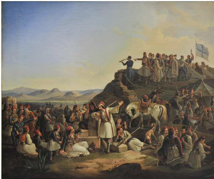
Θεόδωρος Βρυζάκης, Τό στρατόπεδο τοῦ Καραϊσκάκη (1855) Ἀθήνα, Ἐθνική Πινακοθήκη

ΣΗΜΕΙΩΣΗ. 1. Ντέιβιντ Μπέντλεϋ Χάρτ, Οἱ αὐταπάτες τῶν ἀθεϊστῶν: Ἡ χριστιανική ἐπανάσταση καί οἱ σύγχρονοι ἐχθροί της , μτφ. Βασίλης Ἀργυριάδης, Ἀθήνα: Ἐν Πλῶ 2017, σ. 219 καί ἐξῆς.