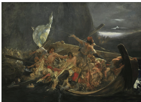
Νικόλαος Γύζης, Μετά τήν καταστροφή τῶν Φαραῶν (περ. 1896-1898), Ἀθήνα, Ἐθνική Πινακοθήκη