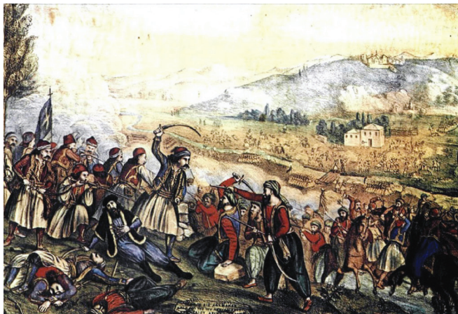
Άλέξανδρος Ήσαΐας, Ή μάχη της Αλαμάνας Αθήνα, Έθνικό Ίστορικό Μουσείο

Άπό τήν παραβολή του άφρονα πλουσίου, που στό εϋαγγέλιο του Λουκά προηγείται της ομάδας των λογίων μέσα στα όποια βρίσκεται και τό λόγιο που σχολιάσαμε, συνάγεται ακόμη ότι εκείνο που έμμέσως κατακρίνεται, πέρα από τήν υπέρμετρη συγκέντρωση άγαθών που ξεπερνούν τίς πραγματικές άνάγκες του ανθρώπου, εΐναι ή έγωκεντρική συσσώρευση των άγαθών, μιá προσπάθεια δηλαδή που άγνοεί τήν ύπαρξη και τίς πιό έντονες ίσως άνάγκες του πλησίον. Έτσι, ένω ή φυσιολογική μέριμνα του ανθρώπου θά μπορούσε νά καλύψει τίς άνάγκες του και αυτές του άνήμπορου διπλανού του (ή ακόμη και του μακρινού του συνανθρώπου), ή άφύσικη άγχώδης άναζήτηση και συσσώρευση άγαθών όχι μόνο δέν παρατείνει ούτε κατ' έλάχιστον τή ζωή του, αλλά άπεναντίας τήν συντομεύει χρονικά και της άφαιρεί τήν άξία της οϋσιαστικά.