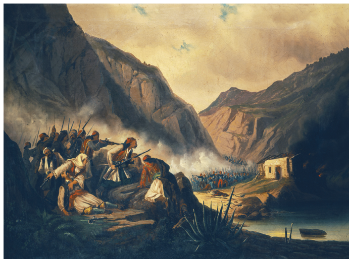
Θεόδωρος Βρυζάκης, Ἡ μάχη στὰ Δερβενάκια Ἀθήνα, Ἐθνικὴ Πινακοθήκη

ΣΗΜΕΙΩΣΕΙΣ. 1. Ἰωάννου Χρυσοστόμου, Εἰς τὸν 8ον φαλμὸν 7, PG 55,117. Πβ. Α' Κορ 1,9-10, 16· Β' Πέτρ 1, 4· Β' Κορ 13, 13. 2. Πρωτοπρ. Βασίλειος Ἰ. Καλλιακμάνης, Μεθοδολογικά πρότερα τῆς ποιμαντικῆς . Λεντίω ζωννύμενοι, Θεσσαλονίκη: Μυγδονία 2000, σ. 44. 3. Μακαρίου τοῦ Αἰγυπτίου, Ὁμιλία 4, 12 PG 34, 481B. 4. Γ. Ἰ. Μαντζαρίδης, Ἡ περὶ θεώσεως τοῦ ἀνθρώπου διδασκαλία Γρηγορίου τοῦ Παλαμᾶ , Θεσσαλονίκη, σ. 57-58. 5. Μαξίμου τοῦ Ὁμολογητοῦ, Μυσταγωγία , Εἰσαγωγή-Σχόλια Πρωτοπρ. Δημήτριος Στανιλοάε, Μετάφρ. Ἰγνάτιος Σακαλῆς, Ἀθήνα: Ἀποστολική Διακονία 1973, σ. 208. 6. Συμεών Θεσσαλονίκης, Περὶ τῆς Ἱερᾶς Λειτουργίας , PG 155, 253C. 7. Δ. Ἰ. Τσελεγγίδης, Χάρη καί ἐλευθερία κατὰ τὴν Πατερικὴν παράδοση τοῦ 14' αἰώνα . Συμβολή στή σωτηριολογία τῆς Ὁρθόδοξης Ἐκκλησίας [Φιλοσοφική καί Θεολογική Βιβλιοθήκη, ἀριθ. 9], Θεσσαλονίκη: Π. Πουρναράς 1987, σ. 111-113. 8. Νικολάου Καβάσιλα, Περὶ τῆς ἐν Χριστῷ ζωῆς , Λόγος Δ', στό Φιλοκαλία τῶν Νηπτικῶν καί Ἀσκητικῶν , 22, Θεσσαλονίκη: ἐκδ. Γρηγόριος ὁ Παλαμᾶς 1979, σ. 432: «Τοῦτο τὸ μυστήριον φῶς μέν ἐστι τοῖς ἤδη κεκαθαρμένοις, καθάρσιον δὲ τοῖς ἐτι καθαιρομένοις, ἀλείπτῃς δὲ κατὰ τοῦ πονηροῦ καὶ τῶν παθῶν ἀγωνιζομένοις». 9. Ἰωάννου Χρυσοστόμου, Πρὸς τοὺς ἐγκαταλειψάντας τὴν σύναξιν τῆς Ἐκκλησίας , PG 51, 70B. 10. Θεοφυλάκτου Βουλγαρίας, Πρὸς Ἐφεσίους Ἐπιστολῆς Ἐξήγησις , 3, PG 124, 1077.