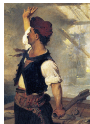
Ν. Λύτρας, Ὁ Κανάρης πυροπολεῖ τήν τουρκική ναυαρχίδα (λεπτομέρεια), 1873, Μέτσοβο, Πινακοθήκη Ἀβέρωφ