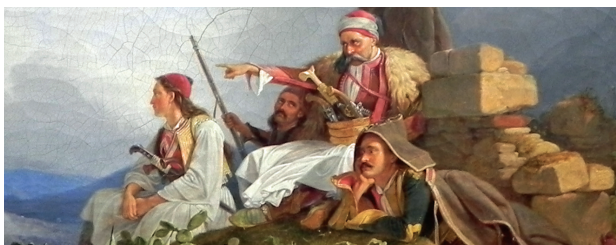
Peter von Hess, Παληγάρια στήν Ἀθήνα (λεπτομέρεια), 1829. Βερολίνο, Παλαιά Ἐθνική Πινακοθήκη

Ἀναλογιζόμενοι τά παραπάνω καταλήγουμε στό συμπέρασμα ὅτι, παρά τά ὅποια θετικά στοιχεῖα πού ἐνδέχεται νά συναντήσουμε στόν Ἰουδαϊσμό ἢ τό Ἰσλάμ, ἡ ἀγάπη στήν τέλεια μορφή τῆς ἀποτελεῖ ἀναμφισβήτητο συγκριτικό πλεονέκτημα τοῦ Χριστιανισμοῦ.