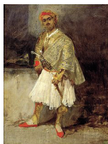
Richard Parkes Bonington, Ἕλληνας ἀρματολός (1825-26), Αθήνα, Μουσεῖο Μπενάκη

ΕΝΔΕΙΚΤΙΚΗ ΒΙΒΛΙΟΓΡΑΦΙΑ. Κυριάκος Συφιλιτζόγλου, ἕκαστος εφ' ω ἐτάφη , Λάρισα: Θράκα 2017. Θανάσης Ν. Παπαθανασίου, Με την ψυχή στα πόδια. Από το μήνμα το κενό στους δρόμους του κόσμου , Αθήνα: Ἐν πλῶ 2007.