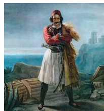
Ludivico Lipparini, Σουλιώτης πού σκέφτεται τήν πατρίδα του (1837) ἰδιωτική συλλογή