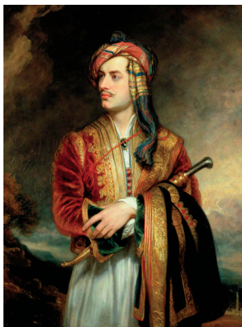
Thomas Phillips, Ἵ Βύρων μέ στολή Σουλιώτη (1813), Λονδίνο, National Portrait Gallery

Ἡ μαρτυρία αὐτή τῆς ἀνθρωπολογικῆς σημασίας τῆς Ἀνάστασης τοῦ Χριστοῦ συνεχίζεται στή ζωή καί τή λατρεία τῆς Ἐκκλησίας καί ἰδιαίτερα στή Βυζαντινή τέχνη, στήν ὁποία δέν ἀπεικονίζεται ἡ ἀνάσταση καθ' ἑαυτήν (ἐκτός ἀπό κάποιες δυτικές ἀναγεννησιακές εἰκόνες πού εἰσχώρησαν στήν Ἀνατολή χωρίς νά ἐπικρατήσουν), ἀλλά ὁ Χριστός πού σπάζει τίς κλειδαριές τοῦ ἄδη καί νικώντας τόν θάνατο δίνει τό χέρι του καί ἀνασταίνει τόν Ἀδάμ καί τήν Εὐά, ἐκπροσώπους τοῦ ἀνθρώπινου γένους.