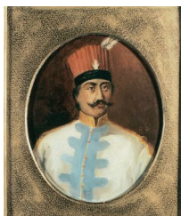
Άγνώστου, Λάμπρος Κατσώνης, Άθήνα, Εθνικό Ιστορικό Μουσείο

Μέσα άπ' αὐτές τίς μικρές πινελιές συνειδητοποιεῖ κανείς ὅτι ὁ μοναχισμός με τήν εμφάνισή του, άνάμεσα σέ πολλά άλλα (με τά ὁποῖα θά άσχοληθοῦμε σέ ἐπόμενες φορές), ἔστρεψε ξανά τή χριστιανική Ἐκκλησία στά βασικά τῆς άνθρώπινης ὕπαρξης και στό πῶς αὐτά φωτίζονται από τό φῶς τῆς Βασιλείας τοῦ Θεοῦ πού οί Χριστιανοί άναμένουν και ζοῦν ἤδη άπ' αὐτή τή ζωή: ή άσθένεια εἶναι, ταυτόχρονα με τήν άδικία ή τή φιλαυτία, μέρος ενός ανισόροπου και άδικου κόσμου. Άπάντηση σ' αὐτό δέν εἶναι ή θαυματουργική αὐτοματική κατάργηση των ὕλικῶν ὄρων (τοῦ σώματος, τῆς ὕλης), αλλά ή αλλαγή των ανθρώπινων σχέσεων πού νοηματοδοτοῦν τήν κατανόηση τοῦ κόσμου με τά κριτήρια τῆς Βασιλείας τοῦ Θεοῦ. Ἔτσι, ὁ πρωτοεμφανιζόμενος μοναχισμός ἐκκλησιάζει τήν άσθένεια.