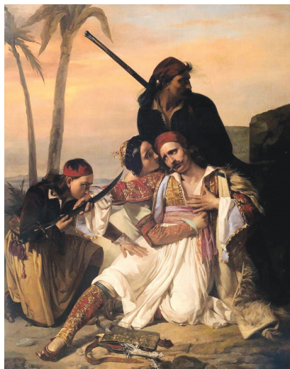
Ludovico Lipparini, Ὁ θάνατος τοῦ Λάμπρου Τζαβέλα (1840) ιδιωτική συλλογή