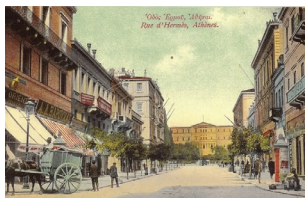
Ἡ ὁδός Ἐρμού (ἀριστερά) καί ἡ ὁδός Αἰόλου (δεξιά), ταχυδρομικά δελτάρια τοῦ 19 ου αἰ.

ΣΗΜΕΙΩΣΕΙΣ. 1. J. Jeremias, "«Ἄνθρωποι εὐδοκίας» (Lc 2,14)", Zeitschrift für das Neue Testament und die Kunde des älteren Kirche 28 (1929) 13-20. 2. Στό βιβλίο του The living text of the Gospels , Cambridge University Press 1997, σ. 212.