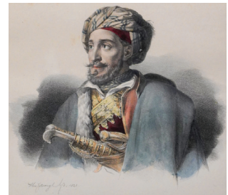
Karl Krazeisen, Ὁ Μακρουγιάννης. λιθογραφία (1828)