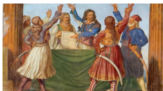
L.M. von Schwanthaler, Ἡ Ἐθνοσυνέλευση τῆς Ἐπιδαύρου, Βουλὴ τῶν Ἑλλήνων (1836)

Ἡ Ἱερά Σύνοδος τῆς Ἐκκλησίας τῆς Ἑλλάδος ἀποφάσισε πρὶν ἀπὸ δύο χρόνια νά ἀφιερῶσει τήν πρώτη Κυριακή μετά τὰ Χριστούγεννα στήν προστασία τῆς ζωῆς τοῦ ἀγέννητου παιδιοῦ. Ἡ ἐνέργεια αὐτή ἐγγράφεται στή μεγάλη χριστιανική παράδοση τῆς ὑπεράσπισης τοῦ ἀδύνατου, τοῦ ἀπροστάτευτου, ἐκείνου πού δέν ἔχει φωνή. Ἡ ἐπιλογή ἐξάλλου τῆς πρώτης Κυριακῆς μετά τὰ Χριστούγεννα μᾶς θυμίζει ὅτι ἡ γέννηση κάθε παιδιοῦ ἀντανακλᾷ κάτι ἀπὸ τή χαρά πού ἔφερε στόν κόσμον μέ τή γέννησή του ὁ Χριστός. Ἐχουμε τὸ χρέος νά σεβαστοῦμε τή ζωή τῶν ἀγέννητων παιδιοῦν ἀλλά καί τή δυνατότητα νά γευτοῦμε τή χαρά τῆς παρουσίας τους.