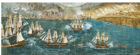
Martin Verdiot, Ἡ ναυμαχία τοῦ Ναυαρίνου, λεπτομέρεια, Ἀθήνα, Μουσεῖο Μπενάκη

Πόσον ὑψηλὴ καὶ ζωτικὴ ὑπῆρχεν ἡ πίστις τοῦ ἀνδρείου Κολοκοτρώνη, καὶ πόσον αἰσθητικὴ καὶ εὐγνωμονοῦσα πρὸς τὰς δωρεὰς τοῦ Θεοῦ. Ὅτε τὸ πρῶτον ἔφευγεν ἐκ τῆς πατρίδος τὸν κίνδυνον τοῦ διωγμοῦ, διέβη διὰ τινῶν ἐρειπίων κατηδαφισμένον ναοῦ τῆς Θεοτόκου, καὶ σταθεὶς καὶ δακρυσάς, ᾧ Παντάνασσα, εἶπε σῶσόν με διὰ τῶν ἀγίων σου πρεσβειῶν, καὶ ἀξίωσόν με πάλιν ἐπιστρέψαι βοηθὸς τοῦ τεταπεινωμένου λαοῦ σου, καὶ λατρεῦσαι μετ' αὐτοῦ τὸν υἱόν σου καὶ Θεόν μου καὶ Κύριον εἰς τοῦτο τὸ πρῶτον τῆς Θεομητορικῆς σου δόξης ἀγιαστήριον, ἐκ βάθρων ὑπ' ἐμοῦ ἀνεγερμένον. Καὶ ἐπανελθὼν ἀπέδωκε τὴν εὐχὴν τῷ Κυρίῳ κτίσας τὸν ναὸν τῆς ἀγίας Μονῆς. [...]