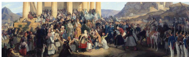
P. von Hess, Ἡ ὑποδοχὴ τοῦ ᾽Οθωνα στήν Ἀθήνα, λεπτομέρεια (1839), Μόναχο, Neue Pinakothek

Ὁ δρόμος τοῦ χριστιανοῦ δέν εἶναι εὐκόλος. «Οὐδεὶς ἀνήλθεν εἰς τὸν οὐρανὸν μετὰ ἀνέσεως». Χρειάζεται νά σταυρώνουμε καθημερινῶς τὰ πάθη μας ὡς μέλη Χριστοῦ, προκειμένου νά διατηρεῖται ἡ χάρις τοῦ βαπτίσματος μέσα μας, ὁ ἴδιος ὁ Χριστός. Ὅλοι οἱ ἅγιοι τό ἔκαναν. Ἀπομένει νά τό ἀποδεικνύουμε καὶ ἐμεῖς.