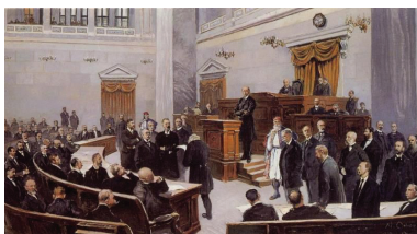
Ν. Ὁρλώφ, Τό Ἑλληνικό Κοινοβούλιο στά τέλη τοῦ 19 ου αἰ. (1930), Ἀθήνα, Ἐθνικό Ἱστορικό Μουσεῖο

Ἔτσι, ὁ Γεδεών θά προστεθεῖ στή μακρά ἀλυσίδα τῶν ἀνθρώπων πού, ἂν καί μέ ἀνθρώπινα κριτήρια φαίνονται ἀκατάλληλοι γιά τήν ἐκπλήρωση τοῦ σχεδίου τοῦ Θεοῦ, καθίστανται τελικά ὄργανά του. Ἡ συνέχεια τῆς ἱστορίας θά ἀποδείξει καί μέ τό παράδειγμα τοῦ Γεδεών ὅτι αὐτό πού ὀδηγεῖ τήν Ἱστορία πρὸς ἕνα τέλος δέν εἶναι ἡ δύναμη καί ἡ ἐπιβολή τῶν ἀνθρώπινων σχεδιασμῶν, ἀλλά ὁ ἴδιος ὁ Θεός, ὁ ὁποῖος ἀποστέλλει τούς ἄγγελους του γιά νά ἐνισχύσει ἄνθρώπους πρόθυμους νά ἀναγνωρίσουν τό θέλημά του καί νά συνεργαστοῦν μαζί του γιά τήν ὀλοκλήρωση τοῦ σχεδίου του γιά τόν κόσμο.