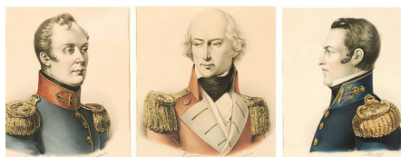
Χέυδεν, Κόδρινγκτον καὶ Δερικνύ (ἀπὸ ἀριστερὰ πρὸς δεξιὰ), οἱ ναύαρχοι τῶν εὐρωπαϊκῶν πλοίων στὸ Ναυαρίνο

ΣΗΜΕΙΩΣΕΙΣ. 1. Ἱεροδιακονικόν , Καρυαί-Ἅγιον Ὅρος; Πανσέληνος 1989, σ. 43. 2. Μ. Πρωτοπρ. Κωνσταντῖνος Παπαγιάννης, «Λειτουργικῶν ἀτόπων ἐπισήμανσις», Γρηγόριος ὁ Παλαμᾶς 80 (1997) 220-221· 225-227. 3. Ἰωάννης Μ. Φουντούλης, Ἀπαντήσεις εἰς Λειτουργικὰς Ἀπορίας , τ. Γ', Ἀθήνα: Ἀποστολικὴ Διακονία 1991, σ. 47-48. 4. Χρ. Παντελεήμονος 770. Παναγιώτης Ν. Τρεμπέλας, Αἱ τρεῖς Λειτουργίαι κατὰ τοὺς ἐν Ἀθήνας κώδικας , Ἀθήνα 21982, σ. 8. 5. Ἰωάννης Χρυσόστομος, Εἰς τὰς Πράξεις τῶν Ἀποστόλων 19, 5, PG 60, 156 ε'. 6. Νικόλαος Καβάσιλας, Εἰς τὴν θείαν Λειτουργίαν , Source Chrétiennes , 4bis, 150 (= PG 150, 413B). 7. Νικόλαος Καβάσιλας, ὁ.π., SC 4bis, 152 (= PG 150, 413B). 8. Νικόλαος Καβάσιλας, ὁ.π., SC 4bis, 152 (= PG 150, 413C). 9. Νικόλαος Καβάσιλας, ὁ.π., SC 4bis, 152 (= PG 150, 413C). 10. Νικόλαος Καβάσιλας, ὁ.π., SC 4bis, 152 (= PG 150, 413C). 11. Νικόλαος Καβάσιλας, ὁ.π., SC 4bis, 152 (= PG 150, 414A). Βλ. καὶ Γρηγόριος Ἱερομόναχος, Ὁ Ἐκκλησιασμός , σ. 43-44. 12. Ἰωάννης Μ. Φουντούλης, Τὸ λειτουργικὸν ἔργον Συμεῶν τοῦ Θεσσαλονίκης [Συμβολὴ εἰς τὴν ἱστορίαν καὶ θεωρίαν τῆς θείας Λατρείας], Θεσσαλονίκη 1965, σ. 115-141· Ἄ. Γιέβτιτς, «Ὁ ἅγιος Συμεών Θεσσαλονίκης ὡς ἐρμηνευτὴς τῶν ἱερῶν ἀκολουθιῶν», στὸν τόμο Χριστὸς ἀρχὴ καὶ τέλος , Ἀθήνα: Ἰδρυμα Γουλιανδρῆ-Χόρν 1983, σ. 265-308. 13. Συμεών Θεσσαλονίκης, Διάλογος... , PG 155, 292BD-586CD.