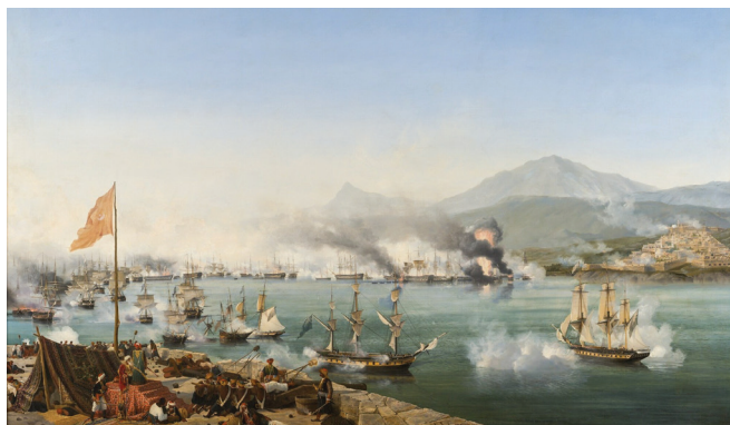
A.L. Garneray, Ἡ Ναυμαχία τοῦ Ναυαρίνου (1827)

Στήν πατερική θεολογία, ὅμως, δέν ὑπάρχει ἡ ἀντίληψη τῆς ἐπιστροφῆς. Ἡ ἔννοια τῆς κινήσεως εἶναι ἀπολύτως θετική, δημιουργεῖ ἓνα θετικό γεγονός, ἡ σωματικότητα εἶναι ἀπολύτως θετικό γεγονός, δέν πρόκειται γιά ἀρνητική κίνηση τοῦ Θεοῦ, οὔτε γιά πτώση, ἀλλά γιά μιᾶ διαλογική πόρευση, πού ὀδηγεῖ συνεχῶς σέ καινούρια πράγματα. Ἡ Βασιλεία τοῦ Θεοῦ εἶναι μιᾶ ἀνακάλυψη, κάτι πού ἔρχεται, κάτι καινούριο, πού δέν ξέρουμε τί εἶναι – πάντως δέν ἀποτελεῖ ἐπιστροφή. Γιατί ἡ ἐπιστροφή εἶναι μιᾶ κατάσταση ἀτελής, ἡ πρωταρχική κατάσταση τοῦ Ἀδάμ· ἡ τελικὴ κατάσταση θά εἶναι μιᾶ κατάσταση, θά λέγαμε, συνεχοῦς γνώσεως, μιᾶς τελειότητος πού ποτέ δέν τελειώνει καί πάντοτε, ἂν καί εἶναι πλήρης, ἔχει τά χαρακτηριστικά τῆς συνεχοῦς ἀνανέωσης, τοῦ συνεχοῦς γίγνεσθαι.