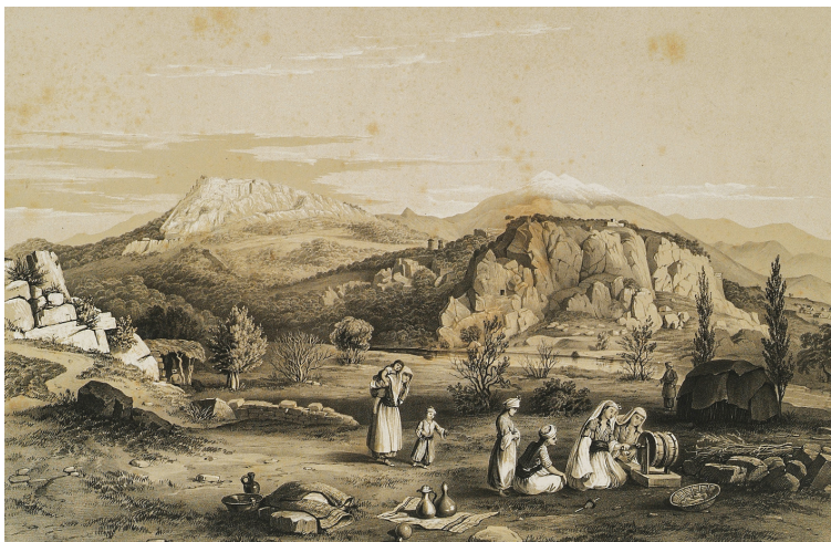
Τοπίο στήν Ξάνθο τῆς Μ. Ἀσίας, ἀπό τό βιβλίο τοῦ Ch. Fellows, Lycia, Caria, Lydia , London: Messrs. Paul and Dominic Colnaghi 1847