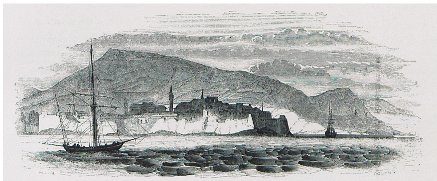
Ἐπάνω: Ἀποψη τῆς Φώκαιας στή Μ. Ἀσία. Κάτω: Ἀποψη τῆς Μαρμαρίδας (ἀρχαίου Φύσκου καί μετέπειτα Μαρμαρίτσι) στή Μ. Ἀσία. Ἀπό τό βιβλίο τοῦ J.H. Allan, A Pictorial Tour in the Mediterranean: Including Malta-Dalmatia-Turkey-Asia Minor etc. , London: Longman, Brown, Green, and Longmans 1843

ΣΗΜΕΙΩΣΕΙΣ. 1. Πβ. Παῦλος Μενεβίσογλου, Ἱστορική εἰσαγωγή εἰς τοὺς Κανόνας τῆς Ὁρθοδόξου Ἐκκλησίας , Στοκχόλμη 1990, σ. 55-73 καί 83-91. 2. Πρόκειται, συνοψίζοντας, γιά τήν Δ'-451 (κανόνας 1), τήν Πενθέκτη-691 (κανόνας 2) καί τήν Ζ'-787 (κανόνας 1) Οἰκουμενικές Συνόδους, δίπλα στίς προηγηθεῖσες Α'-325, Β'-381 καί Γ'-431 Οἰκουμενικές Συνόδους, οἱ ὁποῖες θέσπισαν αὐτόνομα ἱερούς Κανόνες. Ἀπασες καί σύμπασες αὐτές οἱ Οἰκουμενικές Σύνοδοι, ὁμοθυμαδόν καί ἀπό κοινοῦ, ἀπαρτίζουν τόν ἐπονομαζόμενο συνοπτικά ἐδῶ Κανονοθέτη τῆς Ἐκκλησίας .