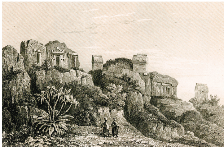
Λαξευτοὶ λυκιακοὶ τάφοι στή Μάκρη (ἀρχαία Τελμησσός, σημ. Φετχιγιέ) τῆς Λυκίας