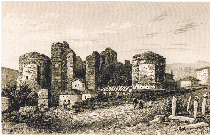
Πέργαμος, ἐρείπια τῆς βασιλικῆς τοῦ Ἁγίου Ἰωάννη τοῦ Θεολόγου

Γκραβούρες ἀπό τό βιβλίο τοῦ περιηγητῆ Ch.F.M. Texier, Asie Mineure. Description géographique, historique et archéologique des provinces et des villes de la Chersonnèse d'Asie, Paris: Firmin-Didot 1882.