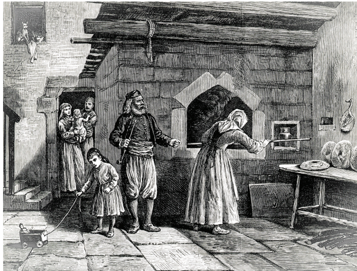
Τό ψήσιμο τοῦ ψωμοῦ σ' ἓνα ἐλληνικό χωριό στήν πεδιάδα τῆς Τροίας. Ξυλογραφία ἀπό τό περ. Illustrated London News, 1878

ΣΗΜΕΙΩΣΕΙΣ. 1. Γιά τή σύνταξη τοῦ παρόντος ἄρθρου λάβαμε ὑπόψη τά ἀκόλουθα: R. Bernhardt (Hrsg), Horizontüberschreitung. Die Pluralistische Theologie der Religionen , Gütersloh 1991. C. Danz, Einführung in die Theologie der Religionen , Wien 2005. P. Schmidt-Leukel, Gott ohne Grenze. Eine christliche und pluralistische Theologie der Religionen , Gütersloh 2005. U. Dehn - U.C. Seeger - F. Bernstorff (Hrsg), Handbuch Theologie der Religionen , Freiburg/Basel/Wien 2017. 2. H. Krüger - W.Löser - W. Müller-Römheld (Hrsg), Ökumene Lexikon. Kirchen - Religionen - Bewegungen , Frankfurt am Main 1983, στ. 1133.