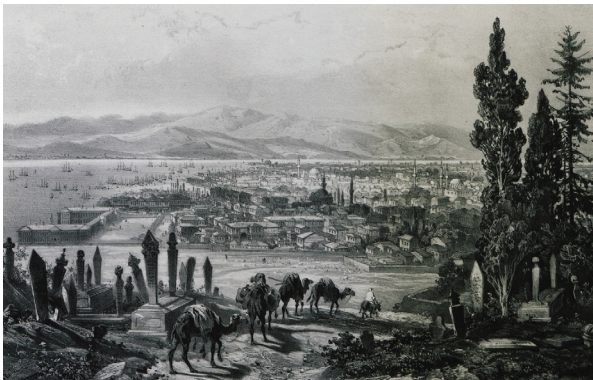
Πανοραμική ἀποψη τῆς Σμύρνης, ἀπό τό βιβλίο τοῦ J. Schranz, Le Bosphore et Constantinople, dessinés d'après nature, Κωνσταντινούπολη, [περ. 1850]

Τό ἐπίδομα τῶν λεγομένων παραμεθορίων καί προβληματικῶν περιοχῶν τό λαμβάνουν μόνοι ἐκεῖνοι οἱ κληρικοί πού διακονοῦν σέ Μητροπόλεις, πού διοικητικά ἀνήκουν στίς ὡς ἄνω περιοχές, οἱ ὁποῖες ἔχουν χαρακτηριθεῖ ἀπό τήν Πολιτεία μέ νομοθετική Πράξη. Τό χρηματικό ἐπίδομα τῆς συγκεκριμένης περιπτώσεως ἀνέρχεται στό ποσόν τῶν ἑκατό (100,0) Εὐρώ μεικτά. Μετά τήν ἀπόδοση τῶν συγκεκριμένων κρατήσεων (γιατί ὑφίστανται κρατήσεις καί στό συγκεκριμένο ἐπίδομα), ὁ κληρικός λαμβάνει καθαρό πληρωτέο ποσό περίπου 70,60 Εὐρώ. Σέ περίπτωση πού κληρικός ἐκάστης Μισθολογικῆς Κατηγορίας λαμβάνει Μισθολογικό Κλιμάκιο μετά ἀπό προβλεπόμενη χρονική διάρκεια χορηγήσεως αὐτοῦ, ἔχει μιᾶ ἀύξηση τῆς τάσεως τῶν πενήντα (50,00) Εὐρώ μεικτά στίς μηνιαῖες ἀποδοχές του καί λαμβάνει καθαρό πληρωτέο ποσό τριάκοντα πέντε (35,00) περίπου Εὐρώ μηνιαίως μετά ἀπό τίς προβλεπόμενες κρατήσεις. Πρέπει νά ἔχουμε ὑπ' ὄψιν ὅτι ὅλες οἱ ἀποδοχές ἐμπίπτουν σέ προβλεπόμενες νομοθετικές κρατήσεις. Ἐπομένως, πολλοί κληρικοί ἔχουν τήν ἐσφαλμένη ἐντύπωση ὅτι, ὅταν λαμβάνουν Μισθολογική προαγωγή Κλιμακίου, θά ἔχουν στίς μηνιαῖες ἀποδοχές πενήντα Εὐρώ ἀύξηση, γεγονός πού δέν ἰσχύει.