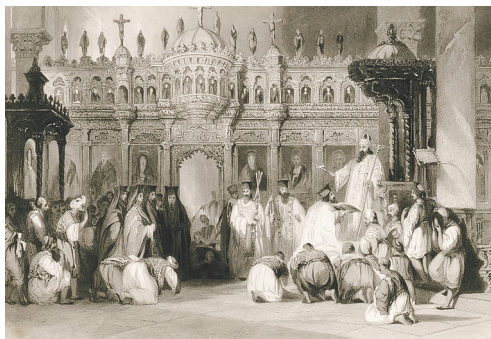
Ὁ μητροπολιτικὸς ναὸς τῆς Μαγνησίας (σημ. Μανίσα), σχέδιο τοῦ Th. Allom, ἀπὸ τό βιβλίον τοῦ R. Walsh, Constantinople and the Scenery of the Seven Churches of Asia Minor , London/Paris: Fisher [1836-38]

(Αλέξανδρος Μωραϊτίδης, Μὲ τοῦ βορῆα τὰ κύματα. Ταξίδια - περιγραφαὶ - ἐντυπώσεις , Σειρὰ Α' Ἀθήνα: Σιδέρης 1922).