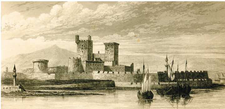
Τό φρούριο τῶν Ἰωαννιτῶν ἱπποτῶν στό λιμάνι τῆς Ἀλικαρνασσῶ, ἀπό τό βιβλίό τοῦ Ch.F.M. Texier, Asie Mineure , Paris: Firmin-Didot 1882.

τό λέει στό κείμενο: «Ἡ δὲ τῶν αὐτῶν ἀνθρώπων σύστασις ἐξ ἀνάγκης ἐπομένην δείκνυσιν τήν τῶν νεκρωθέντων καί διαλυθέντων σωμάτων ἀνάστασιν» (Περὶ Ἀναστάσεως 15, PG 6:1004C). Γιά νά ἀνασυστηθοῦν οἱ ἴδιοι ἀκριβῶς ἄνθρωποι, ὀφείλει κατ' ἀνάγκην νά ἀνασυσταθεῖ καί ἡ φύσις ἀκριβῶς τῶν διαλυθέντων καί νεκρωθέντων σωμάτων. «Ταύτης γὰρ χωρίς, οὔτ' ἂν ἐνωθεῖ τὰ αὐτὰ μέρη κατὰ φύσιν ἀλλήλοις οὔτ' ἂν συσταίει τῶν αὐτῶν ἀνθρώπων ἡ φύσις» (αὐτ.). Ἐάν δέν γίνεαι ἀνασύστασις τῆς ψυχοσωματικῆς ὑφῆς τοῦ ἀνθρώπου, δέν θά ἔχουμε τά αὐτά μέρη, ψυχὴ καί σῶμα, νά ἐνοποιοῦνται ξανά κατὰ φύσιν, οὔτε θά ἐνοποιηθεῖ, θά ἀνασυσταθεῖ καί θά διαιωνισθεῖ ἡ φύσις τῶν ἴδιων ἀνθρώπων μέ αὐτούς πού προηγουμένως ὑπῆρξαν. Μέ ἄλλα λόγια δέν θά εἶμαι ἐγώ, δέν θά εἶστε σεῖς, ὁ συγκεκριμένος ἐγώ, ὁ συγκεκριμένος ἐσεῖς πού θά ὑπάρξει αἰώνια. Καί βεβαίως ἐδῶ ἔχουμε, ὅπως φαίνεται γιά πρώτη φορά, τήν ἐξάπλωση τῆς λογικότητος στήν ὅλη ψυχοσωματικὴ ἀνθρώπινη ὑπόστασις.