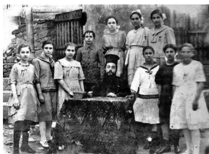
Ἐπάνω: Μαθήτριες τοῦ Παρθεναγωγείου στήν Τσατάλτζα μέ τόν δάσκαλό τους, 1919