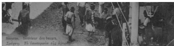
Στήν άγορά τής Σμύρνης

ΣΗΜΕΙΩΣΕΙΣ. 1. Ίωάννης Κανονίδης, Πρωτάτο II. Η συντήρηση των τοιχογραφιών , Έφορεία Αρχαιοτήτων Χαλκιδικής και Αγίου Όρους Πολυγύρος 2015, Α', 225, 249- (βόρειο τόξο), 283 (νότιο), Β', 150-151 (νότιο). 2. Δημήτρης Καλομοιράκης, «Έρμηνευτικές παρατηρήσεις στο εικονογραφικό πρόγραμμα του Πρωτάτου», ΔΧΑΕ, περ. Δ', τ. ΙΕ' (1989-1990) 197-220, 204-206, Είχ. 1 (εικονογραφικό πρόγραμμα), 212-214, 213: οί πρώτοι Ίερείς του Ιουδαϊκού λαού που αντιπροσωπεύουν την άπαρχή τής ιερωσύνης και του θεσμού τής εκ Θεού βασιλείας στον κόσμο. Στη μονή Χώρας (Κωνσταντινούπολη) υπάρχουν στον Β. τρούλλο του νάρθηκα (κάτω σειρά) πέντε εκ των άνωτέρω μορφών (Δανιήλ, Μωυσής, Ααρών, Σαμουήλ, Μελχισεδέκ) από σύνολο 11, εκφράζοντας μία γενικότερη κατηγοριοποίηση πάνω στην ιερωσύνη και ήγγεσία, βλ. Paul Unterwood, The Kariye Djami , τ. Ι, New York 1966, σ. 50, 55-56.