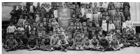
Έλληνικό νηπιαγωγείο στό Ουσάκ της Μ. Ασίας, 1921

κόλυψη της παιδείας· τό περιεχόμενο της εκπαίδευσης δεν πρέπει να διαφεύγει της προσοχής αυτών που έχουν τά ήνια για τή διακυβέρνηση ενός τέτοιου κοινωνικού συνόλου ( Πολιτικά 1137a33-35). Ο φιλόσοφος περιγράφει μιā κατάσταση διαχρονική, ή όποια προκαλεί συζητήσεις ακόμη και σήμερα: Ποιό περιεχόμενο πρέπει να έχει ή παιδεία των νέων ( Πολιτικά 1137a33-35); Υπάρχει διάσταση απόψεων, σημειώνει ο ίδιος, όσον αφορά τή βαρύτητα που πρέπει να δοθεί στή διάνοια ή τό ήθος, αλλά αναφέρεται στα «χρήσιμα», τά όποια διδάσκονταν παραδοσιακά στίς έλληνικές κοινωνίες ( Πολιτικά 1337b4 κ.ε.), τονίζοντας στό τέλος ότι πρέπει να δοθεί προσοχή στίς «ελεύθερες» και «άνελευθερες» ασχολίες, οι όποιες θά συμβάλουν στή διαμόρφωση ελεύθερα σκεπτόμενων πολιτών. Για τόν Αριστοτέλη, ήθικη άρετή είναι στήν πραγματικότητα πολιτική άρετή και δεν ίσχυε ή διάκριση μεταξύ των δύο· με τά ίδια μέσα και για τόν ίδιο σκοπό ήταν κάποιος άγαθός άνήρ ή τό αντίθετό του, και άγαθός πολίτης ή μή. Για κανέναν άλλο λόγο δεν ήθελε ο άρχαίος Έλληνας τή σωφροσύνη, τή άνδρεία, τή πραότητα, τή δικαιοσύνη, τή φιλία, παρά για να μπορεί να λειτουργεί σωστά μέσα στό πλαίσιο της πόλης του. Τοιουτοτρόπως, ο χειρότερος χαρακτηρισμός που μπορούσε να αποδοθεί στόν άρχαίο Έλληνα ήταν ότι άποτελοϋσε άνάξιο πολίτη.