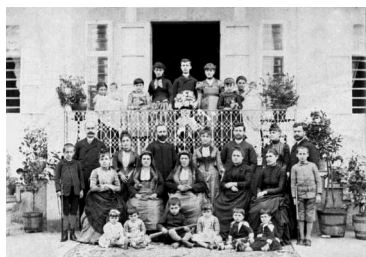
Ἑλληνικὴ οἰκογένεια στὴν Τραπεζοῦντα, ἀρχές 20οῦ αἰ.

Ζοῦμε στὴν ἐποχὴ τῆς μετανεωτερικότητας, ὅπου ὅλα εἶναι ρευστά, ἀδιαφοροποιήτα, συγχωνευμένα, παγκοσμιοποιημένα, ἀσαφῆ, χωρὶς τὴν ἔννοια τῆς διάκρισης, πού δέν διαχωρίζει γιὰ νά διαιρέσει, ἀλλὰ γιὰ νά ἐνώσει. Στὸ πεδίο αὐτὸ ἀντιλαμβάνεται κανεὶς τί προσφέρει ἡ Ἐκκλησία, ὅταν, διὰ τοῦ τριπλοῦ μυστηρίου τοῦ Βαπτίσματος, Χρίσματος καὶ Θείας Ευχαριστίας, μᾶς ἐγκεντρίζει διὰ τοῦ Υἱοῦ ἐν Ἁγίῳ Πνεύματι στή λειτουργία τοῦ Πατρός. Διὰ τῆς εἰσόδου του στὴν Ἐκκλησία, ὁ ἀνθρώπος ἀποκτᾶ ἕναν ἄλλο Πατέρα καὶ μιὰν ἄλλη Μητέρα, πέραν τῶν βιολογικῶν – μιὰ ἄλλη οἰκογένεια, εὐρύτερη, ὅπου κανεὶς δέν μπορεῖ νά παραπνεθεῖ ὅτι εἶναι μοναχοπαίδι. Γιὰ τὴν Ὁρθόδοξη Θεολογία, μόνον ἔτσι ἀνακαινίζονται οὐσιαστικά οἱ ἀνθρώπινες σχέσεις ἀπὸ τὸ ἐδῶ καὶ τώρα ἐν ἀναμονῇ τῆς ὀλοκλήρωσης τῶν ἐσχάτων, καὶ ἀνακόπτεται ἡ τάση τῆς ἰσοπέδωσης καὶ τῆς συγχώνευσης, πού ἰσοδυναμεῖ μέ θάνατο.