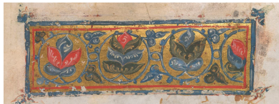
Ἡ κεφαλίδα στό Κατὰ Μάρκον, χφ. Τετραβάγγελο (Ανατ. Μεσόγειος, πιθ. Κωνσταντινούπολη, 1285)

Ὁ ἀγώνας γιά τήν ἀληθινή πνευματι- κή ἐλευθερία δέν εἶναι κάποιου διαστή- ματος τῆς ζωῆς μας. Καί δέν σχετίζεται μέ τά δικά μας (ἁμαρτωλά, ὡς ἐπί τό πλεῖστον) θέλω καί τό ἔτσι μ' ἀρέσει. Ἡ ἐλευθερία μας κερδίζεται ἢ χάνεται τήν κάθε στιγμή στόν βαθμό πού πορευ- όμαστε μέ κριτήριο τό πνευματικό μας συμφέρον — τήν ὑπακοή μας στό θέλη- μα τοῦ Θεοῦ. Τό «γεννηθῆτω τὸ θέλημά Σου» συνιστᾷ τόν ἀέρα πού ἀναπνέουν τά τέκνα τοῦ Θεοῦ, γι' αὐτό καί τελικῶς «βλέπουν» τόν Χριστό νά γίνεται ὁ δικός τους ὑπήκοος. Σ' αὐτόν τόν ἀέρα ἐλευ- θερίας μᾶς καθοδηγεῖ βῆμα-βῆμα ἡ Ἐκ- κλησία μας πάντοτε, κατεξοχήν ὁμως τήν περίοδο τῆς ἀγίας Σαρακοστῆς.