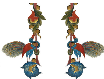
Μικρογραφία ἀπό χρ. μέ τὰ βιβλία τῶν Προφητῶν, (Ἰταλία, 14 ος αἰ.)