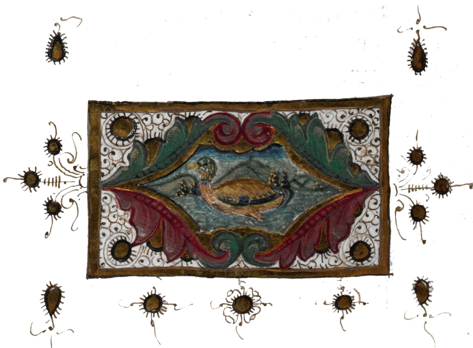
Μικρογραφία ἀπὸ χφ. Βίβλο (Ἰταλία, 1448 ἢ 1498)

Τέλος, στὴν εὐχὴ τῆς Ἀναφορᾶς τῆς θ. Λειτουργίας τοῦ Μ. Βασιλείου τὴν Παῦλεια αὐτὴ διδασκαλία ἀπηχεῖ ἡ φράση «... τοῦ Κυρίου ἡμῶν Ἰησοῦ Χριστοῦ, τοῦ μεγάλου Θεοῦ καὶ Σωτῆρος, τῆς ἐλπίδος ἡμῶν. Ὃς ἐστὶν εἰκὼν τῆς σῆς ἀγαθότητος, σφραγὶς ἰσότυπος, ἐν ἑαυτῷ δεικνὺς Σὲ τὸν Πατέρα, Λόγος ζῶν, Θεὸς ἀληθινός, ἡ πρὸ αἰῶνων σοφία, ζωὴ, ἁγιασμός, δύναμις, τὸ φῶς τὸ ἀληθινόν, παρ' οὗ τὸ Πνεῦμα τὸ Ἅγιον ἐξεφάνη» καὶ παρακάτω «... ὃς ὢν ἀπαύγασμα τῆς δόξης σου καὶ χαρακτὴρ τῆς ὑποστάσεώς σου».