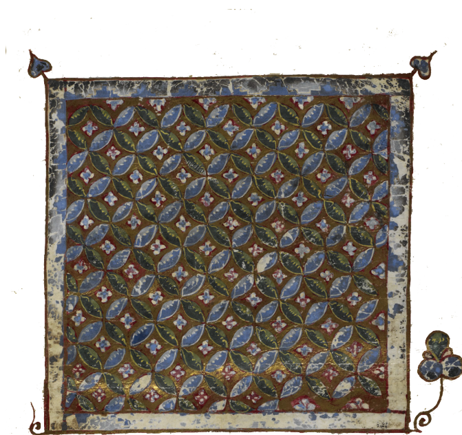
Μικρογραφία ἀπό χφ. Τετραβάγγελο (Κύπρος ἢ Παλαιστίνη, 12 ος αἰ.) (Βρετανική Βιβλιοθήκη, Λονδίνο)