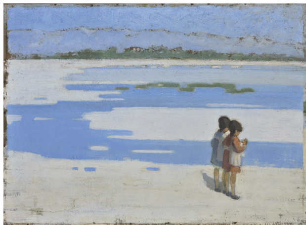
Θεόφραστος Τριανταφυλλίδης, Δύο παιδιὰ στὴν παραλία (1919) Ἀθήνα, Ἐθνικὴ Πινακοθήκη

ΣΗΜΕΙΩΣΕΙΣ. 1. Μάρκου Εὐγενικοῦ, Ἐξήγησις τῆς ἐκκλησιαστικῆς ἀκολουθίας , PG 160:1168A. 2. Συμεῶν Θεσσαλονίκης, Διάλογος , PG 155:910B. 3. Ἰωάννης Μ. Φουντούλης, Λειτουργική , τχ. Ε', σ. 82. 4. Συμεῶν Θεσσαλονίκης, ὁ.π. , PG 155:549D-552A. 5. Συμεῶν Θεσσαλονίκης, ὁ.π. , PG 155:557A. 6. Μάρκου τοῦ Εὐγενικοῦ, ὁ.π. , PG 160:1168A. 7. Μάρκου τοῦ Εὐγενικοῦ, ὁ.π. , PG 160:1168A. 8. Συμεῶν Θεσσαλονίκης, ὁ.π. , PG 155:552A. 9. Βλ. καί Ἰ. Μ. Φουντούλης, ὁ.π. , σ. 80. 10. Βλ. καί Ἰ. Μ. Φουντούλης, ὁ.π. , σ. 213. 11. Συμεῶν Θεσσαλονίκης, ὁ.π. , PG 155:557D. 12. PG 160:1172D. 13. Συμεῶν Θεσσαλονίκης, ὁ.π. , PG 155:560B. 14. Συμεῶν Θεσσαλονίκης, ὁ.π. , PG 155:560C. 15. Μάρκου τοῦ Εὐγενικοῦ, ὁ.π. , PG 160:1176A. 16. Μάρκου τοῦ Εὐγενικοῦ, ὁ.π. , PG 160:1173C. 17. Συμεῶν Θεσσαλονίκης, ὁ.π. , PG 155:561B. 18. Μάρκου τοῦ Εὐγενικοῦ, ὁ.π. , PG 160:1176B. 19. Ἰ. Μ. Φουντούλης, ὁ.π. , σ. 89-90. 20. Μάρκου τοῦ Εὐγενικοῦ, ὁ.π. , PG 155:1176. Βλ. Ἰ. Μ. Φουντούλης, ὁ.π. , σ. 91.