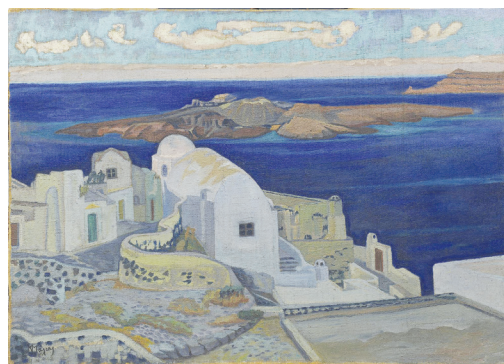
Κων. Μαλέας, Σαντορίνη (1924-1928) Άθήνα, Έθνική Πινακοθήκη