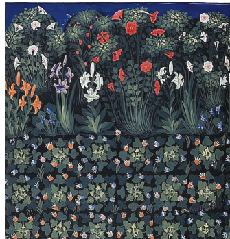
Pacino di Buonaguida, Κῆπος, μικρογραφία ἀπό χφ. τοῦ 14ου αἰ., British Library, Λονδῖνο

Ἀδελφοί, οἱ ἐκτός Ἐκκλησίας ἄνθρωποι εἶναι ὑποψήφιοι Ἅγιοι! Τό εἶδαμε πολλές φορές νά συμβαίνει στήν ἱστορία. Ἄς τοὺς διευκολύνουμε σέ αὐτό καί ἄς συνεργασθοῦμε μέ τόν Θεό γιά νά πετύχει τό σχέδιό Του!