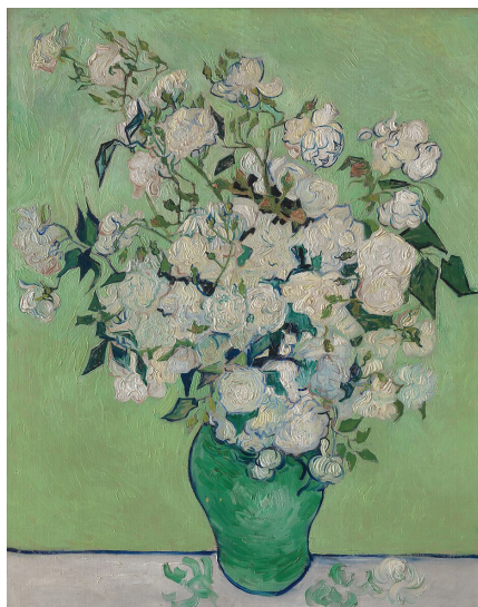
Άριστερά: Édouard Manet, Λευκές πασσαλιές σε βάζο , Alte Nationalgalerie, Βερολίνο Δεξιά: Vincent van Gogh, Ρόδα σε βάζο (1890), Metropolitan Museum of Art, Νέα Υόρκη, Η.Π.Α.