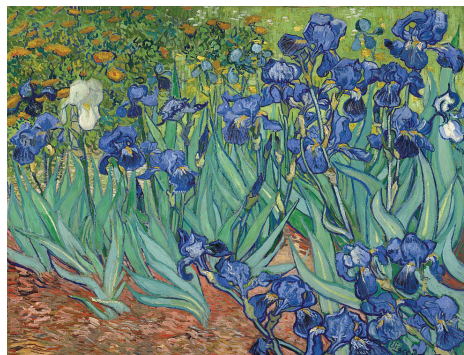
Vincent van Gogh, "Ἴριδες (1889), Getty Museum, Λὸς Ἄντζελες, Η.Π.Α.

Πρόκειται γιὰ μιά ἀπόλυτη ψυχοσωματικοαισθητικὴ κοινωνία ἀνθρώπου καὶ Θεοῦ. Αὐτὸ εἶναι τὸ θαῦμα τῆς ἐνσάρκωσης. Δὲν πρόκειται δηλαδὴ γιὰ μιά ἀλλαγὴ στά ἤθη, στὸν χαρακτήρα, ἀλλὰ γιὰ μιά μεταβολὴ τοῦ εἶναι μου, συγκλονιστικὴ, ὅπου μαθαίνω νὰ ὁσφραίνομαι, νὰ μυρίζω, νὰ ἀγγίζω, νὰ ἀκουμπῶ, νὰ θυμώνω, νὰ μιλῶ, νὰ ἐρωτεύομαι, νὰ γνωρίζω, νὰ λαλῶ, «ἐν τῷ Θεῷ». Αὐτὸ ἀποτελεῖ μεγάλο “σκάνδαλο” γιὰ κάθε φιλοσοφία τοῦ ὑποκειμένου. Διότι ἢ οὐσία τοῦ ὑποκειμένου αὐτοῦ δὲν βρίσκεται πουθενά, οὔτε στὴν ψυχὴ, οὔτε στὸν νοῦ, οὔτε στὸν λόγο, οὔτε στὴν αἴσθηση, ἀλλὰ στό “Ἐν ὅλων αὐτῶν, στό μυστήριον δηλαδὴ τῆς καθολικῆς ἐνοείδειάς του, τὸ ὁποῖο συμβαίνει ἐν Θεῷ καὶ μᾶς παρὰ πέμπει εὐθέως στά ἔσχατα. Κι ἔτσι κατένας μονοφυσιτισμός, ὄντολογικὸς ἢ λειτουργικὸς, δὲν μπορεῖ νὰ δικαιολογηθεῖ.