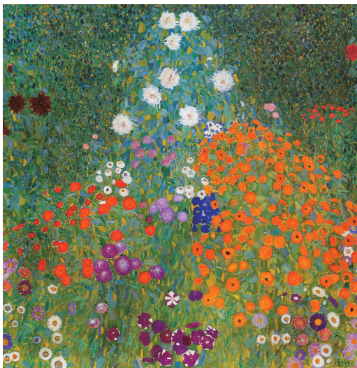
Gustav Klimt, Ανθόκηπος (μεταξὺ 1905-1907)