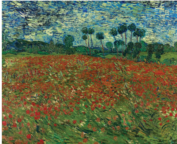
Vincent van Gogh, Λιβάδι μέ παπαροῦνες (1890), Μουσεῖο Van Gogh, Ἀμστερνταμ

Ὅπως γράφει καί ὁ μακαριστός καθ. Β. Τατάκης: «Γενικά ὁ μυστικισμός, στίς καλύτερες του στιγμές, δέν ἀρνεῖται τή γνώση, τή θύραθεν σοφία. Ἐκεῖνο πού ἀρνεῖται εἶναι ὅτι ἡ γνώση αὐτή ὀδηγεῖ στίς ρίζες, στή θεωρία καί στή θέωση τοῦ ἀνθρώπου. Γιά τοῦτο τό μεγάλο ἐγχείρημα ἐπιστρατεύει ὁλόκληρο τόν ἀνθρώπο, συναιρεῖ τίς ἀντινομίες καί, μέ τόν ἡσυχασμό, δίνει τά πρωτεῖα στήν καρδιά. Ὁ νοῦς, μόνο ἂν βαφτιστεῖ στήν καρδιά βρίσκει τόν ἑαυτό του».