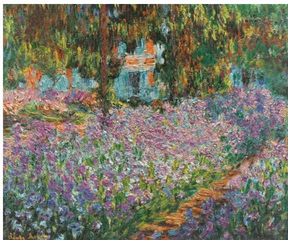
Claude Monet, Ὁ κήπος τοῦ καλλιτέχνη στό Ζιβερνί (1900), Musée d'Orsay, Παρίσι

ΣΗΜΕΙΩΣΕΙΣ. 1. Μωσῆς μοναχός, Ἀγιορείτης, «Ἡ θεολογία τῆς γριόνας», Σύναξη 85 (2003) 73-74 2. Ἰ. Φουντούλης, «Ἡ Θεία Λειτουργία – Τελετουργική Θεώρηση», Ἡ Θ. Λειτουργία , ὅ.π., σ. 147-148. 3. Ἰ. Φουντούλης, «Ἡ Λειτουργική Ἀνανέωση στήν Ὁρθόδοξο Ἐκκλησία. Δυνατότητες καί Ἐμπόδια», στόν τόμο Τελετουργικά Θέματα Β' , Ἀθήνα 2006, σ. 47-48. 4. Ἰ. Φουντούλης, «Τελετουργική προσέγγιση τῆς Θ. Λειτουργίας», στόν τόμο Τό Μυστήριο τῆς Θ. Εὐχαριστίας , Πρακτικά Γ' Πανελληνίου Λειτουργικοῦ Συμποσίου, Ἀθήνα 2004, σ. 172.