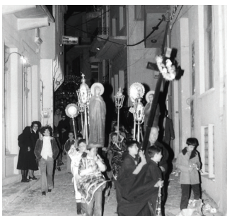
Στιγμιότυπα από τήν περιφορά του Έπιταφίου στό Πλωμάρι της Λέσβου τό 1980