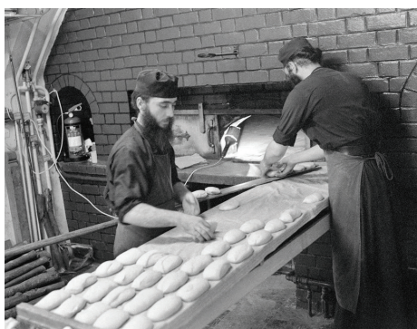
Μοναχοί στό Ἅγιον Ὅρος φουρνίζουν ψωμί