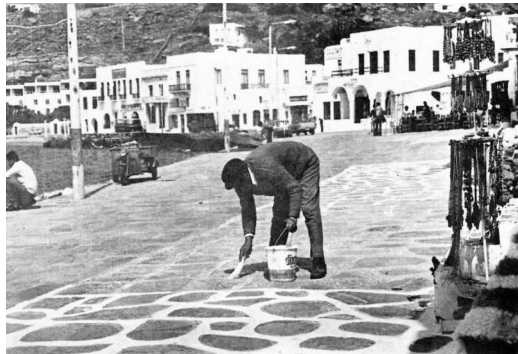
Ἀσβεστῶνοντας τὰ καλντερίμια τῆς Μυκόνου γιὰ τὸ Πάσχα Ἐπάνω δεξιά: Πασχαλινὰ ἀσβεστῶματα σὲ χωριὸ τῆς Κρήτης τὸ 1964