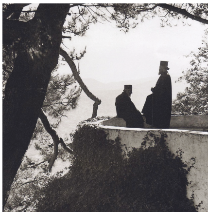
Ἡμέρες Σαρακοστής στόν Ὅσιο Μελέτιο Ἀττικῆς τό 1950 (φωτ. Βούλα Παπαϊωάννου, ἀριστερά) καί στήν Ἱερά Μονή Βροντησίου στό Ἡράκλειο Κρήτης τό 1939 (φωτ. NELLY'S, δεξιά)