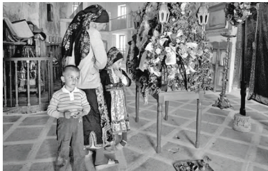
Ὁ Ἐπιτάφιος στήν Ὀλυμπο τῆς Καρπάθου, 1981 (φωτ. Hector Christiaen)

ΣΗΜΕΙΩΣΕΙΣ. 1. Ὁ καθεδρικός ναός τοῦ Canterbury ἰδρύθηκε ἀπό τόν ἅγ. Αὐγουστῖνο τό 602, ὁ ὁποῖος τόν ἀφιέρωσε στόν Σωτήρα Χριστό. Οἱ ἀρχαιολογικές ἐρευνες κάτω ἀπό τό δάπεδο τό 1993 ἀποκάλυψαν τά θεμέλια τοῦ ἀρχικοῦ σαξονικοῦ καθεδρικοῦ ναοῦ, ὁ ὁποῖος ἦταν χτισμένος κατά μήκος μίας πρώην ρωμαϊκῆς ὁδοῦ. Ὁ Αὐγουστῖνος ἵδρυσε ἐπίσης τό μοναστήρι τῶν ἁγ. Πέτρου καί Παύλου ἔξω ἀπό τά τείχη τῆς πόλεως, τό ὁποῖο ἀργότερα ἀφιερώθηκε στόν ἅγ. Αὐγουστῖνο, ὅπου γιά αἰῶνες ἦταν ὁ τόπος ταφῆς τῶν βασιλέων τοῦ Kent καί τῶν ἀρχιεπισκόπων τοῦ Canterbury, στό ὁποῖο ἀναφέρεται ὁ Βέδας· βλ. R. Willis, The architectural history of Canterbury Cathedral , London 1845, ἐπανέκδ. Richmond 2006, σ. 1-22· N. Brooks, The Early History of the Church of Canterbury: Christ Church from 597 to 1066 , London 1984, σ. 15-71· P. Collinson, N. Ramsay, M. Sparks (ἐπιμ.), A History of Canterbury Cathedral , Oxford 1995, ἀναθ. ἔκδ. 2002. Μνημειώδης εἶναι ἡ μιμητική τάση τῶν ἐκκλησιαστικῶν κατασκευῶν, ναῶν ἀλλά καί ὀνομασιῶν, τῆς Ρώμης στόν πρώιμο Ἀγγλο-σαξονικό κόσμο· βλ. J. Moorhead, "Bede on the Papacy", Journal of Ecclesiastical History 60 (2009), 217-232, ἐδῶ σ. 217, σημ. 1. 2. Βλ. D. Farmer, "Theodore of Tarsus", στό The Oxford Dictionary of Saints , Oxford 2004, σ. 496-497. 3. Βέδας, Ἐκκλησιαστική Ἱστορία , V. 8. Βλ. Brooks, The Early History of the Church of Canterbury , ὅ.π., σ. 76- 80. 4. Ἐκκλησιαστική Ἱστορία , V. 8. 5. Βλ. Lapidge, "Theodore of Tarsus", ὅ.π., σ. 228-229.