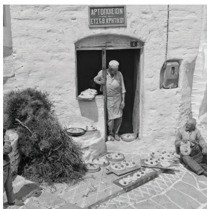
Πασχαλινές προετοιμασίες: τά λαμπροκούλουρα, Πάρος 1970