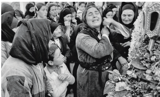
Ὁ Ἐπιτάφιος στήν Ὀλυμπό τῆς Καρπάθου, 1981

Αὐτή ἡ περίοδος εἶναι πού θά προετοιμάσει τό ἔδαφος γιά τίς φυσικῆς ἐπιστήμες τῶν νέων χρόνων καί γιά τή θρησκευτικότητα τῆς Μεταρρύθμισης.