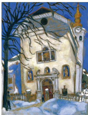
Marc Chagall Ἀριστερά: Χιονισμένη ἐκκλησιά (περ. 1927), Detroit Institute of Art, Ντητρόιτ (Η.Π.Α.) Δεξιά: Χειμῶνας σ' ἕνα χωριό (1930)