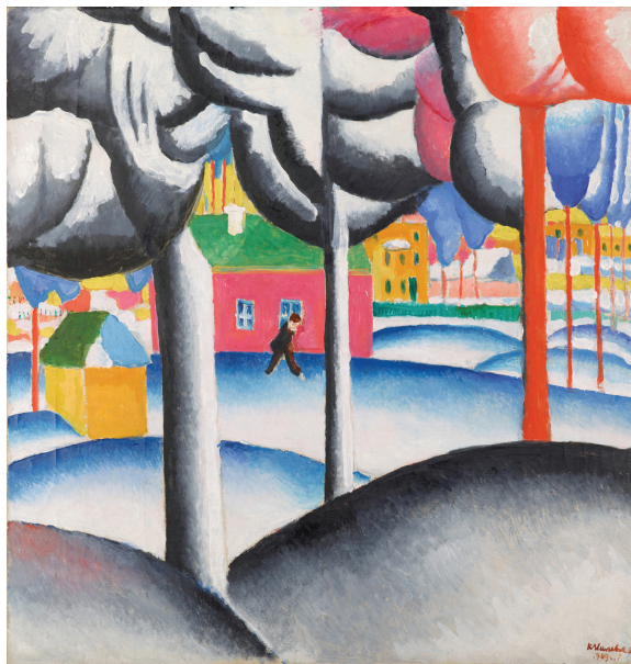
Kazimir Malevich, Χειμερινό τοπίο, (1930), Museum Ludwig, Κολονία