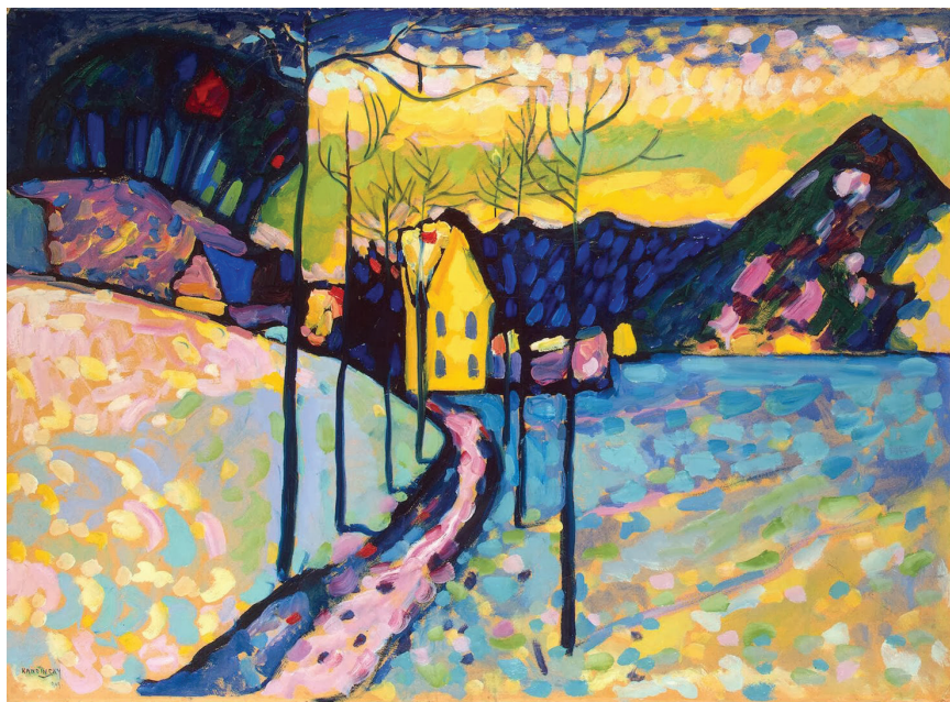
Wassily Kandinsky, Χειμωνιάτικο τοπίο στή Βαυαρία (1909) Μουσεῖο Ἐρμιτάζ, Ἁγία Πετρούπολη (Ρωσία)