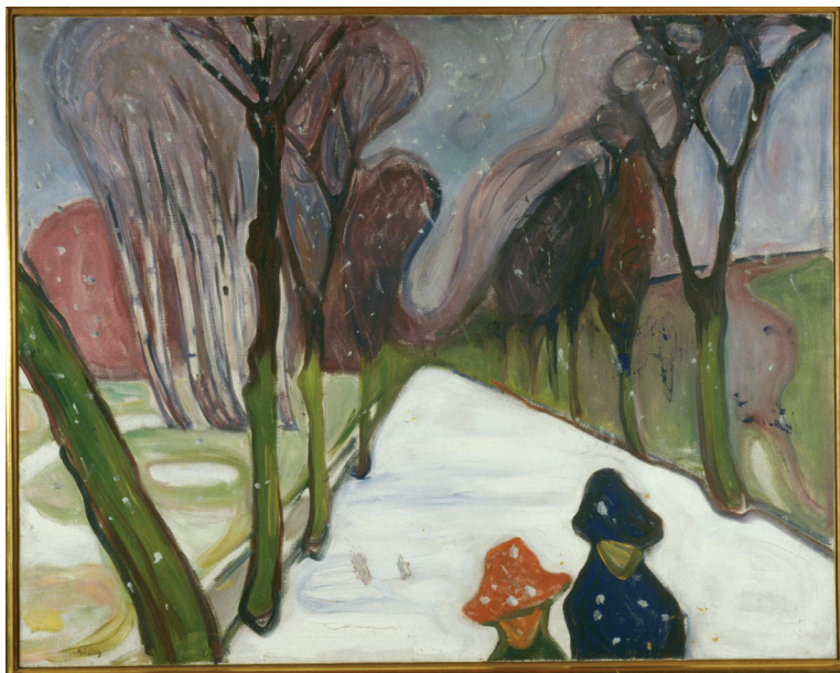
Edvard Munch, Χιόνι στόν δρόμο (1906) Munchmuseet, Ὁσλο (Νορβηγία)