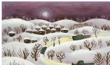
Radi Nedelchev, Χειμωνιάτικη νύχτα (1971), λεπτομέρεια, ιδιωτική συλλογή

Έλπίζουμε ότι οι αδελφοί μας κληρικοί τής Ελλάδος θα εκτιμήσουν τίς προσπάθειες του συλλογικού τους όργάνου και θα στηρίξουν μέ τήν έγγραφή τους και τή συνδρομή τους τόν Έερό Σύνδεσμο Κληρικών Ελλάδος. Όλοι οι Κληρικοί τής Κρήτης είναι έγγεγραμμένοι στο ανάλογο συλλογικό όργανο των Κληρικών τής Κρήτης. Γιατί αυτό νά μή συμβαίνει και μέ τόν Σύνδεσμο Κληρικών Ελλάδος; Είναι ένα έρώτημα που μάς άπασχολεί έντονα, σε μία χρονική στιγμή που τό παρόν Δ.Σ. του Ι.Σ.Κ.Ε. έχει άποκαταστήσει τίς σχέσεις του τόσο μέ τήν Έερά Σύνοδο όσο και μέ τούς Σεβασμιωτάτους Μητροπολίτες τής Έκκλησίας τής Ελλάδος, πολλοί εκ των όποιων είναι πλέον επίτιμα μέλη του Έερού Συνδέσμου.