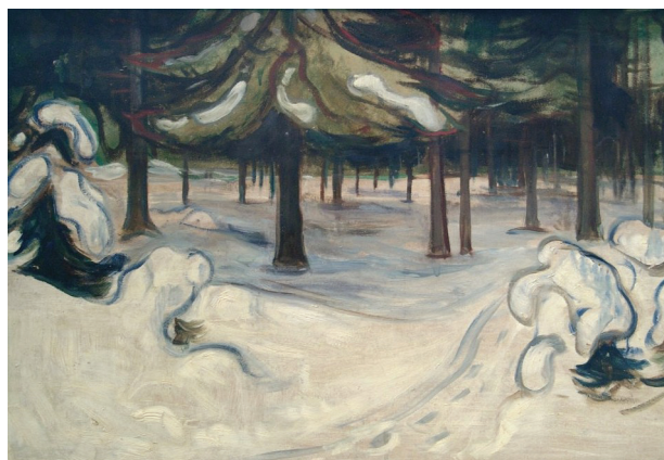
Edvard Munch, Χειμῶνας στό δάσος (1899), Ἐθνικό Μουσεῖο Ὁσλο (Νορβηγία)

ΣΗΜΕΙΩΣΕΙΣ. 1. PG 155:225C. 2. Π. Εὐδοκίμωφ, Ἡ Προσευχὴ τῆς Ἀνατολικῆς Ἐκκλησίας , Ἀθήνα: Ἀποστολική Διακονία 1982, σ. 166. 3. Ἱ. Φουντούλης, Λειτουργική Α'. Εἰσαγωγή στή Θεία Λατρεία , ὁ.π., σ. 224. 4. Αὐτ., σ. 222-223. 5. Βλ. Γ. Φίλιας, Παράδοση καί Ἐξέλιξις στή Λατρεία τῆς Ἐκκλησίας , ὁ.π., σ. 287, 288. 6. Αὐτ., σ. 223-224. 7. Ἱ. Ζηζιούλας, «Συμβολισμός καί Ρεαλισμός στήν Ὁρθόδοξη Λατρεία», Σύναξις 71 (1999) 7-21.