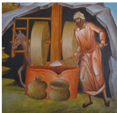
Έπάνω: Μοναχός ράφτης Άριστερά επάνω: Μοναχός μαραγκός Άριστερά κάτω: Μοναχός μωλωνάς