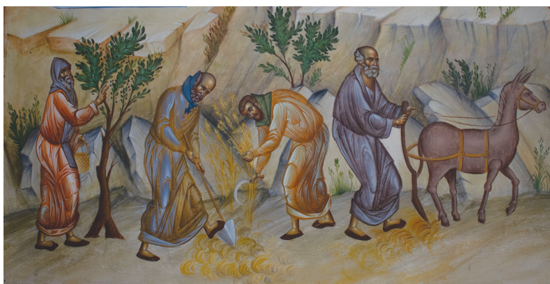
Μοναχοί σέ ἀγροτικές ἐργασίες

ΣΗΜΕΙΩΣΕΙΣ. 1. Ἡ φράση εἶναι τοῦ ἀειμνήστου καθηγητοῦ Ν. Ματσούκα, «Θεολογική θεώρηση τῶν σκοπῶν τοῦ θρησκευτικοῦ μαθήματος», Κοινωνία 3 (1981) 311-312. 2. Ν. Ματσούκας, «Ἐκκλησία καί Βασιλεία τοῦ Θεοῦ, Ἱστορία καί Ἐσχατολογία», στόν συλλογικό τόμο Ἐκκλησία καί Ἐσχατολογία , Ἀθήνα 2003, σ. 62. 3. Μητρ. Περγάμου Ἰωάννης, «Ἐκκλησία καί Ἐσχατα», στόν συλλογικό τόμο Ἐκκλησία καί Ἐσχατολογία , ὁ.π., σ. 31. 4. Χ. Γιανναράς, Τό κενό στήν τρέχουσα πολιτική. Κριτικές παρεμβάσεις στή Νεοελληνική Ἀλλοτρίωση , Ἀθήνα 1989, σ. 210. 5. Μητρ. Περγάμου Ἰωάννης, «Συμβολισμός καί Ρεαλισμός στήν Ὁρθόδοξη Λατρεία», ὁ.π., σ. 20 (ἐπισήμανση δική μας). 6. Εὐχαριστία , ὁ.π., σ. 87. 7. Ἰ. Φουντούλης, Λειτουργική Α΄. Εἰσαγωγή στή Θεία Λατρεία , ὁ.π., σ. 227. 8. Αὐτ. , σ. 228-229 (ἐπισήμανση δική μας). 9. Ἰ. Φουντούλης, Ἀπαντήσεις εἰς Λειτουργικάς Ἀπορίας, Α΄ , ὁ.π., σ. 142. 10. Λειτουργική Α΄ , ὁ.π., σ. 229. 11. Ἰ. Φουντούλης, «Ἡ Θεία Λειτουργία – τελετουργική θεώρηση», στό Ἡ Θ. Λειτουργία , ὁ.π., σ. 163. 12. Π.Ν. Τρεμπέλας, Αἱ τρεῖς Λειτουργίαί κατά τούς ἐν Ἀθήναις Κώδικας , Ἀθήνα 1982, σ. 61. 13. Κοσμᾶ τοῦ Αἰτωλοῦ, Διδαχές , ἔκδ. Ι.Β. Μενοῦνου, Ἀθήνα χ.χ., σ. 216.