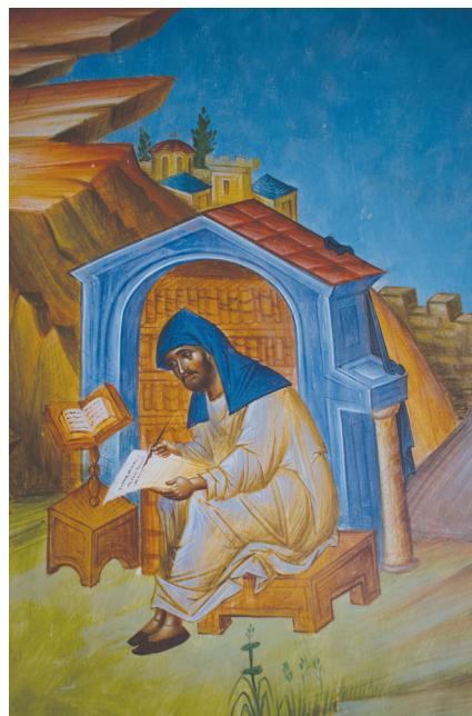
Ἀριστερά: Μοναχός ἀγιογράφος. Δεξιά: Μοναχός γραμματικός.