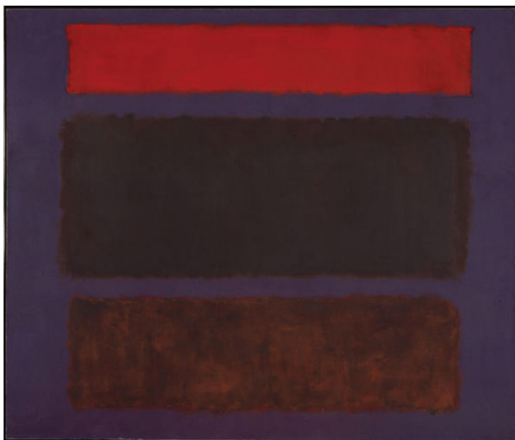
Νο 16 (1950), Μητροπολιτικό Μουσείο Νέας Υόρκης, Η.Π.Α.