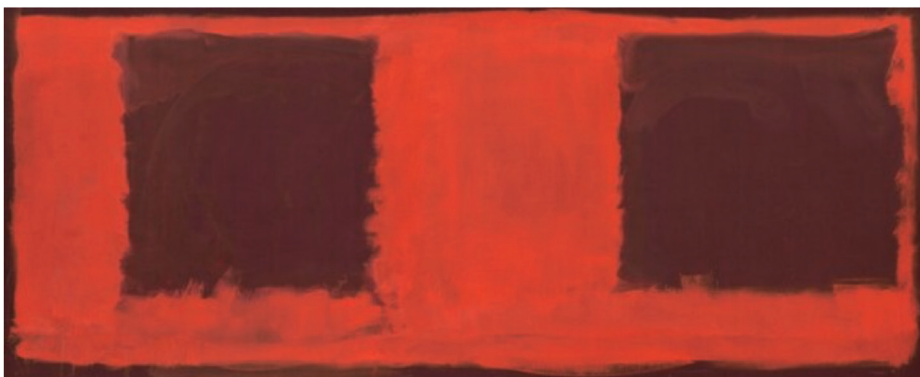
Ἄτιτλο (1959), Ἐθνική Πινακοθήκη, Οὐάσιγκτον, Η.Π.Α.