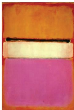
Λευκό Κέντρο (1950), ιδιωτική συλλογή