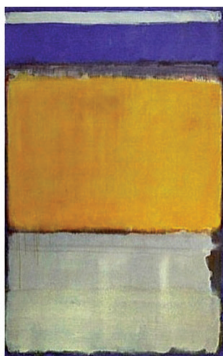
Νο 10 (1950), Μουσείο Μοντέρνας Τέχνης Νέας Υόρκης, Η.Π.Α.

Ἀναλόγιο (ἢ Ἀναλογεῖον). Ὁ χώρος, ἀλλά καί τό ἐπιπλο τοῦ Ναοῦ, ὅπου στέκονται οἱ ψάλτες (δεξιά κι ἀριστερά) κοντά στό τέμπλο καί πάνω στόν Σολέα. Παλαιότερα οἱ ψάλτες ἔψαλλαν πάνω στόν Ἄμβωνα «ἀπό διφθέρας». Το Ἀναλόγιο ὡς ἐπιπλο, στό ὅποιο στηρίζονται ἢ καί φυλάσσονται τά λειτουργικά βιβλία, συνυπῆρχε μέ τόν Ἄμβωνα (ἐκ τοῦ ἀναβαίνω. Λέγεται καί «βῆμα τοῦ ἄμβωνος» καί ὀκρίβας).