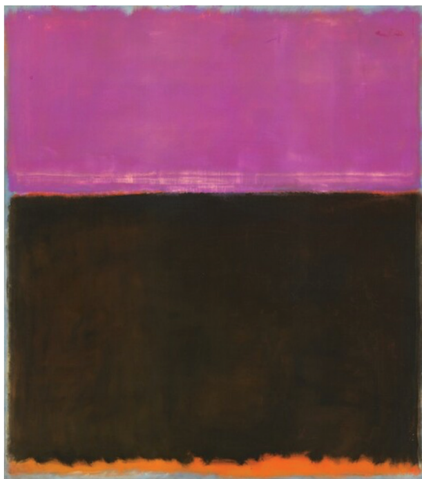
Άτιτλο (1953) Έθνική Πινακοθήκη Ουάσινγκτον, Η.Π.Α.

Σύνδεσμος. Μηνιαίο Περιοδικό Έλληνορθόδοξης Μαρτυρίας. Έκδ. τής Χριστιανικής Στέγης Καλαμάτας, έτος 58ο, 2024.