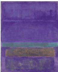
Ἄτιτλο (1952). Ἐθνική Πινακοθήκη. Οὐάσινγκτον, Η.Π.Α.

Ὅταν ὁ ἅγιος Νεκτᾶριος ταξίδευε μέ πλοῖο στους Ἁγίους Τόπους ἔπιασε μεγάλη τρικυμία καί τότε ὁ ἅγιος ἔριξε στό φουρτουνιασμένο πέλαγος τό σταυρουδάκι πού τοῦ εἶχε δώσει ἡ γιαγιά του καί ἡ τρικυμία κόπασε. Ἀλλά ὁ Ἅγιος ἦταν θλιμμένος ἐπειδή τό φυλακτό του χάθηκε. Ὅταν τό πλοῖο ἀγκυροβόλησε, ὁ καπετάνιος προσπάθησε νά δεῖ ἀπό πού προέρχονταν τά χτυπήματα πού ἀκούγονταν στά ὕφαλα τοῦ πλοίου. Μέ ἐκπληξή τότε διαπίστωσε ὅτι ἦταν κολημένο, σ' ἐκεῖνο τό σημεῖο, τό σταυρουδάκι τοῦ ἁγίου Νεκταρίου τό ὁποῖο καί τοῦ τό παρέδωσε. Αὐτή εἶναι ἡ δύναμη τῆς ἀγιότητος, αὐτή εἶναι ἡ δύναμη τοῦ Τιμίου καί Ζωοποιοῦ Σταυροῦ.