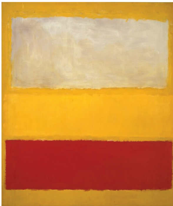
Νο 13 (1958), Μητροπολιτικό Μουσείο Νέας Υόρκης, Η.Π.Α.

3. Μητροπολίτες ἄλλου κλίματος πού λειτουργοῦν στήν Ἑλλάδα (ἐφ' ὅσον ὁ Ἀθηνῶν δέν θεωρεῖται κατά πάντα ὡς «Πρώτος» οὔτε ἀνώτερος ἀπό αὐτούς κατά τήν ἱεραρχική τάξη) μνημονεύουν τόν δικό τους Πατριάρχη, δηλ. κατά τήν προσωπική τους ἀναφορά καί ἐξάρτη- ση, ὡς ἰσοβάθμιοι μέ τήν ἐκκλησιαστική ἀρχή τοῦ τόπου, καί μέ τόν Ἀρχιεπίσκο- πο καί μέ τούς κατά τόπον μητροπο- λίτες. Ἐνδεικτικῶς σημειώνουμε ἐδῶ ὅτι οἱ μητροπολίτες τῆς Κύπρου, ὅταν λειτουργοῦν στήν Ἀθήνα, μνημονεύουν κανονικά τῶν Ἀρχιεπίσκοπο Ἀθηνῶν, συνηθισμένοι στή μνημόνευση τοῦ δικοῦ τους Ἀρχιεπισκόπου στήν Κύπρο.