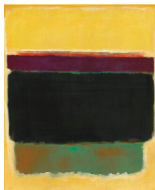
Ἄτιτλο (1949) Ἐθνική Πινακοθήκη, Οὐάσιγκτον, Η.Π.Α.

Κλείνουμε τό παρόν ἀφιέρωμα μέ μιά δική του εὐχή, ὅπως αὐτός τήν ἔγραψε σέ δημοσίευσμά του ἀναφορικά μέ τό κατηχητικό ἔργο: «Διά τοῦτο εὐχομαι ὡς ἐλάχιστος ἐργάτης τῆς ὑψηλῆς ταύτης ἐκκλησιαστικῆς διακονίας, ἡ Ἐκκλησία μας νά ὀργανωθῆ. Εἶναι ἀπαραίτητον ἀλλά καί τό δυνάμενον νά προσδώσῃ τήν ἐμπρέπουσαν θέσιν της ἐν τῇ μεγάλῃ πεπολιτισμένη κοινωνίᾳ τῶν ἰδεῶν καί τῶν νέων κοινωνικῶν ρευμάτων».