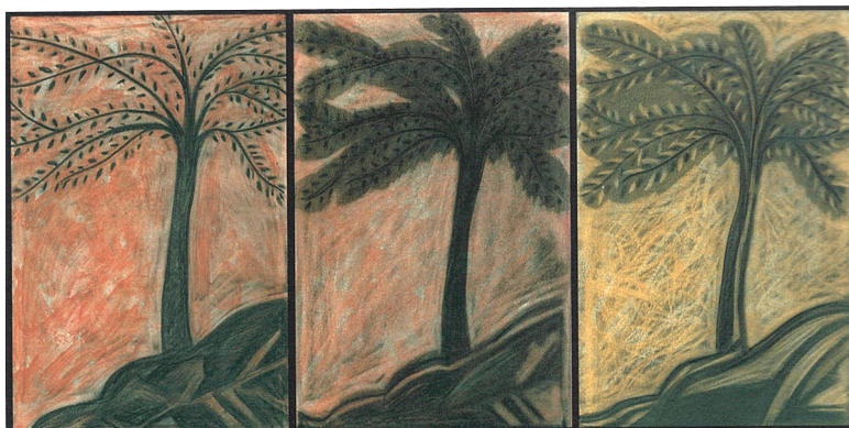
Γέφυρες II (2011)

ΣΗΜΕΙΩΣΕΙΣ. 1. Βλ. Γεώργιος Βιολάκης, Τυπικὸν τῆς τοῦ Χριστοῦ Μεγάλης Ἐκκλησίας , Ἀθήνα / Θεσσαλονίκη: Μιχ. Σαλίβερος χ.χ., σσ. 329-330. πρωτ. Κωνσταντίνος Παπαγιάννης, Σύστημα Τυπικοῦ τῶν ἱερῶν ἀκολουθιῶν τοῦ ὄλου ἐνιαυτοῦ , Ἀθήνα: Ἀποστολικὴ Διακονία 2006, σ. 608. 2. Βλ. Ἰωάννης Μ. Φουντούλης, Λειτουργικὴ , τχ. Ε': Ἀκολουθία τοῦ νυκθημέρου, Θεσσαλονίκη 1969, σ. 30. 3. Γ. Βιολάκης, ὁ.π., σ. 324. 4. Γ. Βιολάκης, ὁ.π., σ. 324. 5. Γεώργιος Ρήγας (Οἰκονόμος), Τυπικὸν [Λειτουργικὰ Βλατάδων 1] , Θεσσαλονίκη 1994, σ. 751. Βλ. καὶ Τυπικὸν τῆς Ἐκκλησιαστικῆς Ἀκολουθίας τῆς ἐν Ἱεροσολύμοις ἀγίας Λαύρας τοῦ ὁσίου καὶ θεοφόρου πατρὸς ἡμῶν Σάββα , ἐπιμ. Ἀρχιμ. Νικόδημος Σκρέττας, Ἱεροσόλυμα 2012, σ. 281. 6. Ἰωάννης Μ. Φουντούλης, ὁ.π., σ. 39. 7. Τυπικὸν τοῦ ὁσίου καὶ θεοφόρου πατρὸς ἡμῶν Σάββα τοῦ ἡγιασμένου , Ἀθήνα: ἐκδ. Ἱερᾶς Σταυροπηγιακῆς Μονῆς Παναγίας Τατάρνης χ.χ., σ. 331. 8. Τυπικὸν τῆς Ἐκκλησιαστικῆς Ἀκολουθίας τῆς ἐν Ἱεροσολύμοις ἀγίας Λαύρας τοῦ ὁσίου καὶ θεοφόρου πατρὸς ἡμῶν Σάββα , ἐπιμ. Ἀρχιμ. Νικόδημος Σκρέττας, ὁ.π., σ. 281.