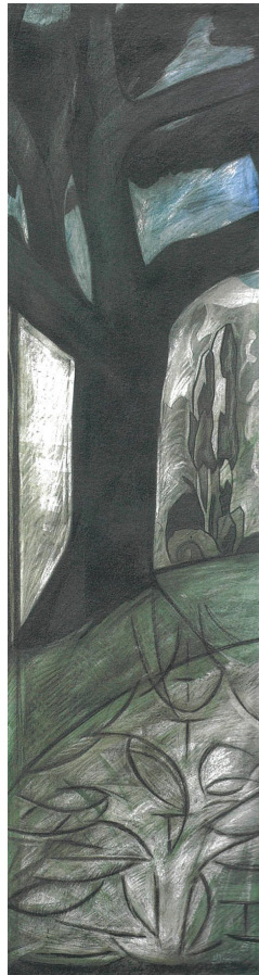
Ἡ στήλη τῶν δέντρων: Ἀναγέννηση (ἀριστερά) Σύγχρονη ἐποχή (2005)