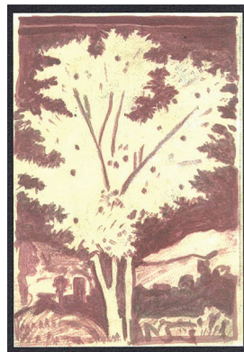
Παραλλαγές σέ δέντρο τοῦ Πουσσέν (2011)

τόν θεόπνευστο λόγο τῆς Ἀποκαλύψεως τοῦ Ἰωάννου. Καί τότε, μᾶς λέει, θά δοῦμε ὅτι ὑποσχέθηκε ὁ Κύριος: τήν ὥρα πού θά θέτουμε αὐτό τό θέλημά Του ὡς βάση τῆς ζωῆς μας, («ἐπὶ τὴν πέτραν τῶν ἐντολῶν Σου στερέωσόν με, Κύριε»), τήν ἴδια ὥρα θά ἐνεργοποιῶνται καί οἱ δυνάμεις Ἐκεῖνου, πρὸς ὑπέρβαση τῶν ὁποίων προβλημάτων μας, ἀφ' ἑνός, πρὸς ἀποκατάσταση καί ὅλης τῆς δημιουργίας, ἀφ' ἑτέρου. Δέν εἶναι τυχαῖο ὅτι ἐδῶ καί ἀρκετά χρόνια, τό Οἰκουμενικό μας Πατριαρχεῖο ἔχει προβάλλει τήν ἀρχή τοῦ ἐκκλησιαστικοῦ ἔτους ὡς ἡμέρα προστασίας τοῦ περιβάλλοντος. Καί εὐλογα: τό θέλημα τοῦ Θεοῦ, ὅπως εἶπαμε, βιούμενο ἀπό τόν «βασιλιᾶ» τῆς κτίσεως, τόν ἄνθρωπο, ἔχει ἄμεση ἀντανάκλαση καί σέ ὅλη τή φύση καί σέ ὅλη τή δημιουργία. Ἐχει κατά κόρον τονιστεῖ: ἡ λύση στή σημερινή οικονομική κρίση, καί κάθε κρίση βεβαίως, θά ἔλθει, μόλις ἀρχίσουμε νά ζοῦμε ὡς πραγματικοὶ ἄνθρωποι, μέ βάση τόν νόμο τοῦ Θεοῦ. Πού θά πει: ἡ κρίση ὅποιασδήποτε διάστασης εἶναι κατ' οὐσίαν πνευματική.