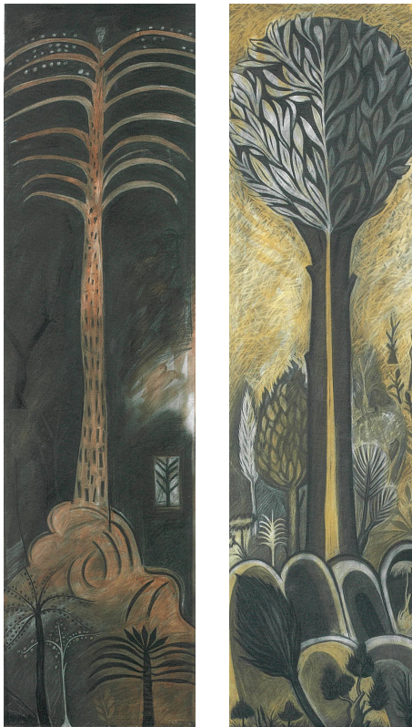
Ἡ στήλη τῶν δέντρων: Αρχαιότητα (ἀριστερά) Βυζάντιο (2005)