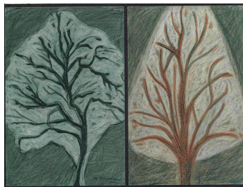
Γέφυρες II (2011)

Στίς πρώιμες πηγές ἀπαντοῦν «στιχη-ρὰ εἰς τὸν ἄμωμον» ἢ «τροπάρια τοῦ ἀμώμου», δηλαδὴ στιχηρά τῶν τελευ-ταίων στίχων τοῦ ψαλμοῦ. Αὐτοῦ τοῦ εἴδους τὰ παλαιὰ στιχηρά βαθμηδὸν ἀποσπάρθηκαν ἀπὸ τὸν ἄμωμο, δέχθη-καν στίχο «Εὐλογητὸς εἶ Κύριε, δίδαξόν με τὰ δικαιώματά σου» καί, συνεκδοχι-κά, ὀνομάστηκαν «εὐλογητάρια».