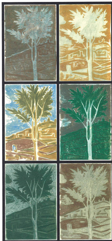
Παραλλαγές σέ δέντρο τοῦ Μαντένια (2011)

ΣΗΜΕΙΩΣΕΙΣ. 1. Ἰ. Ζηζιούλας, «Ὁ συνοδικός θεσμός», Θεολογία , 80/2 (2009) 21, σ. 35. 2. Ἰωάννης Ζηζιούλας, Μητρ. Περγάμου, Ἡ ἐνότης τῆς Ἐκκλησίας , Ἀθήνα 1990, σ. 147. 3. Βλ. ἐνδεικτικά J. Zizioulas, "Apostolic Continuity of the Church and Apostolic Succession in the First Five Centuries", Louvain Studies , 21 (1996) 156. 4. J. Zizioulas, ὁ.π. , σ. 166. 5. Y. Congar, Ministères et Communion ecclésiale , ὁ.π. , σ. 125-126. 6. J.-M. Tillard, Irénikon , 73 (2000) 86.