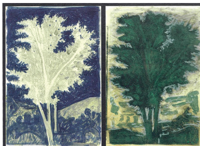
Παραλλαγές σέ δέντρο τοῦ Πουσσέν (2011)

Ἀπό τήν παραπάνω θαυμαστή διήγηση, ἀλλά καί ἀπό ἄλλα θαυμαστά γεγονότα πού συνέβησαν καί συμβαίνουν ἐντός τῆς Ὁρθόδοξης Ἐκκλησίας, ἀποδεικνύεται περίτρανα ὅτι ἡ πίστη πού μᾶς παρέδωσαν οἱ Ἀπόστολοι καί διαφύλαξαν οἱ Πατέρες μας δέν ἀποτελεῖ ἀνθρώπινη ἔμπνευση ἀλλά εἶναι θεοδίδακτη, σέ ἀντίθεση μέ τίς αἰρετικές διδασκαλίες οἱ ὁποῖες εἶναι ἀνθρώπινης ἐμπνεύσεως.