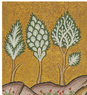
Ἡ δημιουργία τῶν φυτῶν, λεπτομέρεια