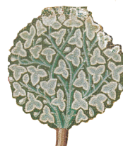
Ἀπομονωμένη λεπτομέρεια ἀπό ψηφιδωτό πού εἰκονίζει τούς πρωτοπλάστους μέ φύλλα συκῆς

Ὅλ' αὐτά ἀπετέλεσαν τή βάση τῆς λαϊκῆς εὐσέβειας πού προβάλλει τίς ἀνάγκες της καί τή δική της κατανόηση τῆς Παναγίας πού θά γίνει μέ τή σειρά της τό θεμέλιο γιά τήν θεολογική διερεύνηση τοῦ μυστηρίου τῆς Θείας Οἰκονομίας ἀπό ἐπισκόπους καί θεολόγους τόν 5 ο αἰῶνα.