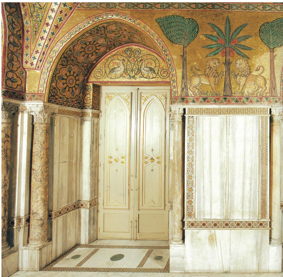
Ἀποψη ἀπὸ τὴν Αἴθουσα τῶν Ψηφιδωτῶν, Palazzo Reale

ΣΗΜΕΙΩΣΕΙΣ. 1. Βλ. Γ. Τσάρας, «Τὸ νόημα τοῦ γραικώσας στά Τακτικά τοῦ Λέοντος Στ' τοῦ Σοφοῦ», Βυζαντινά 1 (1969) 137-156.