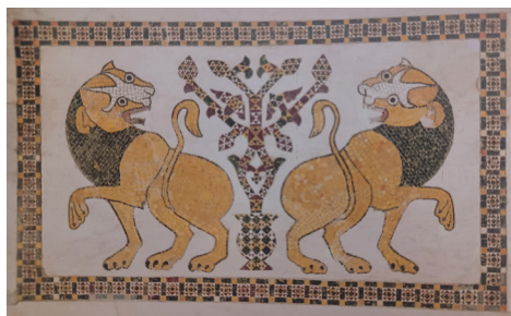
Δύο λέοντες ἐκατέρωθεν τοῦ δέντρου τῆς ζωῆς, παράσταση στό δάπεδο μπροστὰ ἀπὸ τὴν εἴσοδον τοῦ ἱεροῦ (Cappella Palatina)

Ἡ θεμελιώδης αὐτὴ πίστη τῆς Ἐκκλησίας, ὅπως καὶ ὅλα τὰ θεῖα δόγματα, δὲν ἀποτελοῦν ἀνθρώπινες δοξασίες ὅπως οἱ ἀνθρώπινες ἐμπνεύσεις τῶν αἰρετικῶν, ἀλλὰ πίστη βασισμένη στὴν θεοδίδακτη, βιωθεῖσα καὶ ἀποκαλυφθεῖσα πίστη τῶν Ἁγίων. Ὡς ἓνα ἀπὸ τὰ πολλὰ παραδείγματα θὰ ἀναφέρουμε τὸ ἐξῆς: ὅταν φανερώθηκε αἰσθητῶς ἡ ἁγία Εὐφημία στό ἅγιο Παῖσιον, ὁ Ἅγιος φοβούμενος τὴν πλάνη τοῦ διαβόλου, τὸ πρῶτο πού τῆς ὑπέδειξε ἦταν νὰ ὁμολογήσει πίστη στὸν Τριαδικὸ Θεό. Καὶ μόνο ὅταν ἔπραξε τοῦτο ἡ ἁγία Εὐφημία, ὁ ἅγιος Παῖσιος πείστηκε ὅτι τὸ ὄραμα πού βίωσε ἦταν θεϊκὴ ἐπίσκεψη καὶ ὄχι δαιμονικὴ ἀπάτη. Αὐτὸ τὸ θαυμαστὸ γεγονός ἀλλὰ καὶ ὅλα τὰ θαυμαστά γεγονότα πού βιώνονται μέσα στὴν Ὁρθόδοξη Ἐκκλησία καθημερινὰ ἀποδεικνύουν μὲ τὸν πιὸ ἐμφαντικὸ τρόπο ὅτι ἡ πίστη τῶν Ἁγίων Οἰκουμηνικῶν Συνόδων καὶ τῶν Πατέρων τῆς Ἐκκλησίας ἀποτελεῖ τὸ ἀσφαλές μέτρο καὶ κριτήριον τῆς ἀληθείας ἀπέναντι στὴν πλάνη τῶν αἱρέσεων.