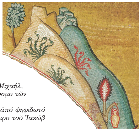
Δεξιά: Λεπτομέρεια ἀπό ψηφιδωτό πού εἰκονίζει τό ὄνειρον τοῦ Ἰακώβ