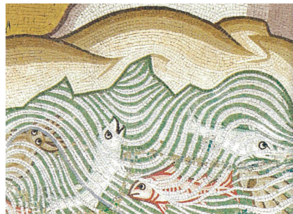
Η δημιουργία των ζώων. λεπτομέρεια