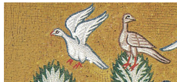
Ἡ δημιουργία τῶν ζῴων, λεπτομέρεια