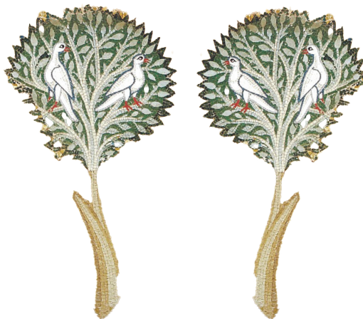
Ἀπομονωμένη λεπτομέρεια ἀπό ψηφιδωτό πού εἰκονίζει τόν Ἡσαῦ νά κυνηγᾷ

Ἀλλά ἡ ὑποχρέωση τῆς ἀκρίβειας ἀφορᾷ ἐπίσης τήν ἴδια τή διεξαγωγή τῆς ἀκολουθίας, ὥστε νά εἶναι σύμφωνη μέ τίς τυπικές διατάξεις τῆς Ἐκκλησίας, ἀπό τίς ὁποῖες δέν ἐπιτρέπονται παρεκκλίσεις.