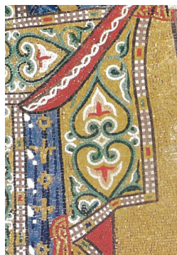
Ἀριστερά: Ὁ ἀρχάγγελος Μιχαήλ, λεπτομέρεια ἀπό τόν διάκοσμον τῶν ἐνδυμάτων του

ΣΗΜΕΙΩΣΕΙΣ. 1. Ἰ. Φουντούλης, Λειτουργική Α' , ὁ.π., σ. 150. 2. Γ. Φίλιας, Παράδοση καί Ἐξέλιξη στή Λατρεία τῆς Ἐκκλησίας , ὁ.π., σ. 290. 3. Ἰ. Φουντούλης, Λειτουργική Α'. Εἰσαγωγή στή Θεία Λατρεία , ὁ.π., σ. 307-309. 4. John Meyendorf, Byzantine Theology , ὁ.π., σ. 119-120: "By accepting monastic spirituality as a general pattern for its worship, the Christian East as a whole expressed the eschatological meaning of the Christian message. The very magnitude of the liturgical requirements described in the Typikon, the impossibility for an average community to fulfill them integrally, and the severity of penitential discipline implied in the liturgical books always served as a safeguard against any attempt to identify the church too closely with the present aion, and as a signpost of the Kingdom to come. If properly understood, the Eastern liturgy places the Church in a permanent eschatological tension" (ἡ μετάφραση δική μας). 5. Μιχ. Καρδαμάκης, «Ἱερωσύνη καί ἐκκοσμίκευση», στό Γ. Φίλιας, Παράδοση καί Ἐξέλιξη στή Λατρεία τῆς Ἐκκλησίας , ὁ.π., σ. 256. 6. Μητρο. Περγάμου Ἰωάννης (Ζηζιούλας), «Εὐχαριστία καί Βασιλεία τοῦ Θεοῦ», ὁ.π., 49 (1994), σ. 14. 7. Σμέμαν, ὁ.π., σ. 256.