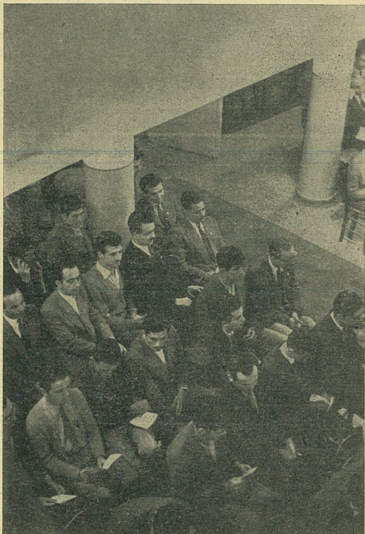
Ὅμας φοιτητῶν τοῦ Θεολογικοῦ Οἰκοτροφείου παρακολουθοῦντων ὁμιλίαν εἰς τὴν αἴθουσαν τελετῶν.