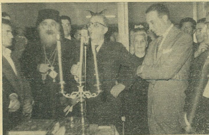
Ἀπὸ τὴν τελετὴν τῶν ἐγκαίνιων τοῦ «Ἐνοριακοῦ Κέντρου» Ἁγ. Γεωργίου Νέας Ἰωνίας (Ἀθηνῶν).

Μέσα εἰς τὸ πλαίσιον μιᾶς πνευματικῆς προσπάθειας—μὲ τὴν εὐκαιρίαν τῆς εἰσόδου εἰς τὸ νέον ἐκκλησιαστικὸν ἔτος—καὶ μὲ τὸ σύνθημα: «Σώσατε τὸ παιδί», ὀργανώθη τὴν Κυριακὴν 30ῆν Ὀκτωβρίου ἐ.ἔ. μία ὡραία ἑορτὴ εἰς τὴν Ἐνορίαν τοῦ Ἁγίου Γεωργίου Ν. Ἰωνίας (Ἀθηνῶν).