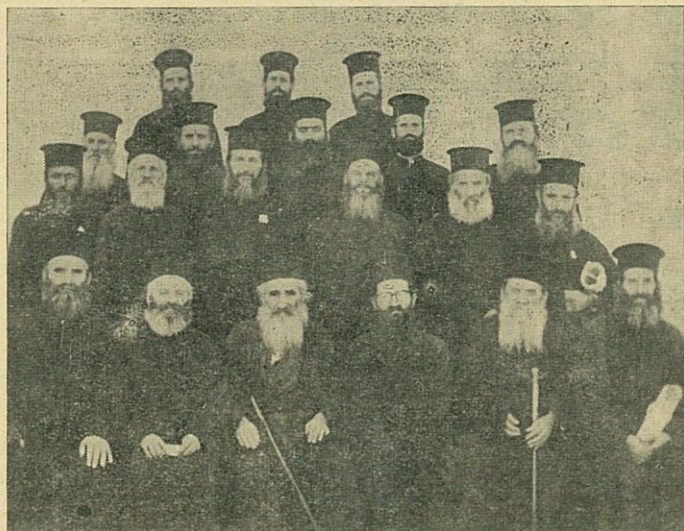
Οἱ Ἐφημέριοι Κατηχηταὶ τῆς περιοχῆς Ἐορδαίας (Ἱ. Μητροπόλεως Φλωρίνης κλπ.) εἰς τὸ Συνεδριὸν τῶν.