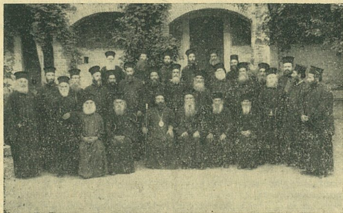
Οἱ λαβόντες μέρος εἰς τὸ Α' Ἱερατικὸν Συνέδριον τῆς Ἱ. Μητροπόλεως Μηθύμνης μετὰ τοῦ Σεβ. Μητροπολίτου αὐτῶν κ. Κωνσταντίνου.

Τὴν 18ην Ἰουλίου ἐτελέσθη ἱερατικὸν συλλεῖτουργον, κατὰ τὸ ὁποῖον πάλιν ἐκοινώνησαν τῶν ἀχράντων Μυστηρίων ἅπαντες οἱ Ἱερεῖς. Μετὰ τὸ πέρασ αὐτοῦ ὁ Σεβ. Μητροπολίτης, μεταβάς μεθ' ὅλου τοῦ Κλήρου εἰς τὸ κοιμητήριον τῆς Μονῆς, ἐτέλεσε Τρισάγιον ἐπὶ τῶν τάφων τῶν πατέρων καὶ ἀδελφῶν τῆς Ἱ. Μονῆς. Οὕτως ἑτεροματίσθη τὸ Α' Ἱερατικὸν Συνέδριον τῆς Ἱερᾶς Μητροπόλεως Μηθύμνης.