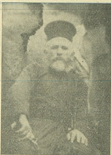
Ὁ μάρτυς ἱερεὺς Γεώργιος Ζώης

Ὁ Ἱερεὺς ὁμως Ζώης ἀμέσως κατάλαβε τὸν κίνδυνον, ποῦ ἀπ' αὐτοὺς διατρέχει ἡ Ἐκκλησία μας καὶ δλόκληρο τὸ Ἔθνος. Ἄρχισε γι' αὐτὸ πύρινα κηρύγματα, μὲ τὰ ὁποῖα ἀπεκάλυπτε τοὺς ἀνιέρους σκοποὺς τῶν προδοτῶν. Καὶ καλοῦσε ὅλους νὰ συσπειρωθοῦν σὲ ἀδιάρρηκτη ἐθνικὴ ἐνότητα, νὰ ἐπαγρυπνοῦν καὶ νὰ μὴ δέχωνται οὔτε κἂν τὶς συνανατροφές τῶν ξενοκινήτων αὐτῶν προδοτῶν τῆς Πίστεως καὶ τῆς Πατρίδος. Χαρακτηριστικὸ δὲ εἶναι, ὅτι τὸ 1933 σὲ μιὰ δίκη φανατικῶν καὶ ἡγετικῶν κομμουνιστῶν ἀπ' τὴν ἐνορία του, παρρουσιάσθηκε ὡς μάρ-