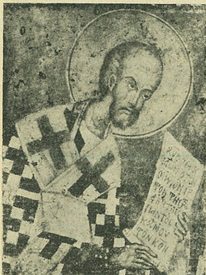
Ὁ Ἅγιος Ἰωάννης ὁ Χρυσόστομος

Θέλω νὰ σᾶς βεβαιώσω, Χριστιανοί μου γονεῖς, ἕως πού σᾶς καταξίωσεν ὁ Κύριος νὰ γίνετε πατέρες καὶ μητέρες, πὼς μεγάλη ἀνταμοιβή σᾶς περιμένει ψηλὰ ἀπὸ τὸν ἐπουράνιο πατέρα μας, ἂν μ' ἐπιμέλεια κι' εὐσυνείδητα, καὶ μ' ἀνύστακτο κόπο καὶ μ' ἀγάπη μεγάλη, μοχθήσετε γιὰ τὴν ἀνατροφή καὶ γιὰ τὴν μόρφωσι τῶν παιδιῶν σας, ὥστε νὰ γίνουνε ἀληθινοὶ Χριστιανοί.