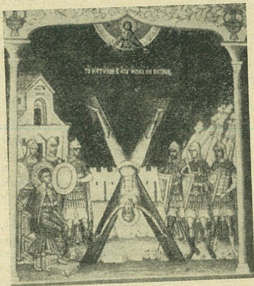
Τὸ μαρτύριον τοῦ Ἀποστόλου Ἀνδρέου ἐν Πάτραις.

Γνωρίζουμε ποιοὶ ἦσαν. Γαλιλαῖος, τοὺς διάλεξε μέσα στοὺς