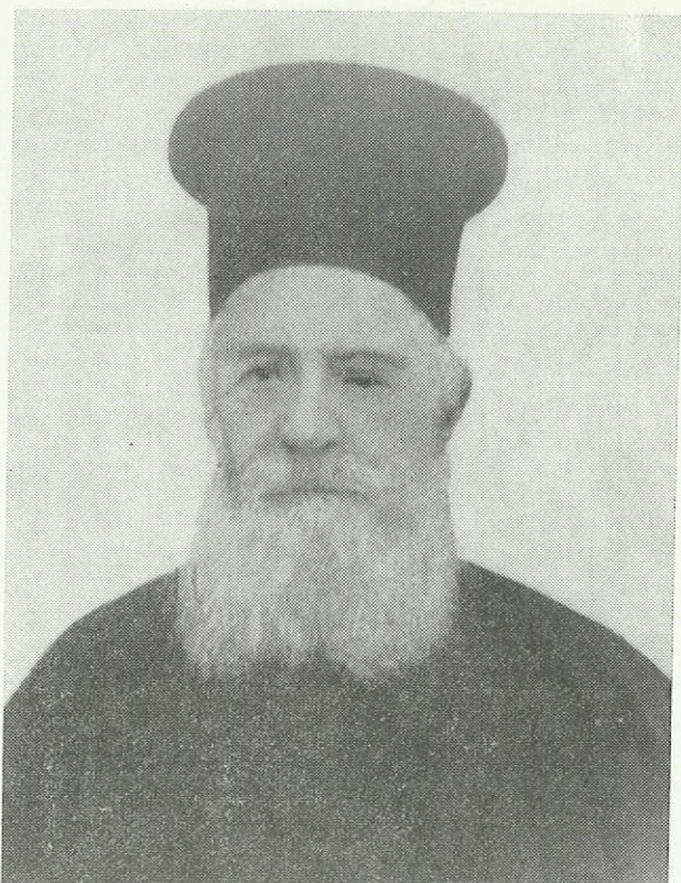
Ἀρχιμ. Παρθένιος Περίδης (†)

ὅμως ἐκεῖ. Περιφρονεῖ καὶ θέσεις καὶ ἄνεση καὶ τὸ 1851 ξαναγυρίζει στὴ Κρήτη γιὰ νὰ συνεχίση τοὺς σκληροὺς ἀγῶνες του. Ἰδρύει σχολεῖα καὶ κάνει τὸν Ἑλληνοδιδάσκαλο σὲ διάφορα μέρη. Μὲ ἐν- θουσιασμό, μὲ ζῆλο καὶ αὐταπάρνηση διδάσκει καὶ καλλιεργεῖ τὸν πατριωτισμὸ στὶς ψυχὰς τῶν μαθητῶν του. Κηρύσσει στὶς ἐκκλησίαις καὶ προπαγανδίζει τὴν ἐξέγερση τῆς Κρήτης γιὰ τὴν ἀποτίναξή τοῦ Τουρκικοῦ ζυγοῦ.