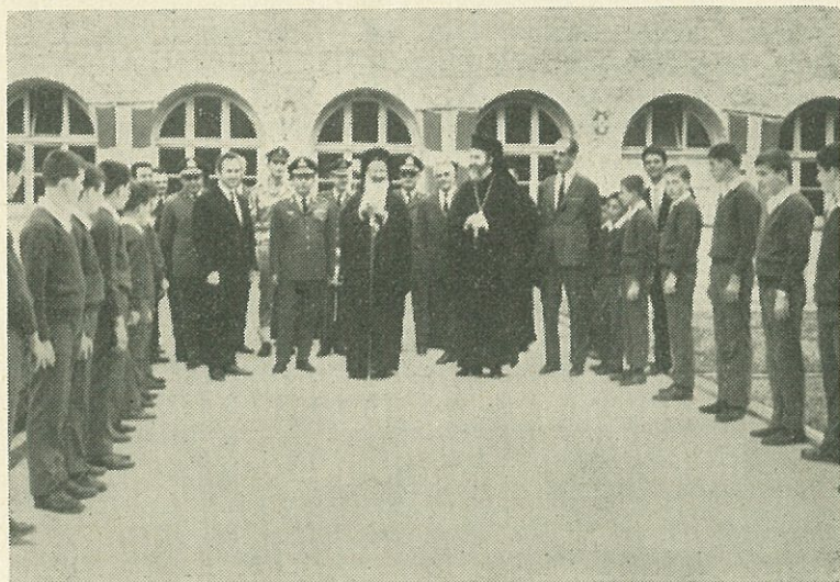
Ὁ Μακαριώτατος μετὰ τοῦ Σεβ. Δρυϊνουπόλεως καὶ λοιπῶν ἐπισήμων κατὰ τὴν ἐπίσκεψίν του εἰς τὸ Ἐθνικὸν Ὁρφανοτροφεῖον Κονίτσης.

Σὰν πατῆ κανεὶς τὰ ἱερά χῶματα τῆς μεθορίου, ζῆ μιὰν ἄλλη διάστασι. Ξεφεύγει ἀπ' τὰ συνηθισμένα πλαίσια τῆς συμβατικότητος, καὶ πετάει σ' αἰθέρια ὕψη. Ἐνώνεται μὲ τὴν ἀστείρευτη πηγὴ τοῦ ἔθνους. Σὰν τὸν Ἀνταῖο, παίρνει δύναμι στὴν κάθε ἐπαφὴ του μὲ τὶς ἱστορικὲς πραγματικότητες. Νοιώθει νὰ βοηθῆται στὴν κολυμβήθρα τοῦ στοχασμοῦ. Κι' ἡ ἀνεπόλησι τῆς ἱστορίας γίνεται φίλτρο καρδιακὸ κάθε συναισθήματος. Ἐκεῖ στὴ μεθόριο, νοιώθει κανεὶς περισσότερο ὀρθόδοξος, περισσότερο Ἑλληνας. Γιατὶ ἀναβαπτίζεται στὰ αἰῶνια νάματα τοῦ