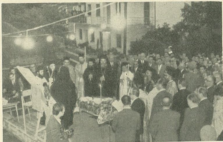
Ὁ Μακαριώτατος, περιστοιχιζόμενος ὑπὸ τῶν ἐπισήμων, τελεῖ ἐπὶ τῆς εἰδικῆς ἐξέδρας, τὸν ἀγιασμόν ἐπὶ τῇ θεμελιώσει τοῦ Ἱεροῦ Ναοῦ τοῦ Ἐθνομάρτυρος Κοσμᾶ τοῦ Αἰτωλοῦ ἐν Κονίτῃ.

Ψηλά στὴν Οὐρίντα ὁ ἀέρας χαϊδεύει ἀπαλὰ τὰ πρόσωπά μας. Δίπλα μας οἱ Πρέσπες. Μπροστά μας ἡ Βόρειος Ἕπειρος, ἡ ἀλύτρωτη. Νοιώθουμε ὑπερηφάνεια κι' εὐγνωμοσύνη γιὰ τὸ δῶρο τῆς ἐλευθερίας, ποῦ μᾶς χάρισε ὁ Θεός. Σφίγγονται ὁμως οἱ καρδιές μπροστὰ στὴν σκλάβα γῆ. Τὸ μεγάλο πρόβλημά μας, τὸ θέμα τῆς καρδιάς τῶν Ἕπειρωτῶν καὶ ὄλων τῶν Ἑλλήνων, ἡ Βόρειος Ἕπειρος. Μεγάλοι καὶ μικροί, παιδιὰ καὶ γέροι, στρατός καὶ λαὸς μ' ἓνα στόμα ψάλλουν: «Ἔχω μιὰν ἀδελφή, κουκλίτσα ἀληθινή, τὴν λένε Βόρειο Ἕπειρο, τὴν ἀγαπῶ πολὺ». «Γιὰ τοῦτο μιὰν ἀυγὴ, χωρὶς διαταγὴ, θὰ τρέξω ν' ἀγκαλιάσω γὰ τὴν δόλια μ' ἀδελφή». Θεέ μου! Κάμε ὥστε τὰ ἠλεκτροφόρα σύρματα νὰ μὴ κάψουν τὴ φτωχὴ ἐλπίδα τῆς λευτεριάς ἀπ' τὰ στήθη τῶν ὑποδούλων. Οἱ ριπές τῶν ὀπλων, νὰ μὴ σκοτώσουν τὴν πίστι ἀπ' τὶς καρδιές των. Κι' ὁ κόκκινος χεῖμαρρος, νὰ μὴ